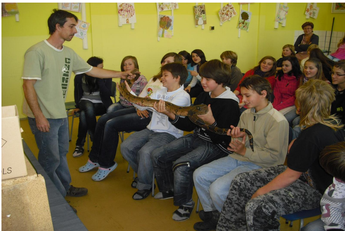
Přednáška o hadech a ještěrech