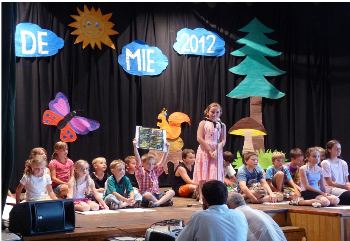
Školní akademie – vystoupení žáků 2. a 5. ročníku