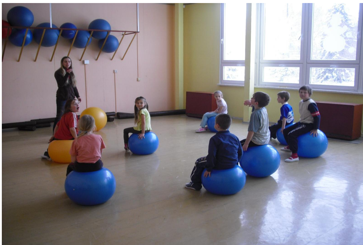
Hodina tělesné výchovy