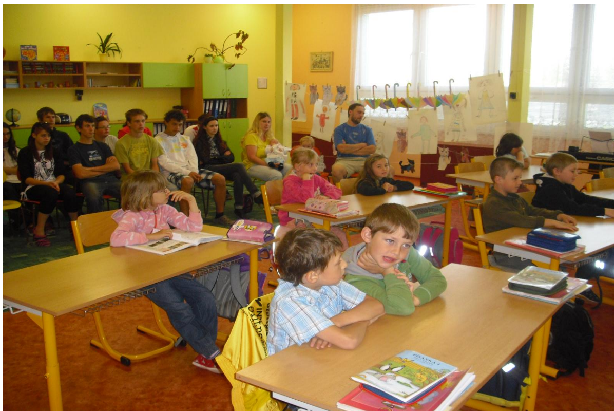
Projekt „Nejstarší společně s nejmladšími“ – návštěva žáků 9. ročníku u svých „prvňáčků“

Celkem se vyučovalo v 7 třídách. Během školního roku bylo otevřeno jedno oddělení školní družiny, bylo plně obsazeno.