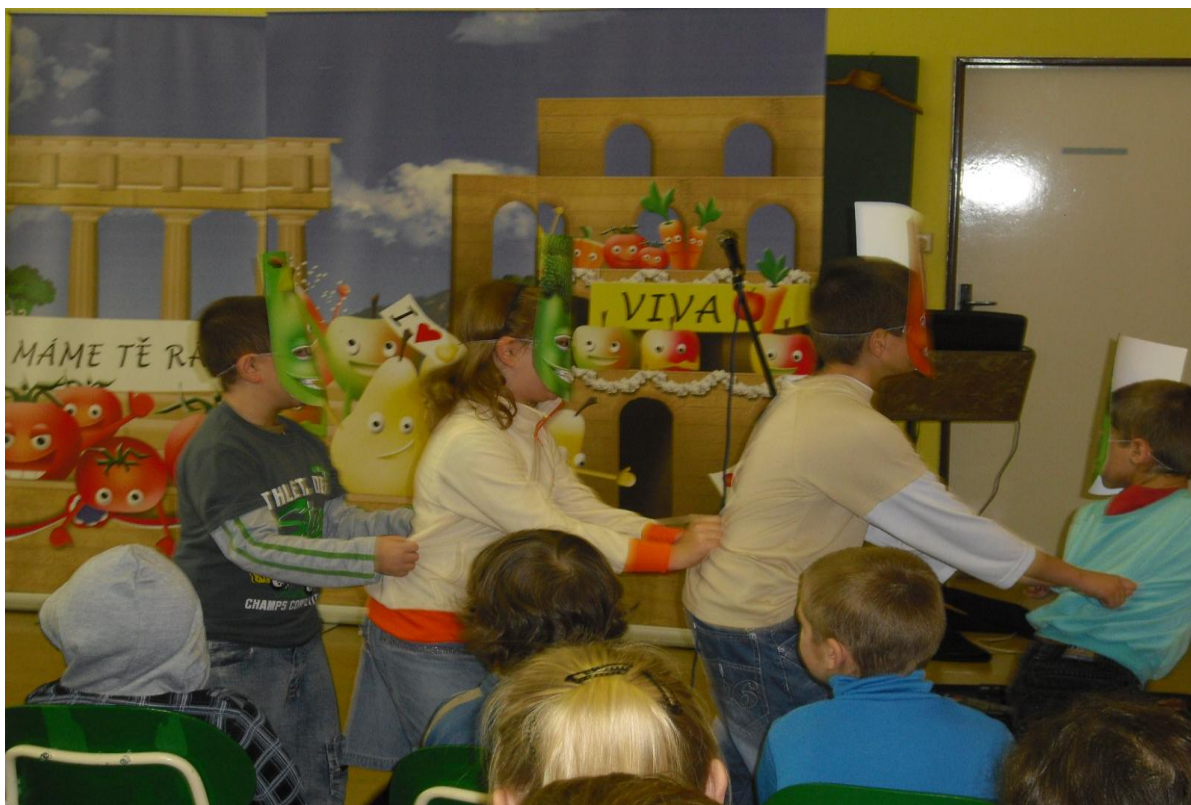
„Zelenina s ovocem, dají páku nemocem“ – divadelní představení v rámci projektu Dne zdraví