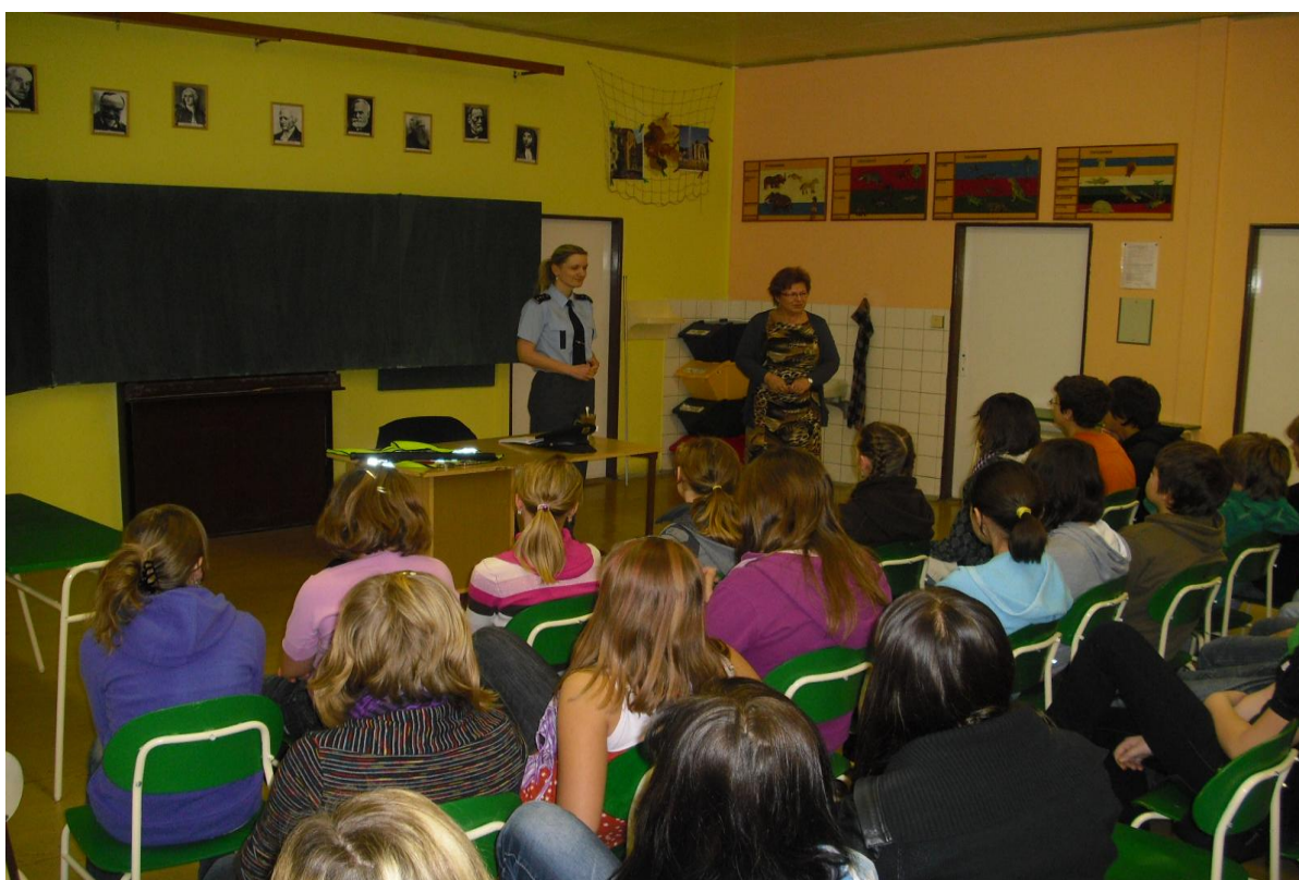
„Právní odpovědnost nezletilých“ – spolupráce s Policií ČR – 2. stupeň