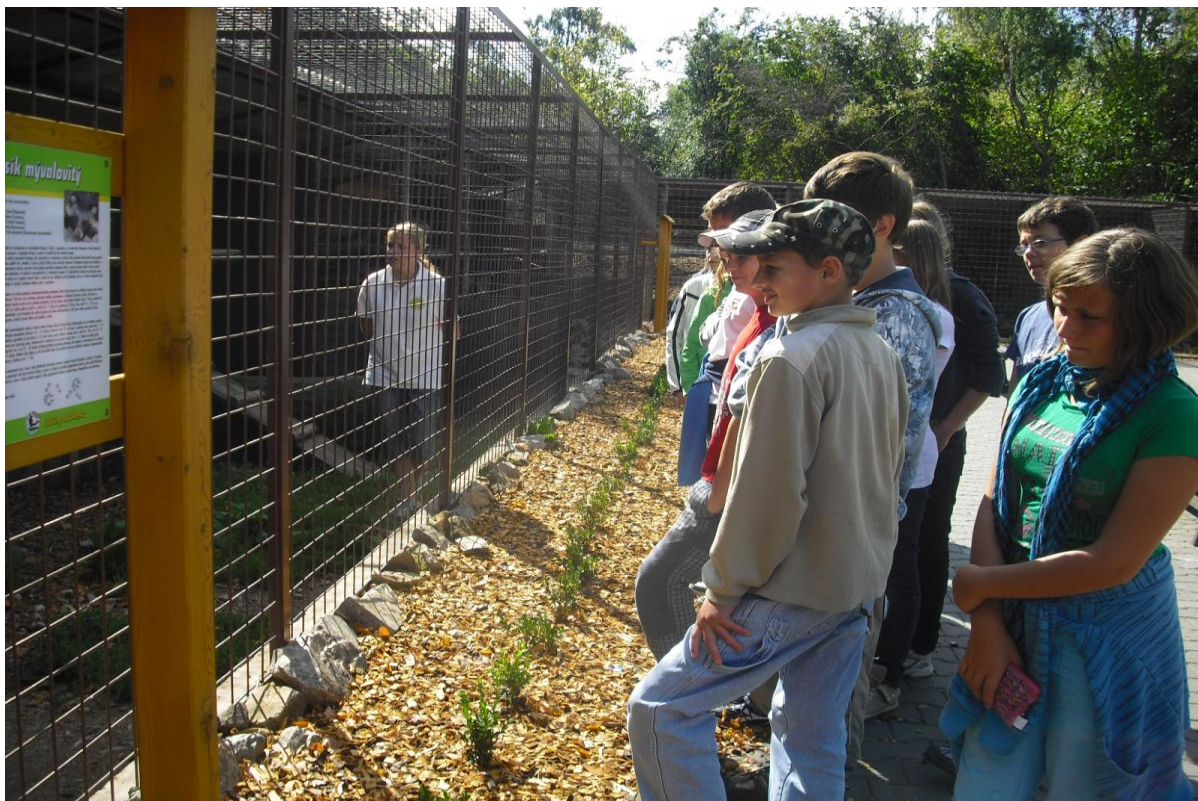
Prohlídka záchranné stanice Pasíčka – 2. stupeň