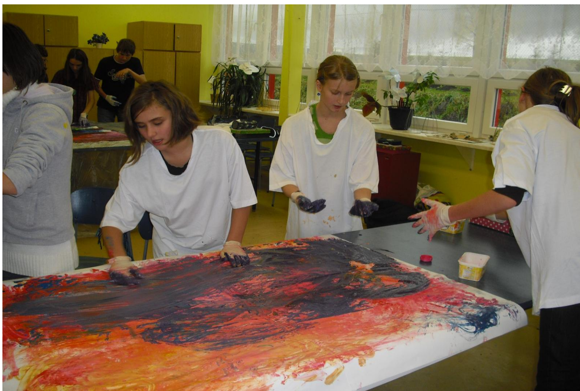
Výtvarná výchova – 2. stupeň