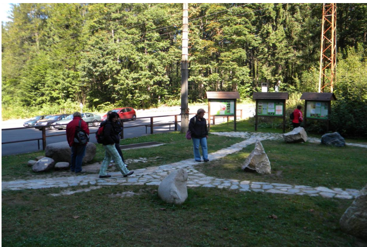
Školení v lázních Jeseník – exkurze