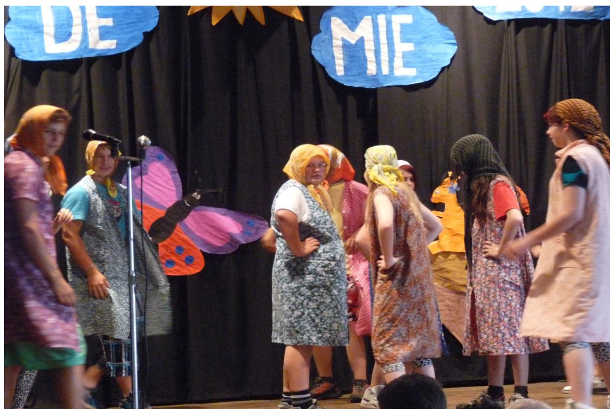
Školní akademie – závěrečný tanec 9. ročníku