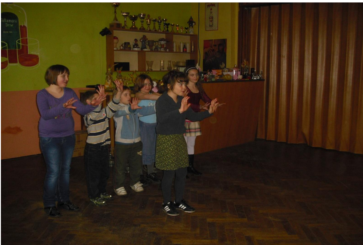
Vystoupení žáků na velikonočním posezení důchodců