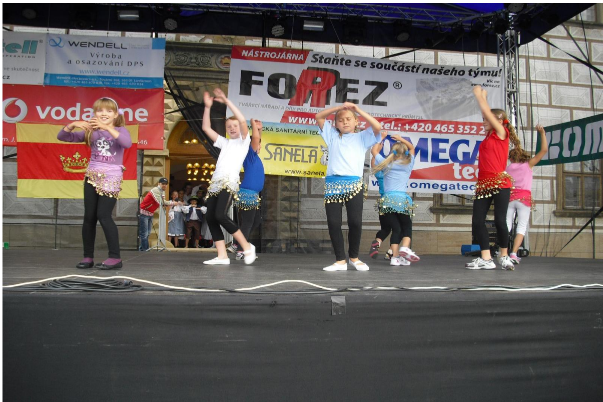
Lanškrounská kopa – vystoupení žákyň 1. stupně