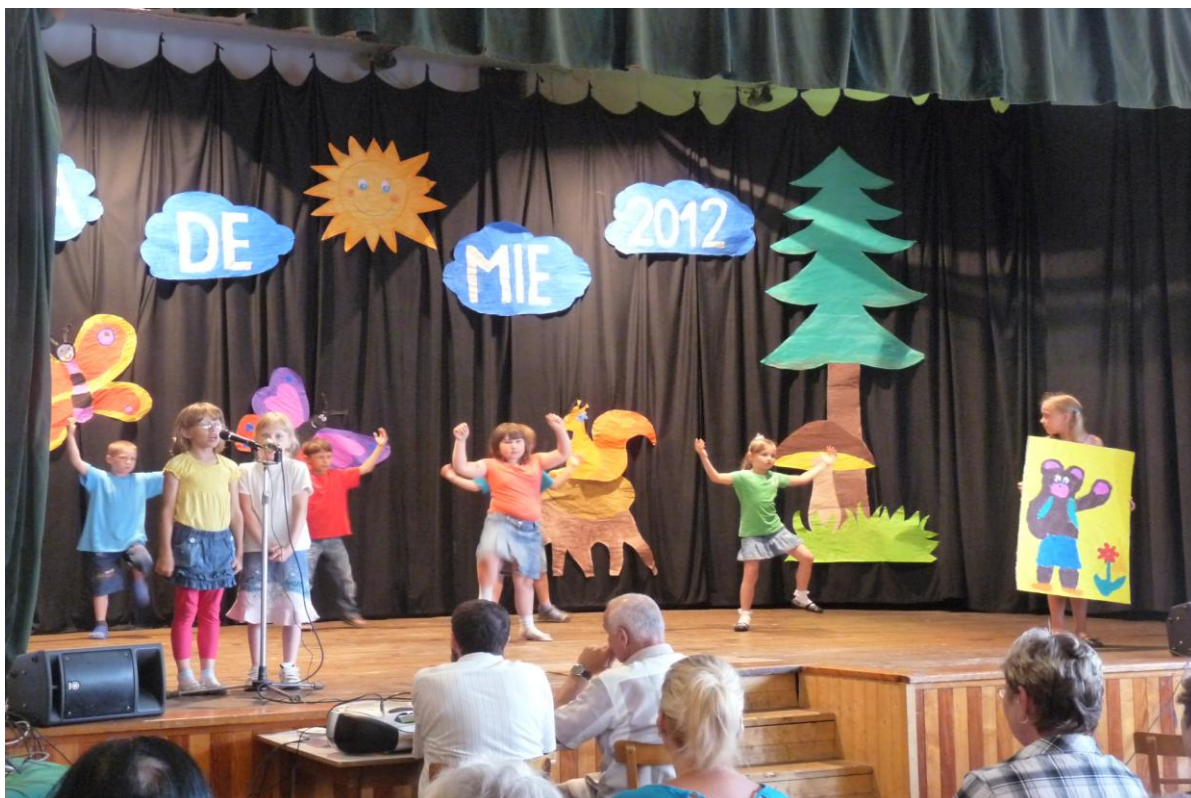
Školní akademie – pohybově – recitační vystoupení žáků 1. ročníku