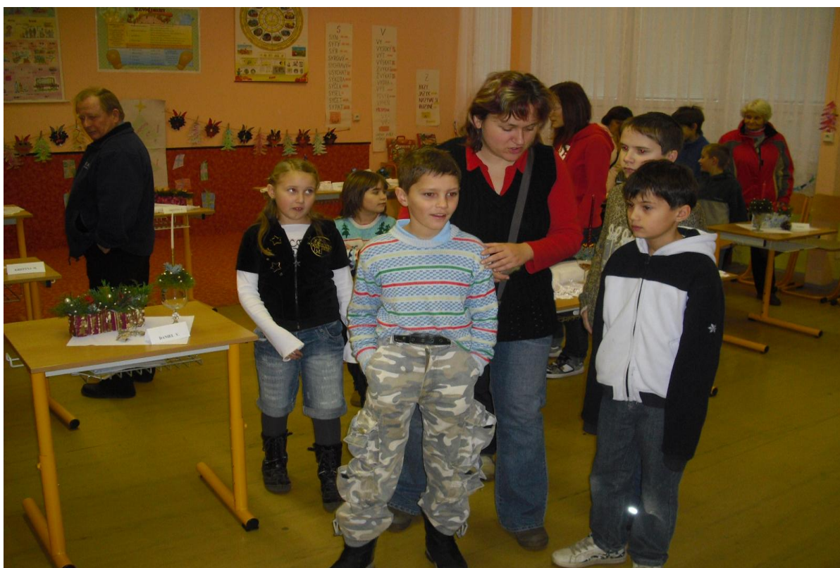
Účast ZŠ Luková na vánoční výstavě