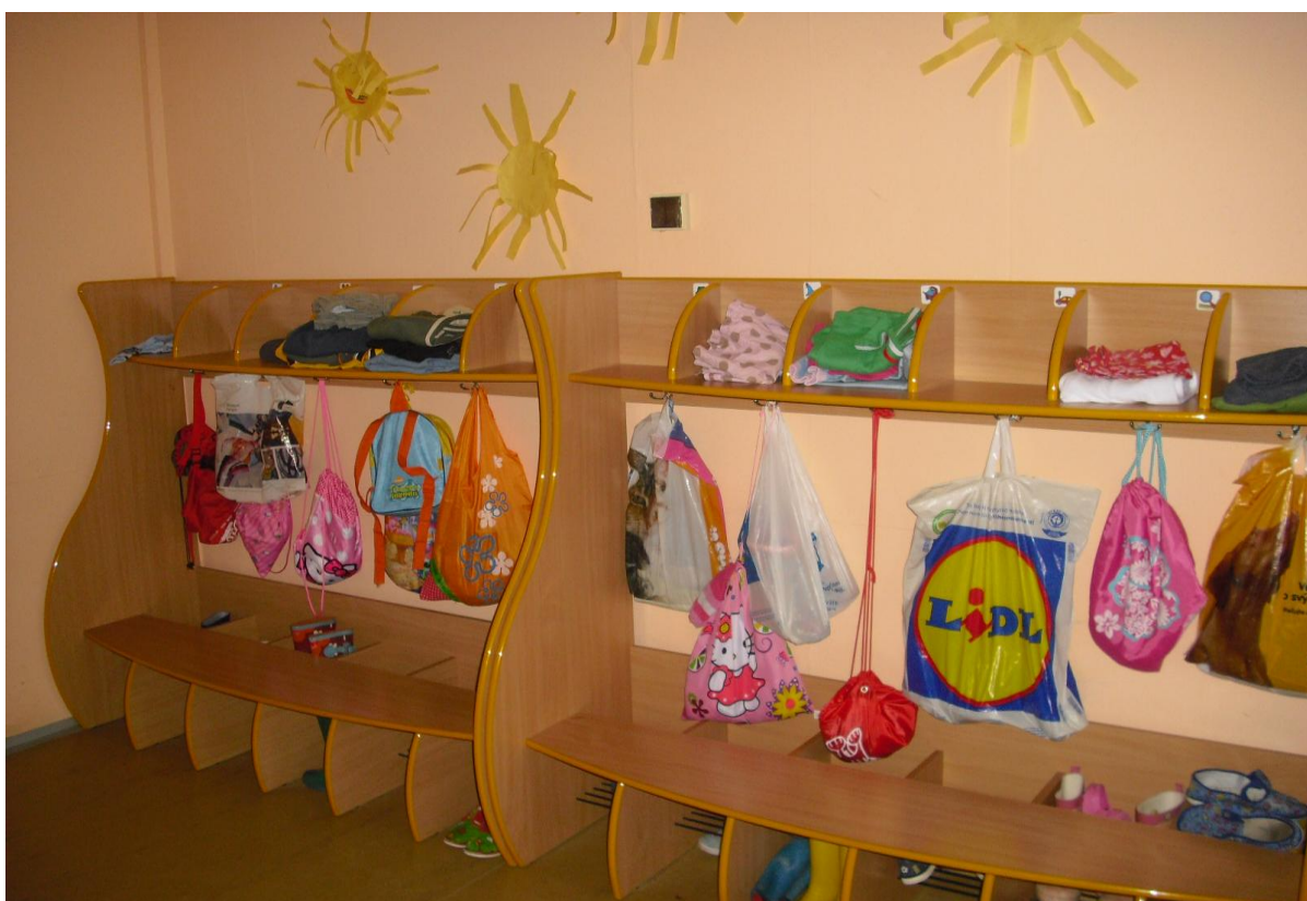
Společná rozšířená šatna dětí mateřské školy