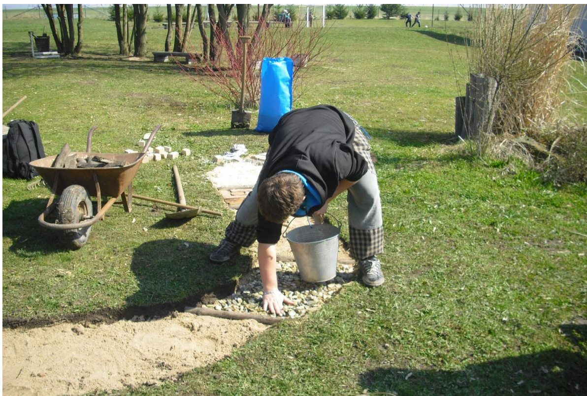
Budování „Smyslové stezky“ – přemístění