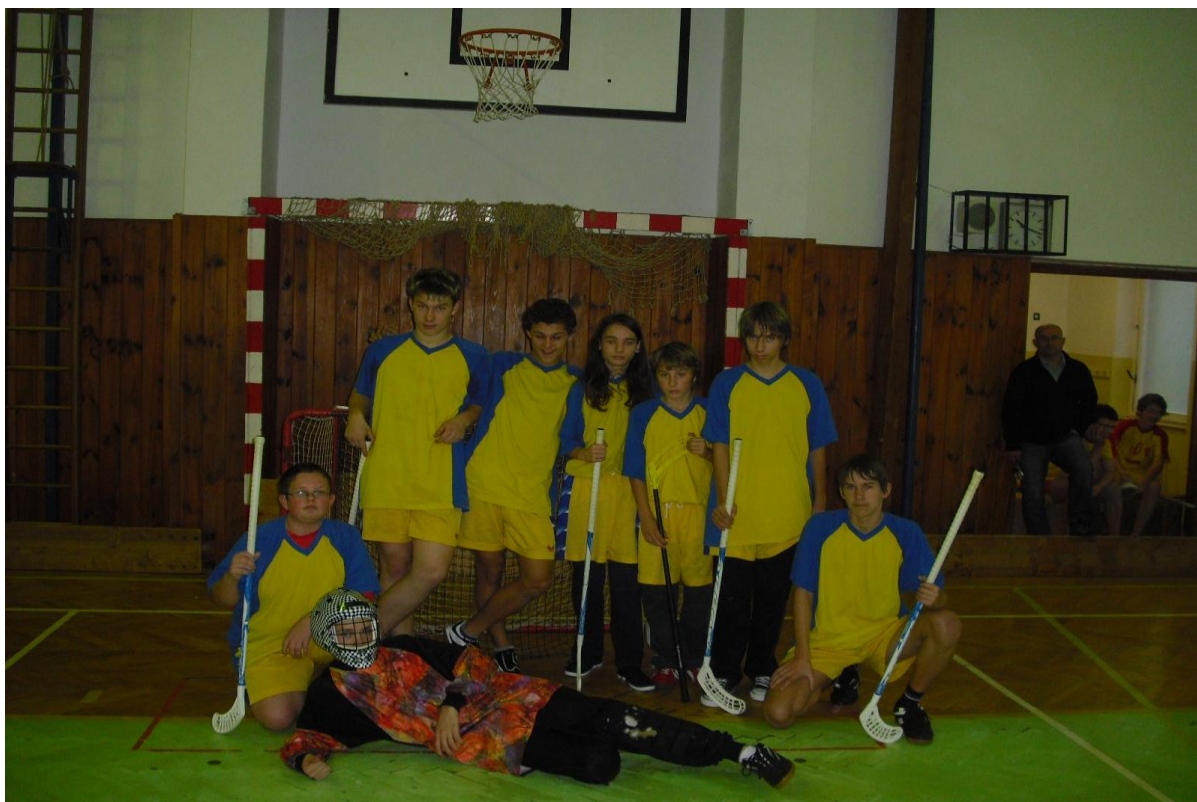
Členové školního týmu na florbalu v Lanškrouně