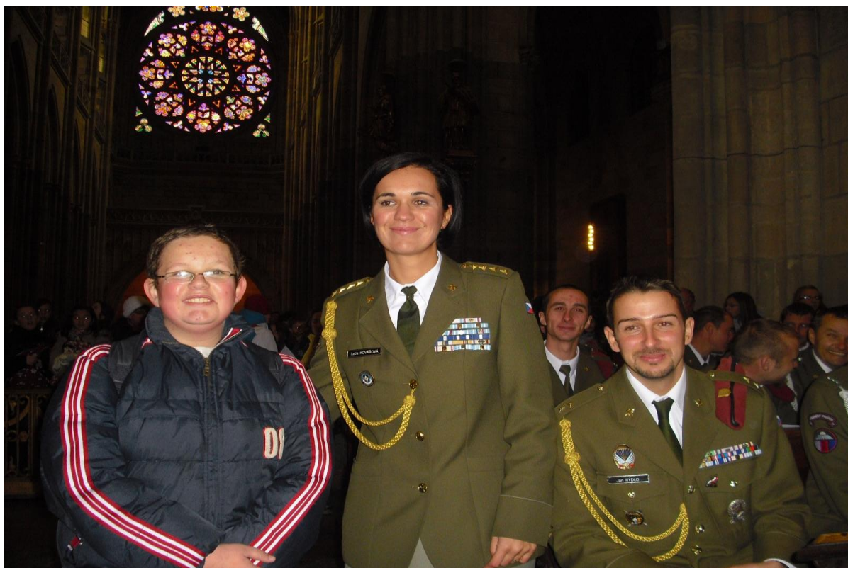
Slavnostní mše v katedrále Svatého Víta – setkání s příslušníky vojenské mise v Afganistánu