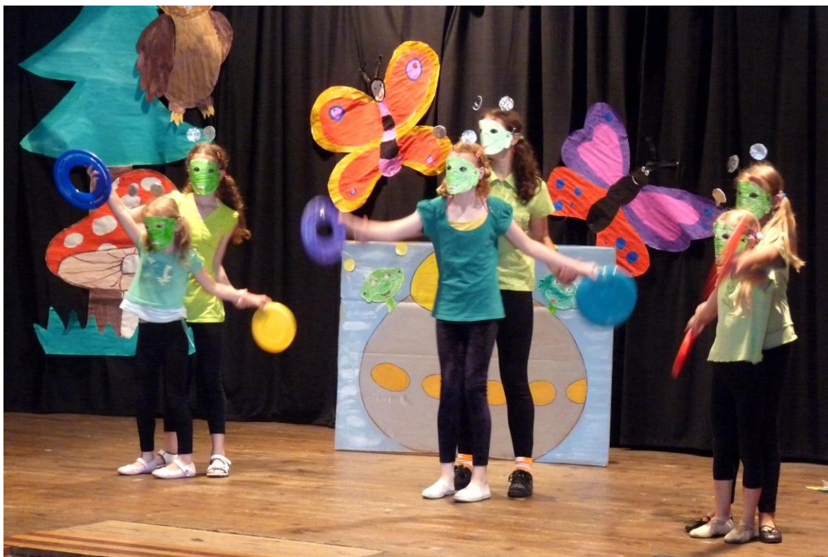
Školní akademie – vystoupení školní družiny