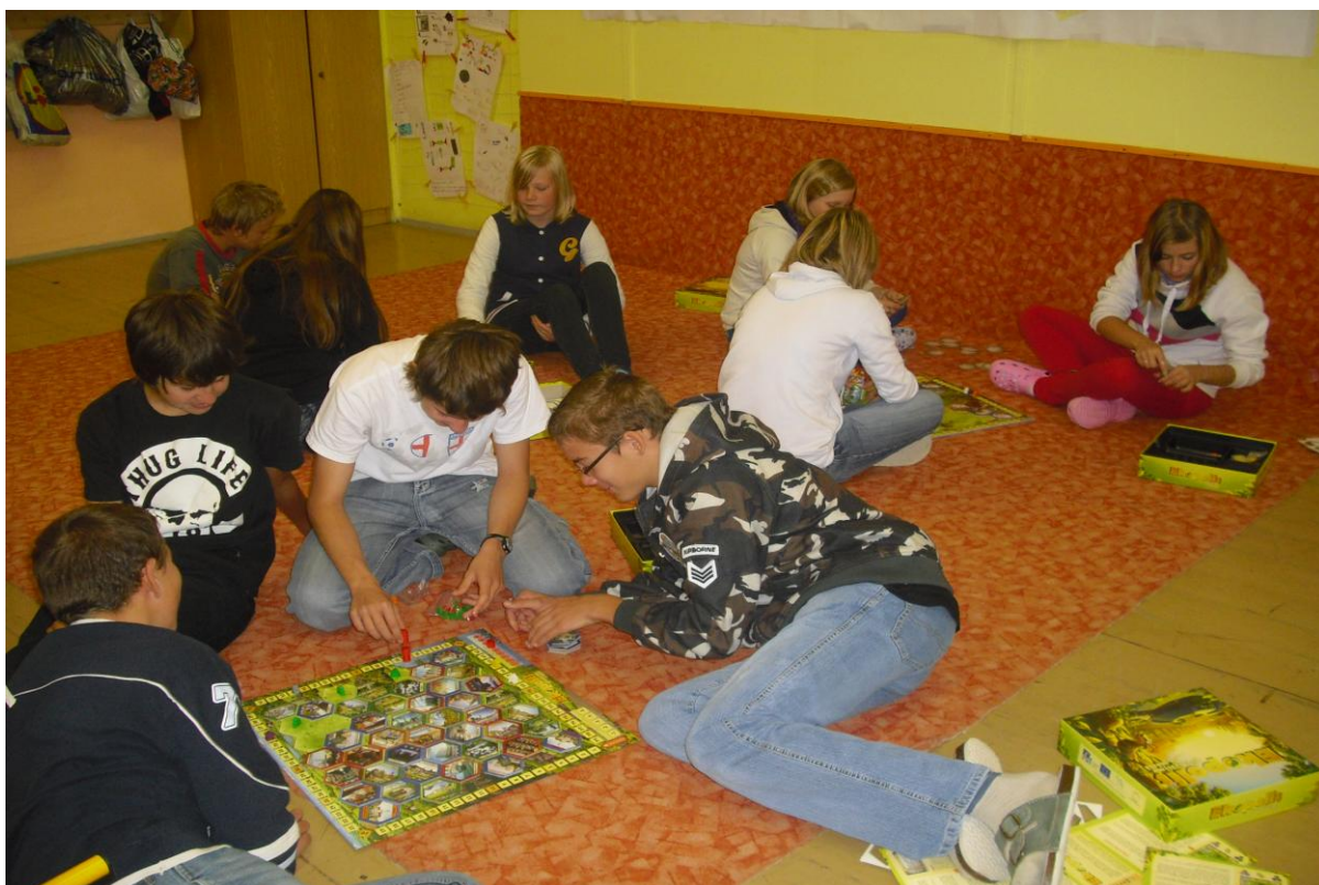
Hra se stavebnicí EKOPOLIS

V rámci spolupráce s Ochranou fauny ČR jsme se zapojili do projektu – EVVOLUCE. V rámci projektu vyhlášovatel vytvořil 30 výukových balíčků zaměřených na environmentální výchovu se zařazením všech průřezových témat. Partnerské školy měly možnost vyzkoušet v praxi tyto výukové balíčky, které obsahovaly metodiku, pracovní listy i pomůcky.