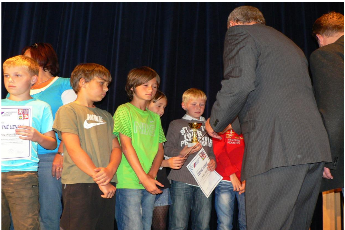
Předávání cen jednotlivcům při vyhodnocení Atletického čtyřboje