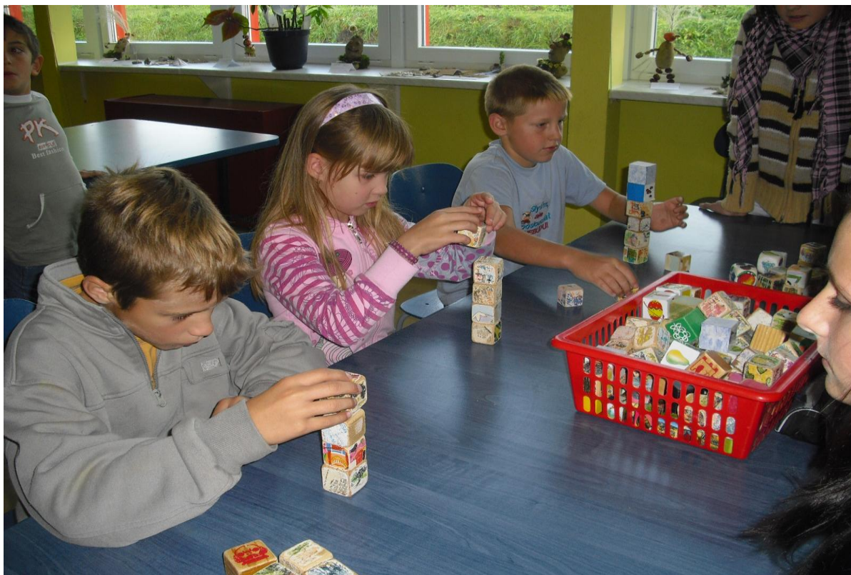
Každý to zvládne