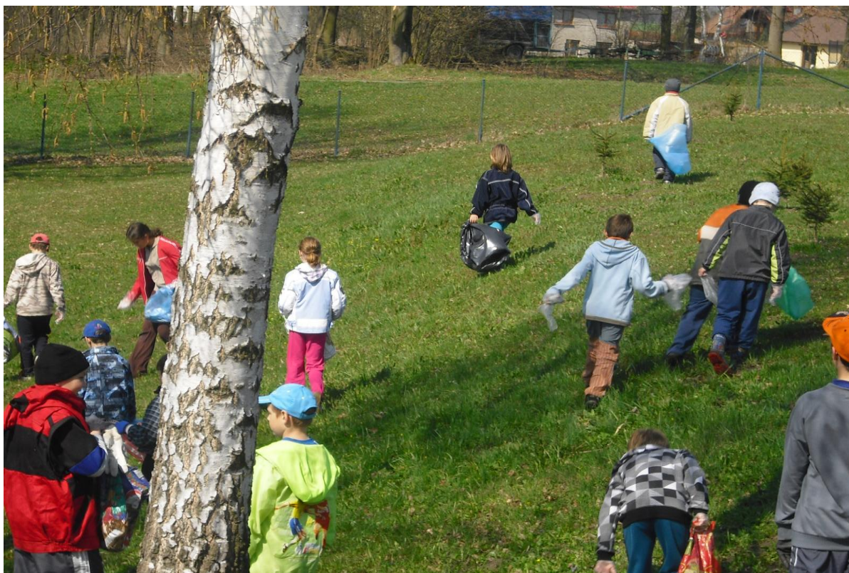
Den Země – 1. stupeň