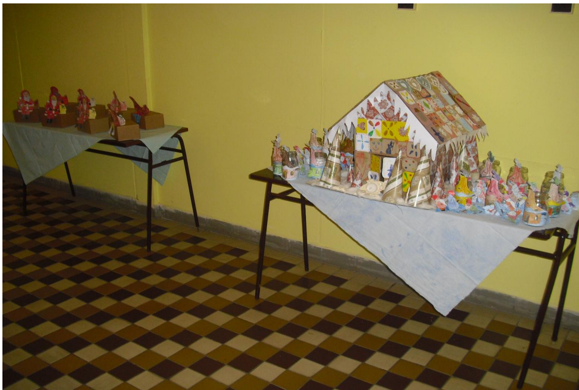
Výstava výrobků školní družiny na vánoční výstavě