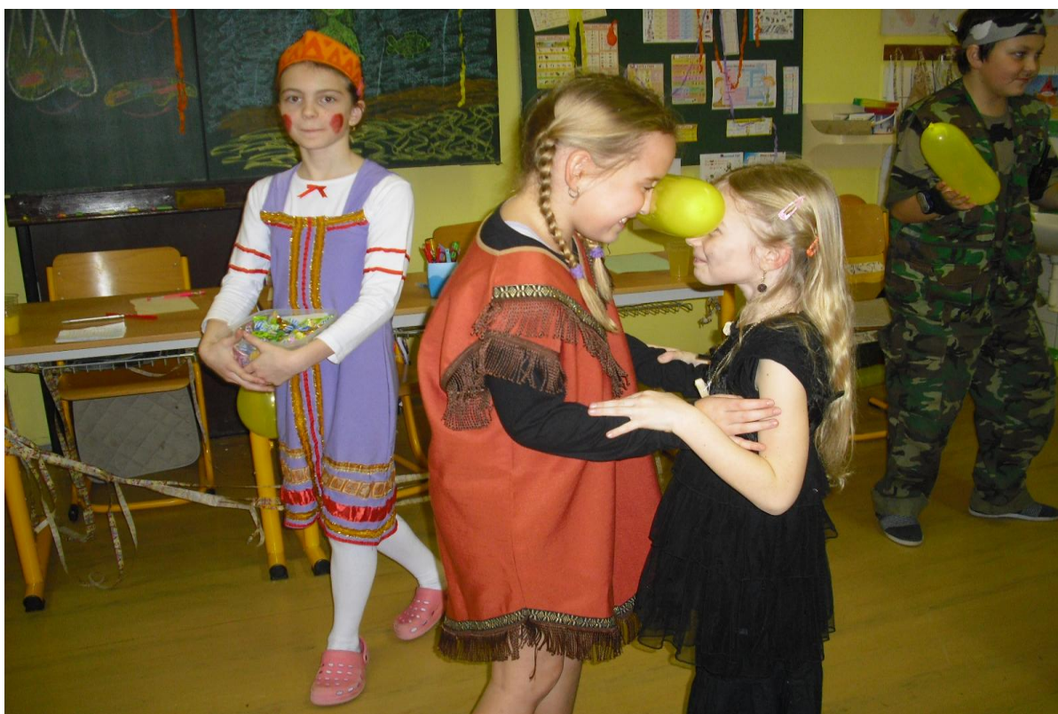
Karneval 5. ročníku