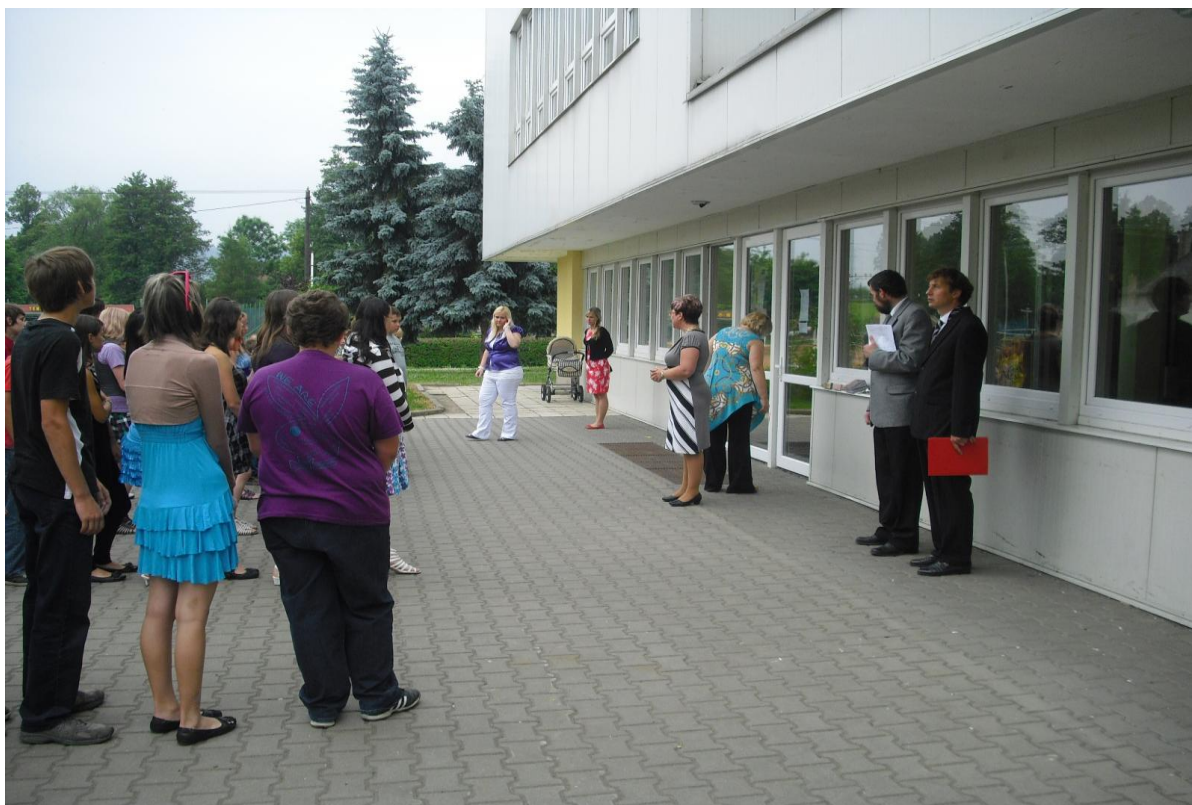
Společné ukončení školního roku před budovou školy