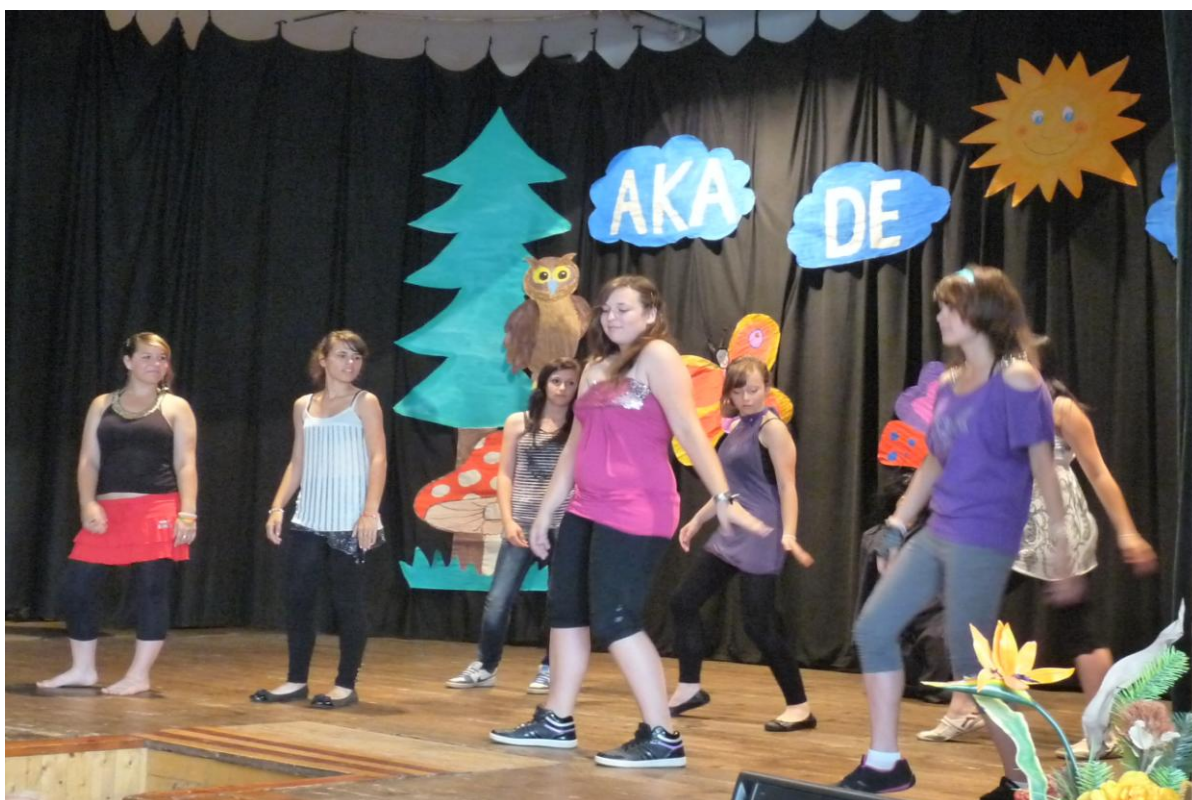
Školní akademie – vystoupení žákyň 8. ročníku