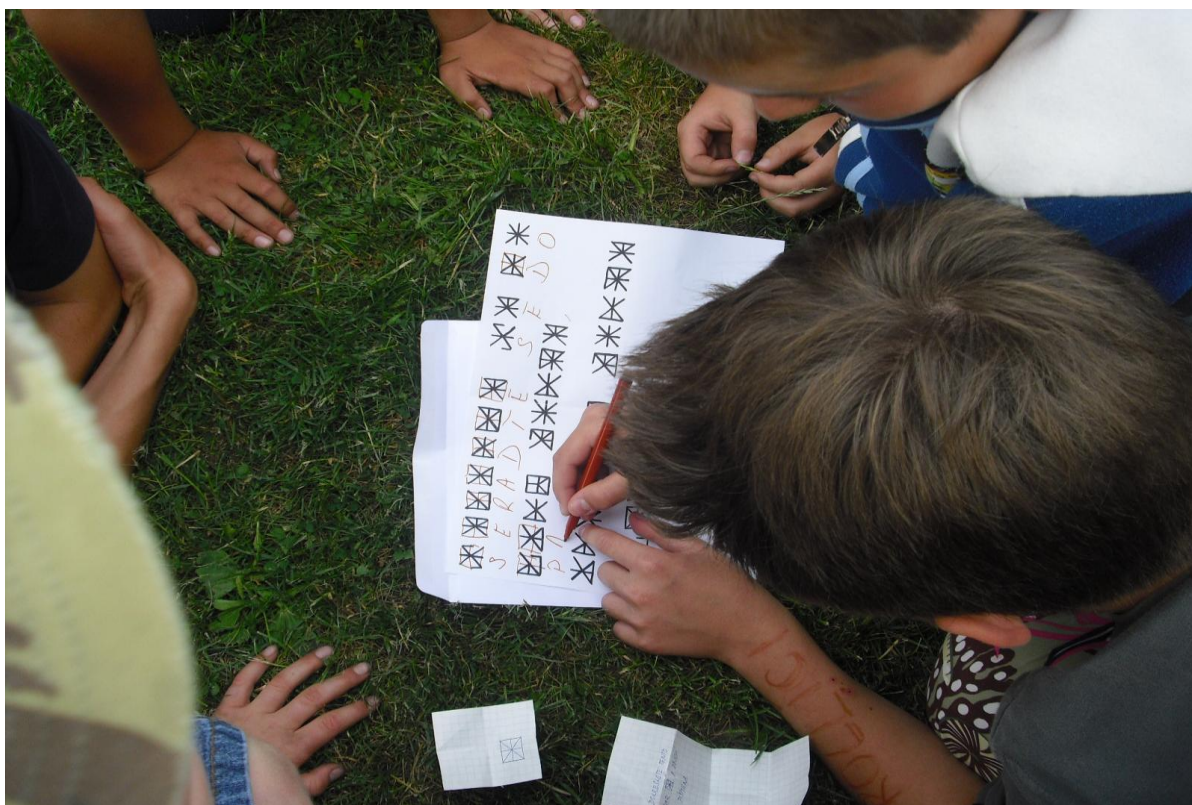
„Pohádky Tisíce a jedné noci“ – spolupráce, tvořivost, fantazie, zdravá soutěživost