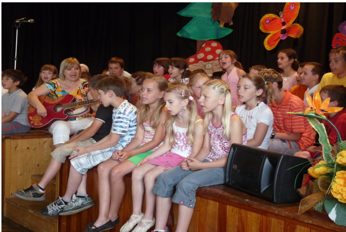
Školní akademie – pěvecké vystoupení žáků 2. - 5. ročníku