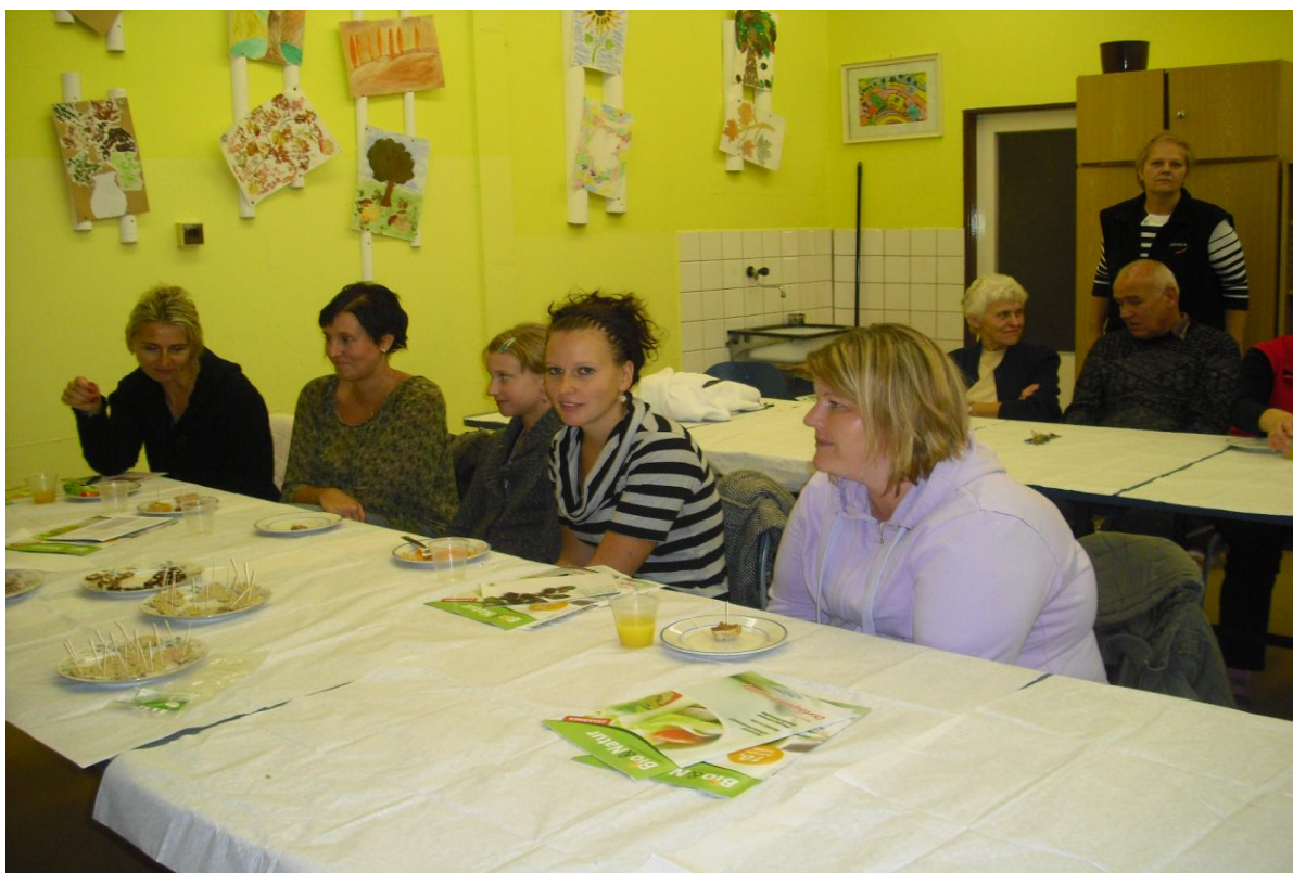
Účast rodičů na besedě zaměřené na zdravou výživu