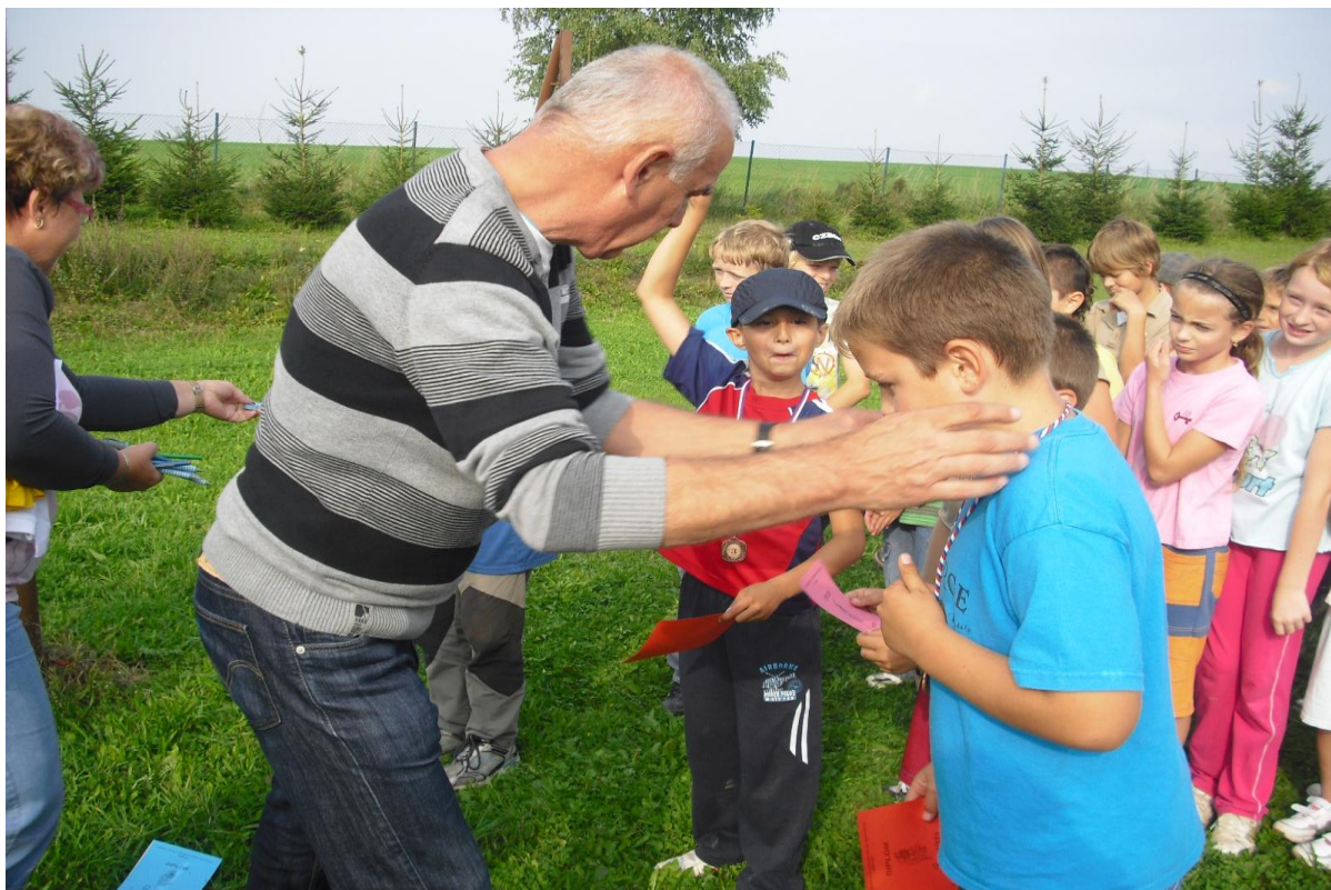
Předávání cen na Damníkowském trojboji