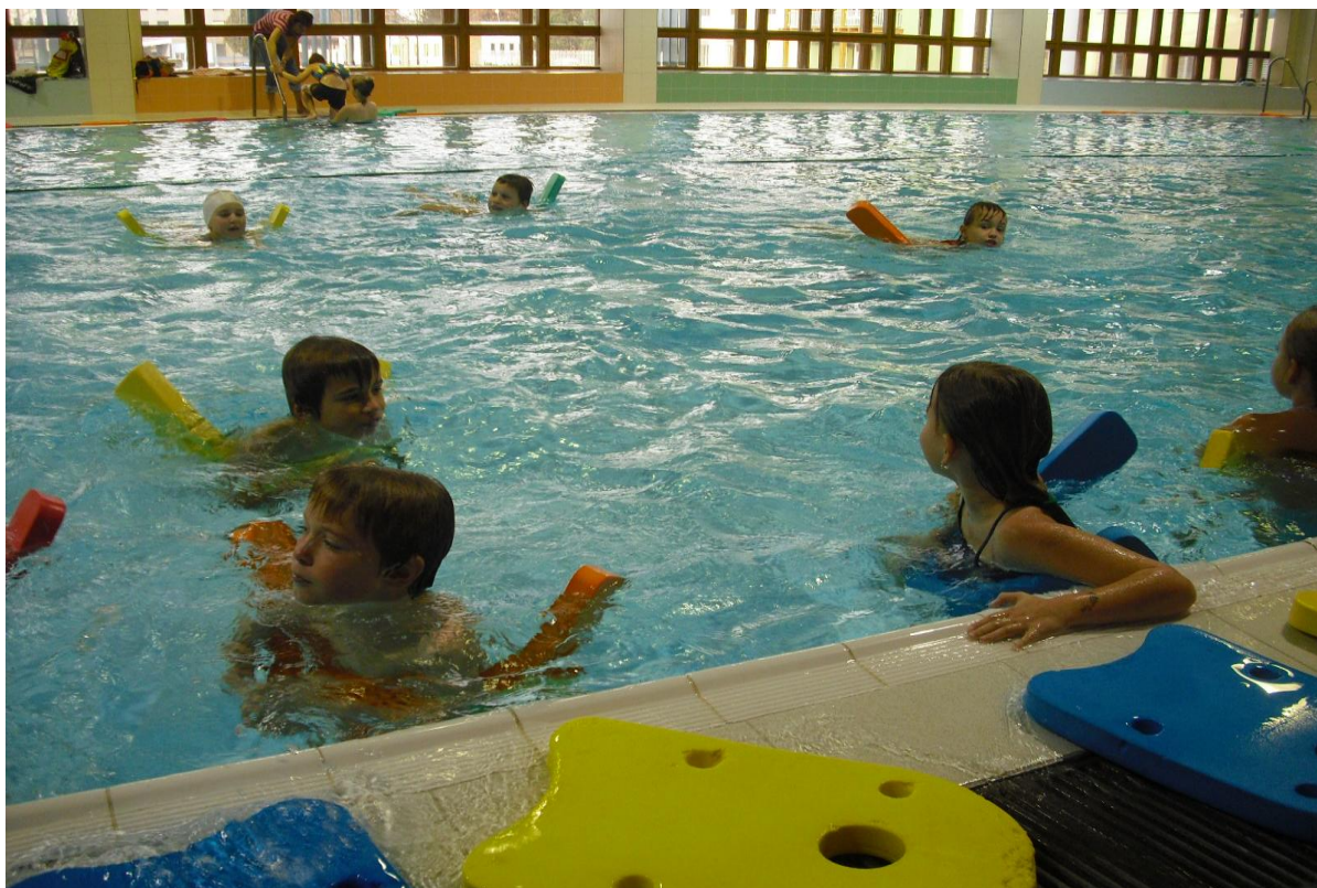
Plavecký výcvik v plaveckém bazénu ve Svitavách