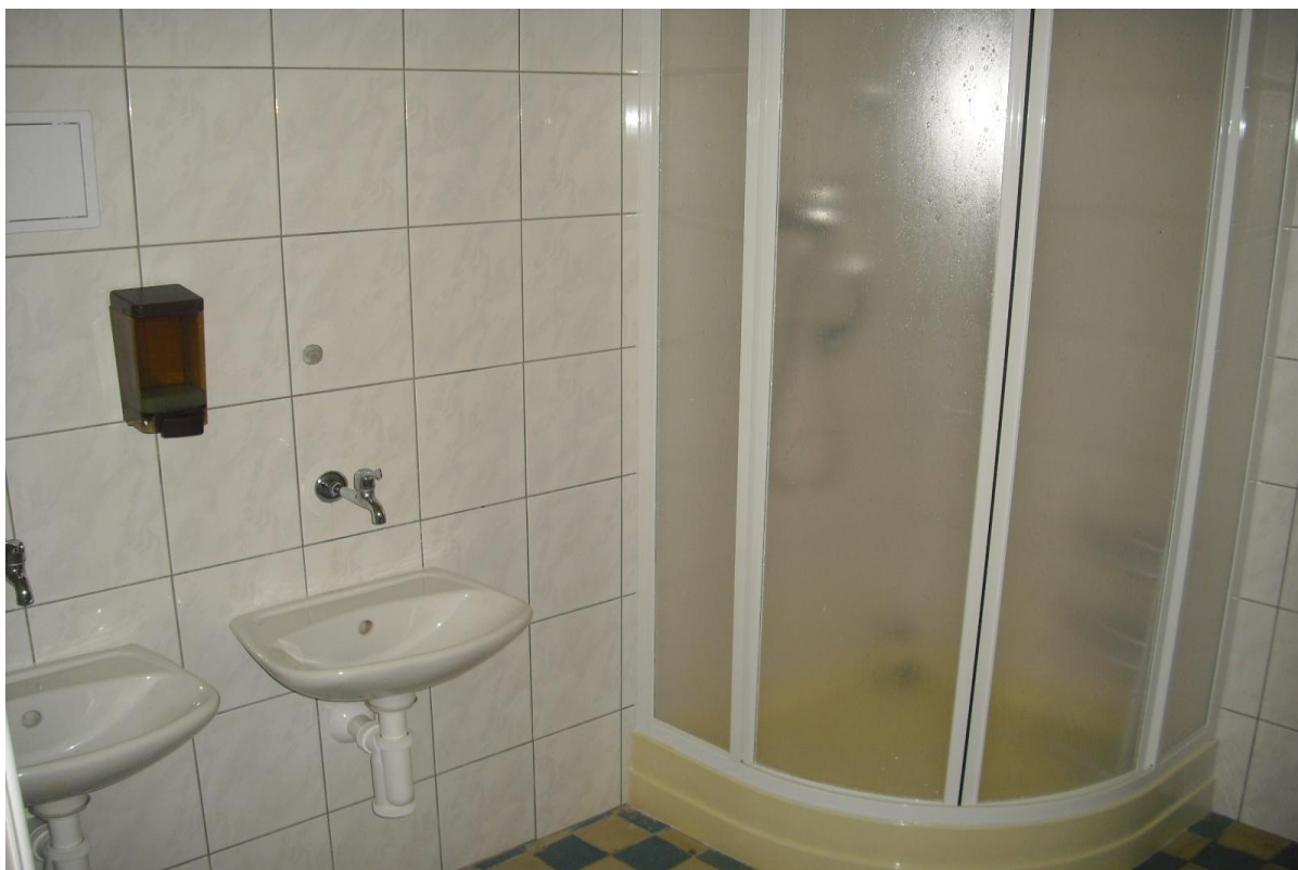
Sprchový kout v sociálním zařízení Berušek – po částečné rekonstrukci