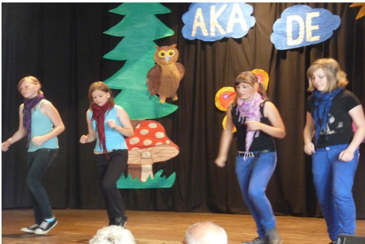
Školní akademie – taneční vystoupení žákyň 7. ročníku