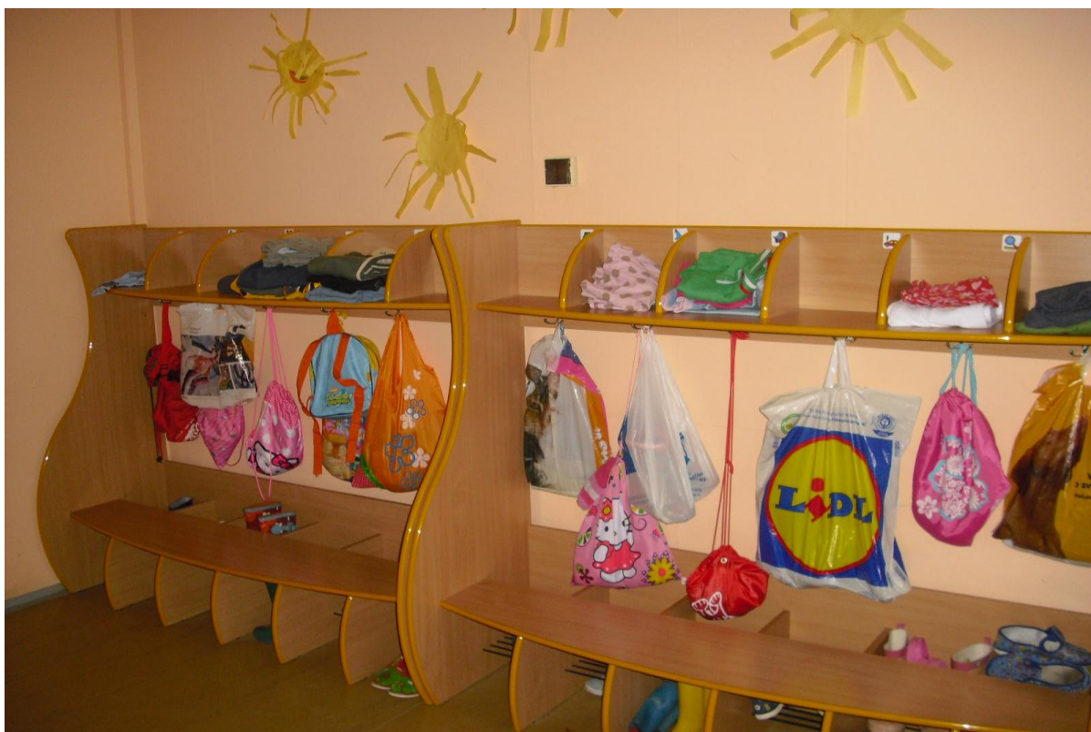
Dovybavení nové šatny