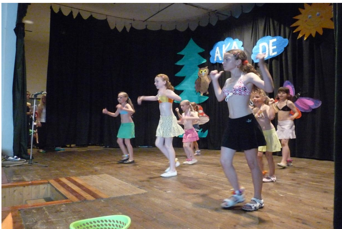
Školní akademie – taneční vystoupení žákyň 2. - 5. ročníku