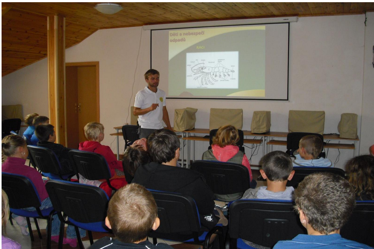
Projekce k programu v záchranné stanici Pasíčka – 1. stupeň