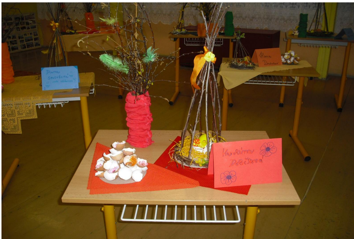
Velikonoční výstava – „Jarní louka“