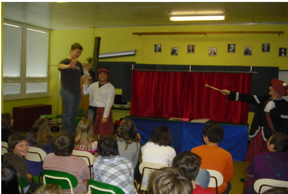
„Příběh Osvobozeného divadla“ – Divadélko Hradec Králové