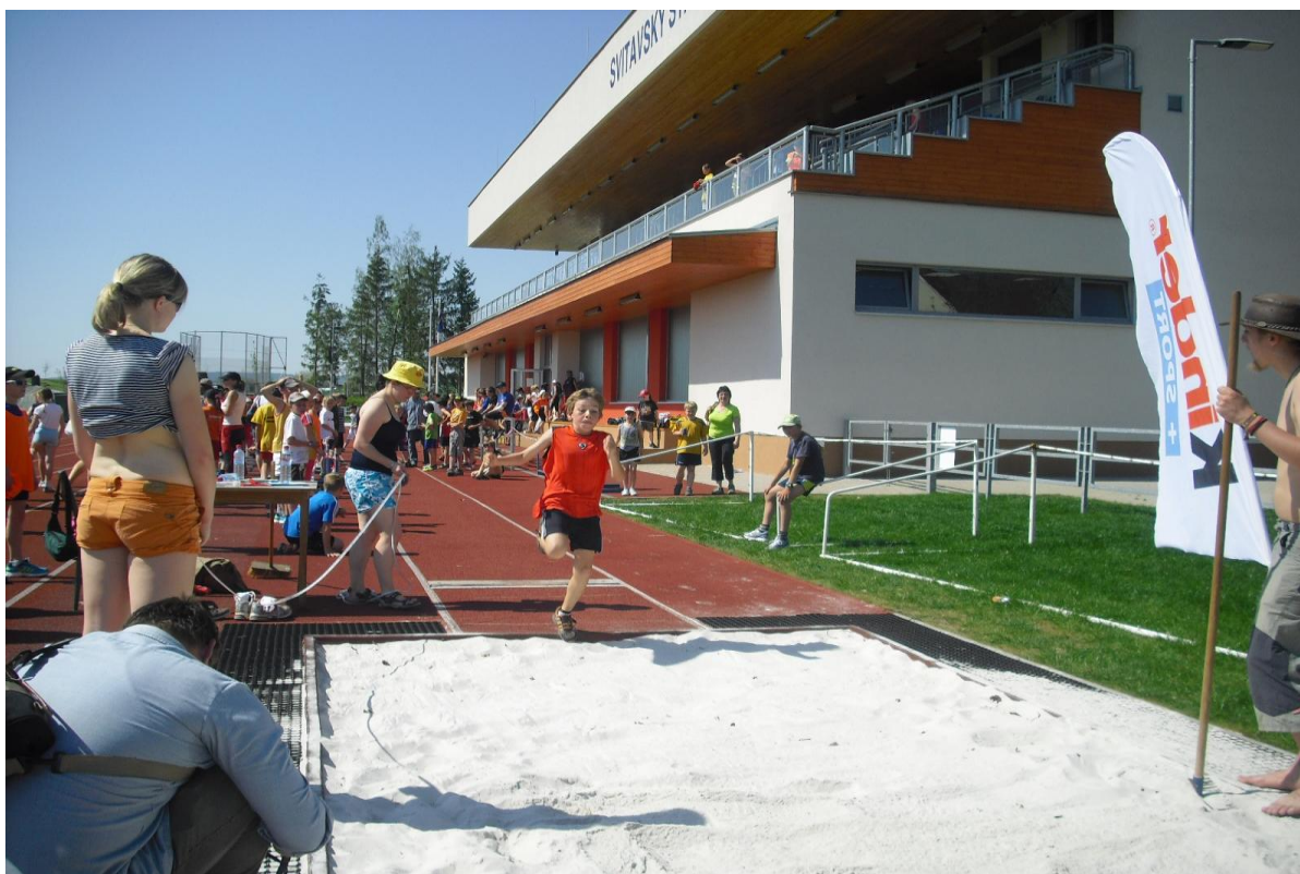
Kinderiáda - Svitavy