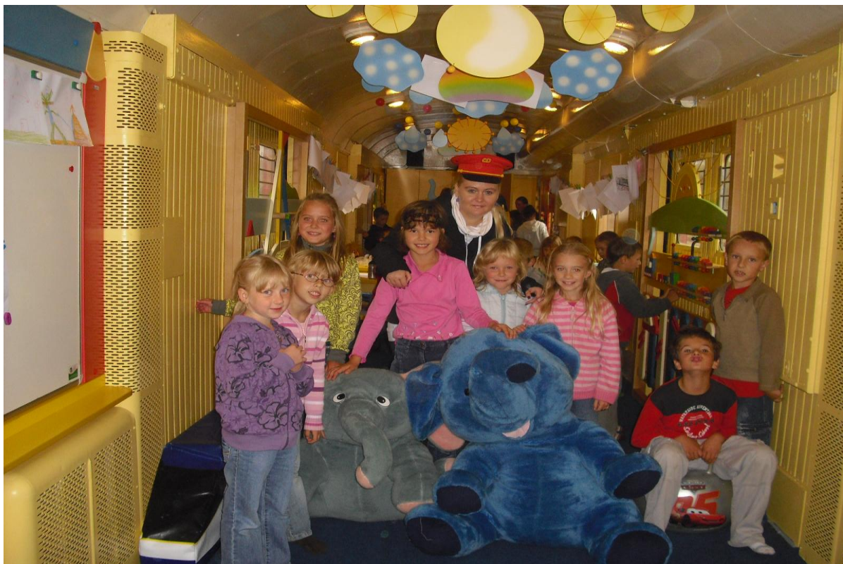
České dráhy dětem - Svitavy