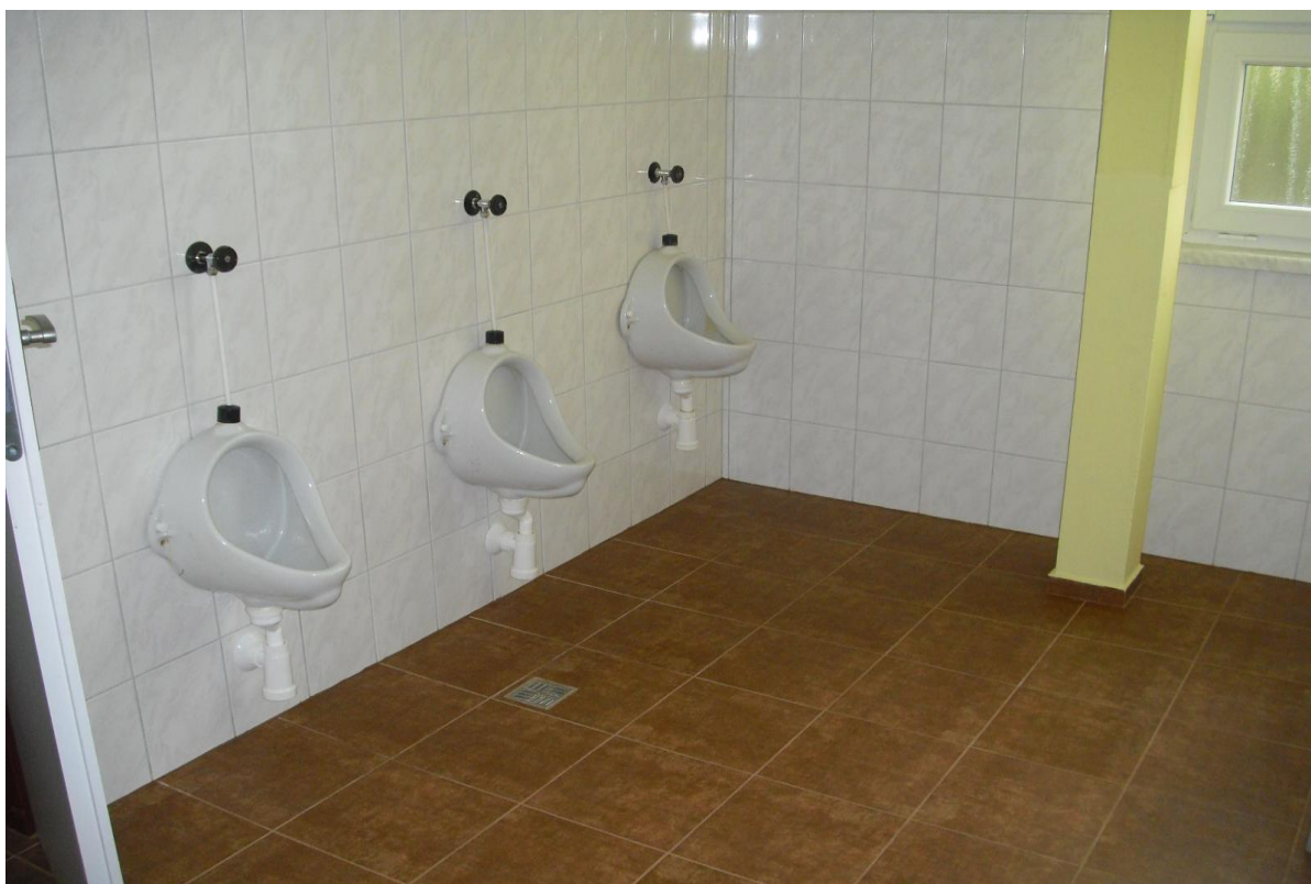
WC chlapců v přízemí barevné budovy po rekonstrukci