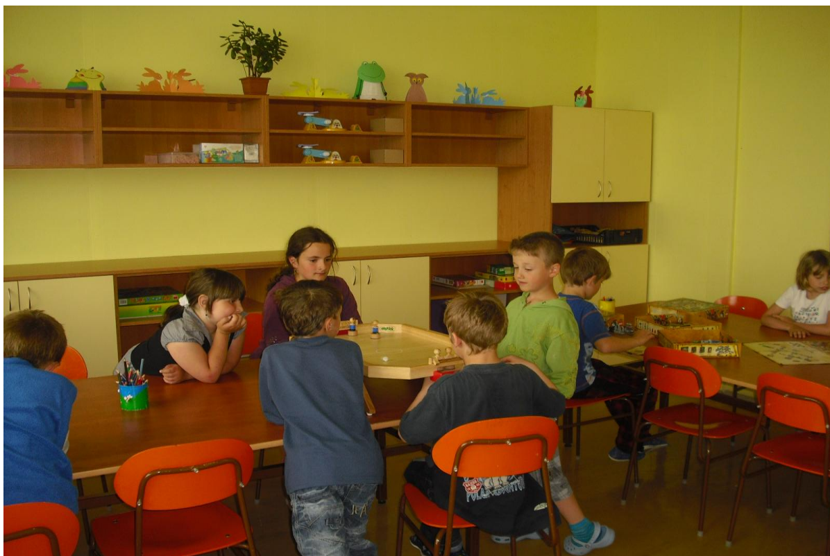
Nové vybavení školní družiny

V průběhu roku byl rozšířen stávající prostor školní družiny o jednu místnost. Zakoupili jsme nový nábytek, který umožní žákům vystavovat výrobky a zároveň slouží k ukládání materiálu. Byly zakoupeny hry, venkovní hry, stavebnice a velký stolní fotbal. K rozvíjení estetického cítění byla zakoupena silikonová razítka a razidla. K odpočinkové činnosti budou dětem sloužit odpočinkové vaky.