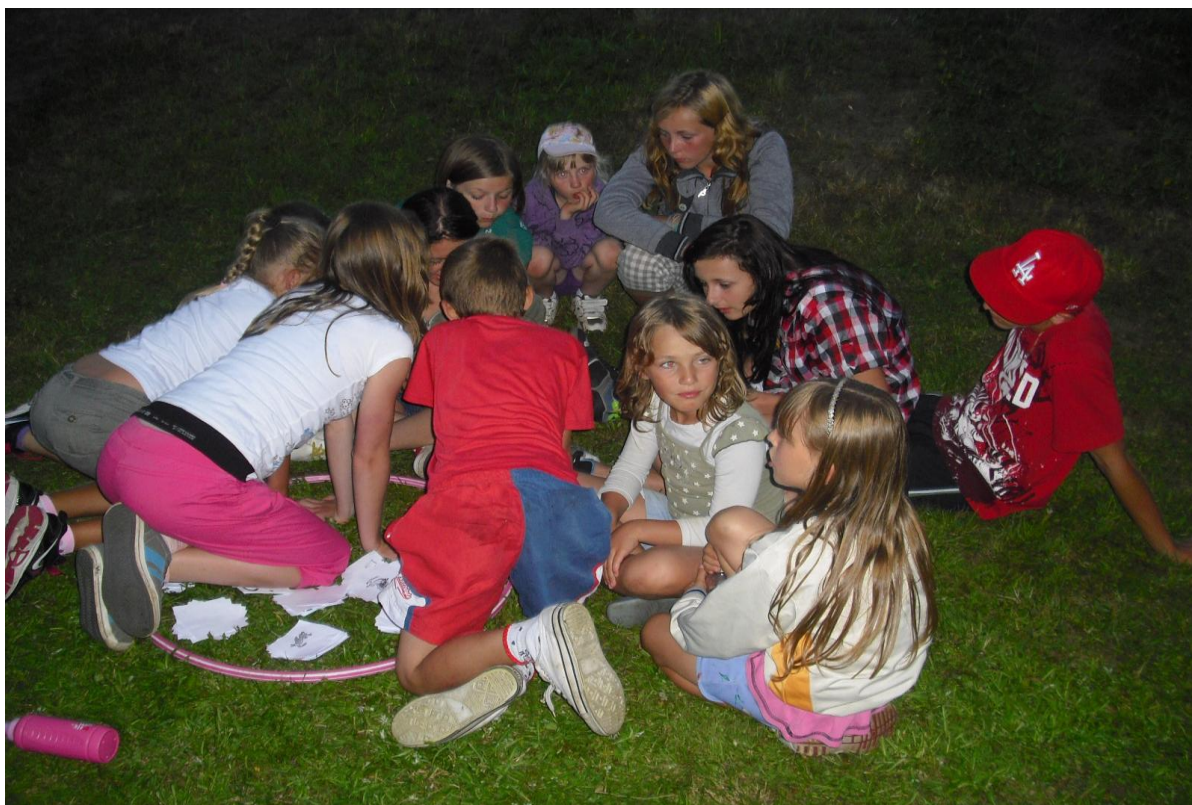
„Pohádky Tisíce a jedné noci“ – spolupráce, tvořivost, fantazie, zdravá soutěživost