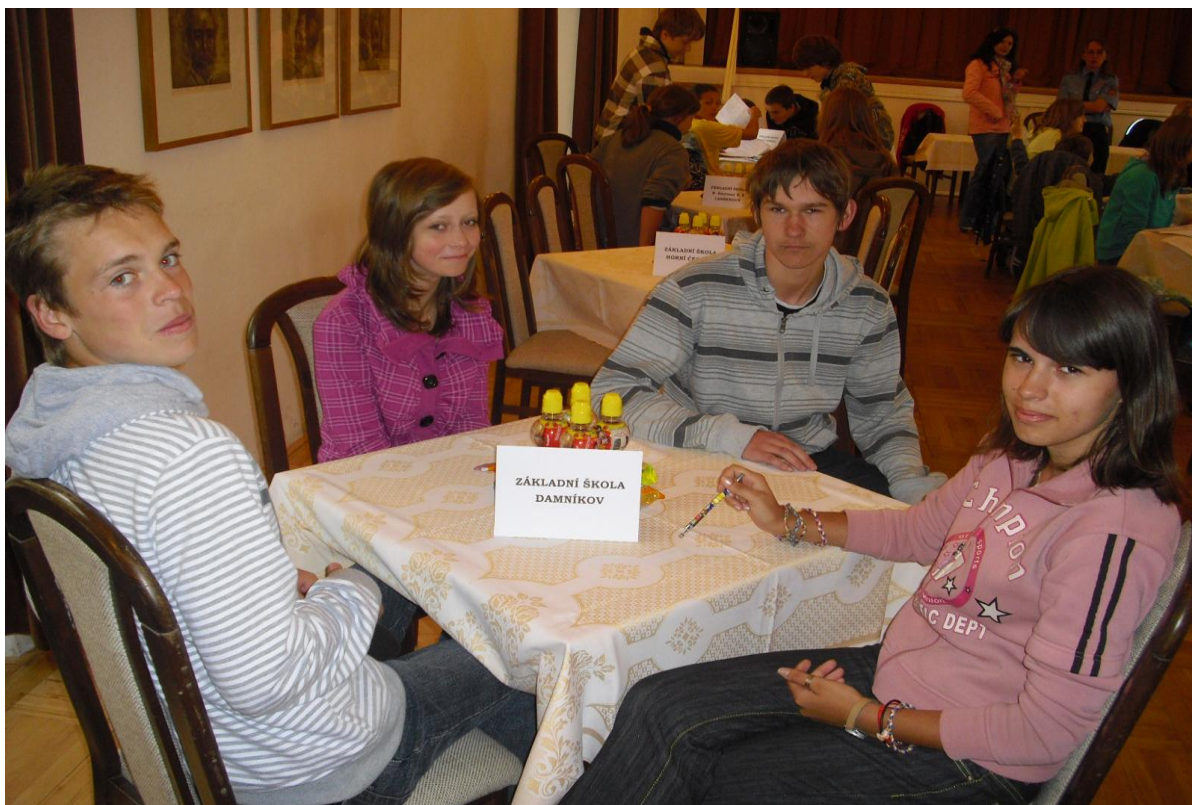
Právo pro každého – oblastní kolo