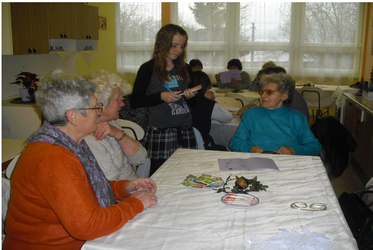
Vánoční výstava – „Romantické Vánoce“