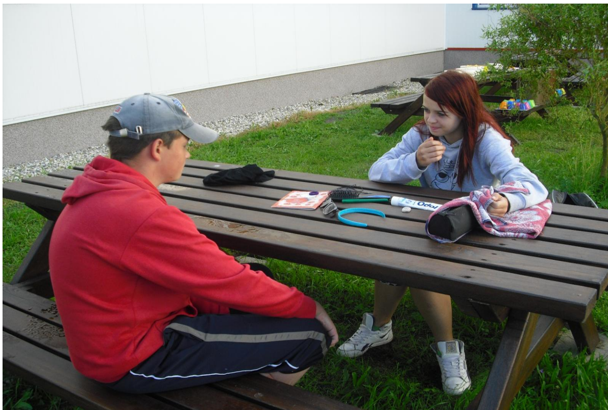
Využívání zahradních setů

Uspěli jsme s projektem „V zelené učebně, učí se nám příjemně“, který jsme získali od Lesů ČR. V rámci tohoto projektu jsme zakoupili 4 sety zahradních stolů s lavicemi, které žáci natřeli v rámci předmětu Svět práce. Lavice jsou umístěny na školní zahradě a jsou využívány k výchovně – vzdělávací činnosti.