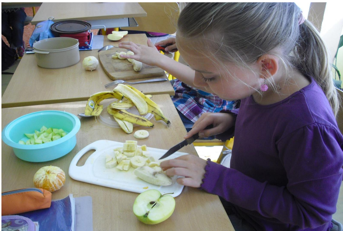
Hodina anglického jazyka - ovoce