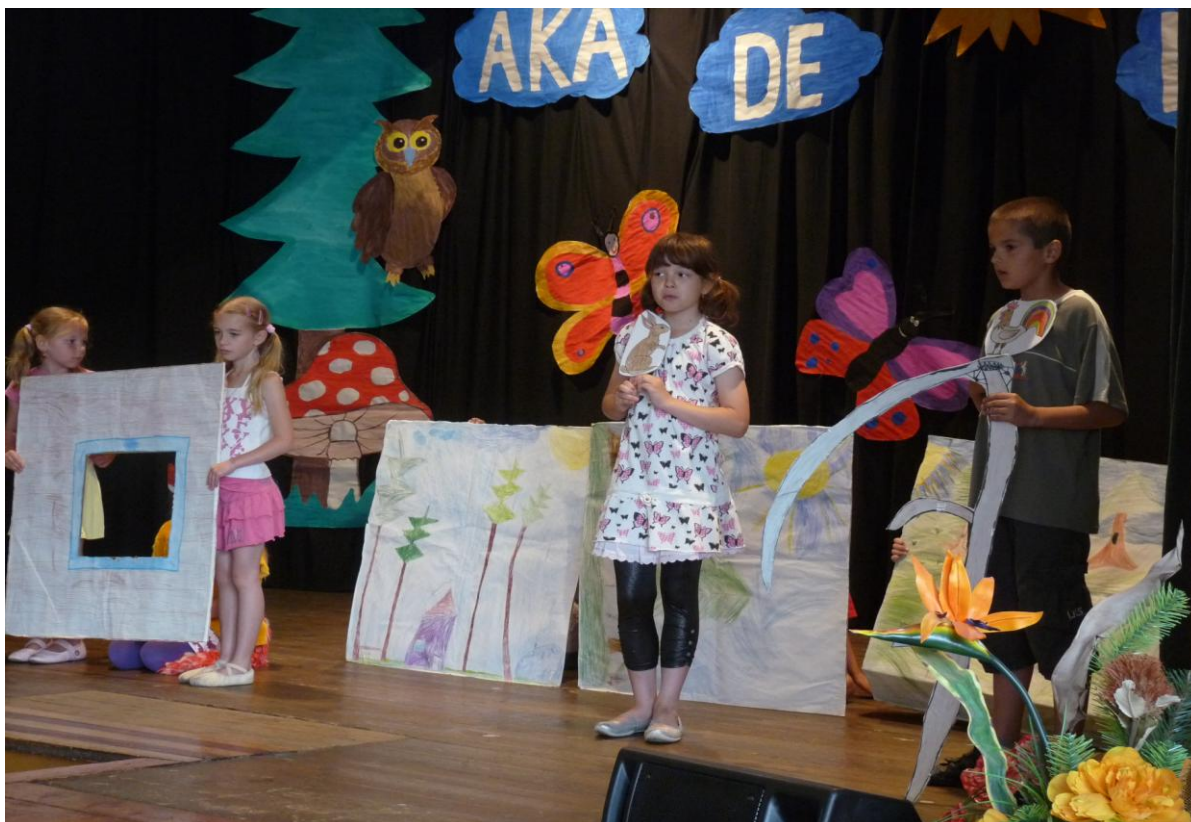
Školní akademie – divadelní vystoupení žáků 2. a 3. ročníku