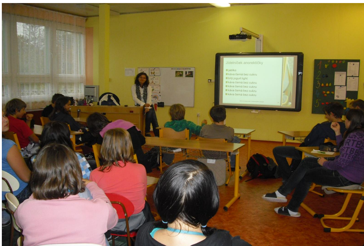
„Hravě a zdravě“ – projekt ve spolupráci s nadačním fondem Albert