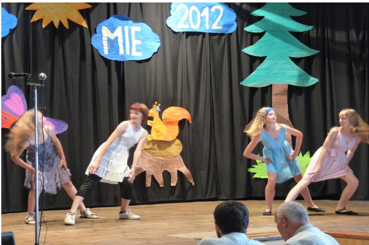
Školní akademie – taneční vystoupení žákyň 6. ročníku