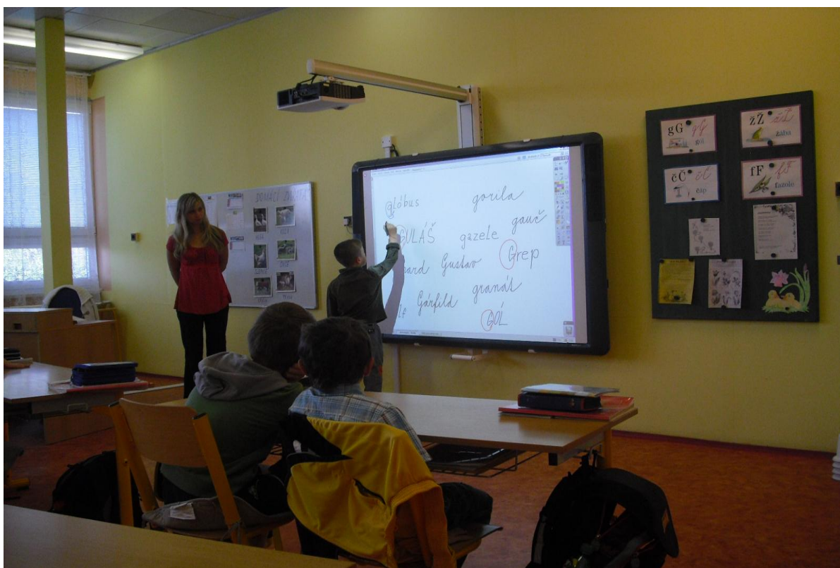
Využití nové interaktivní tabule v hodině českého jazyka