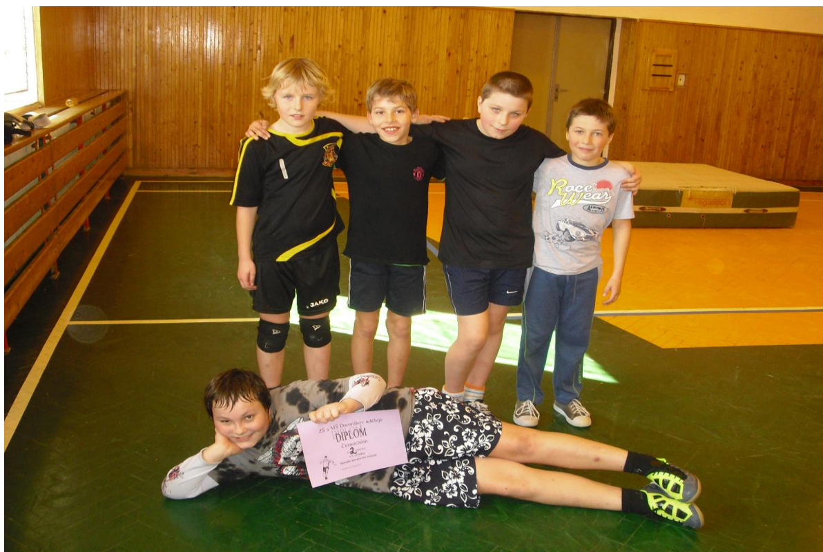
O „Pohár ředitelky školy“ ve futsalu