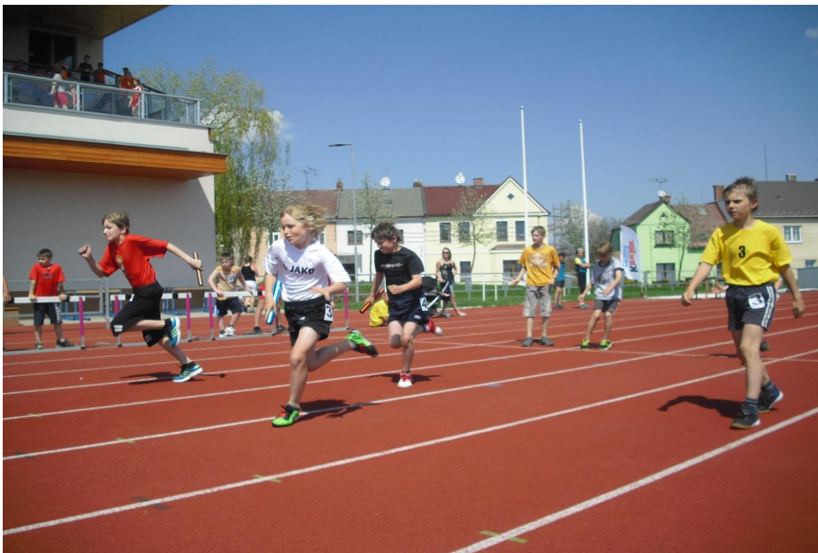
Štafetový běh – Kinderiáda ve Svitavách