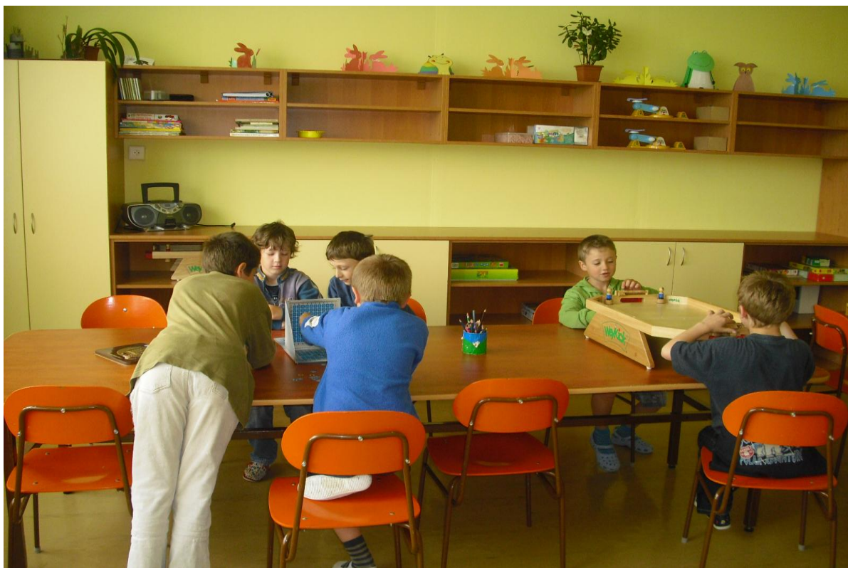
Pohled na novou hernu školní družiny