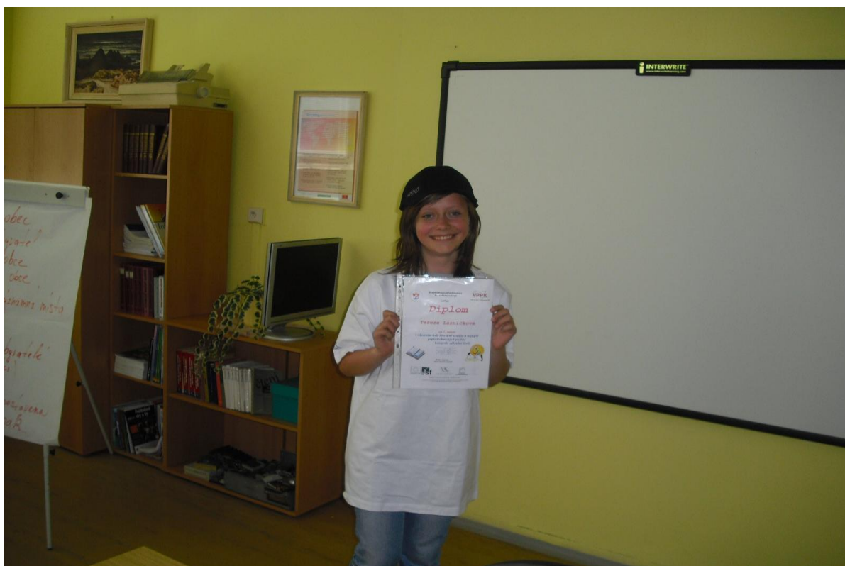
Ocenění z Krajské hospodářské komory za 1. místo v okresním kole literární soutěže