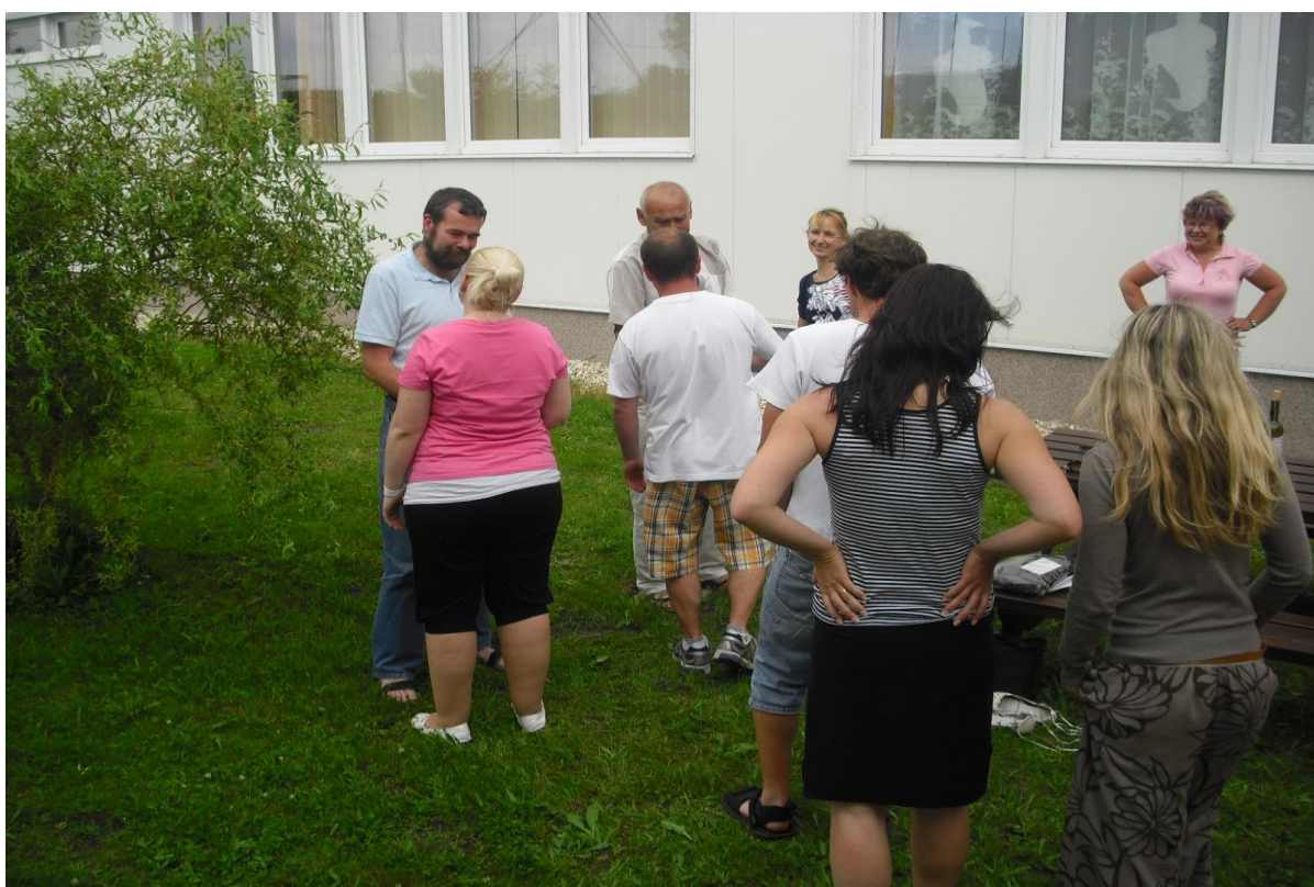
Rozloučení s kolegy – odchod do důchodu, odchod na nové pracoviště