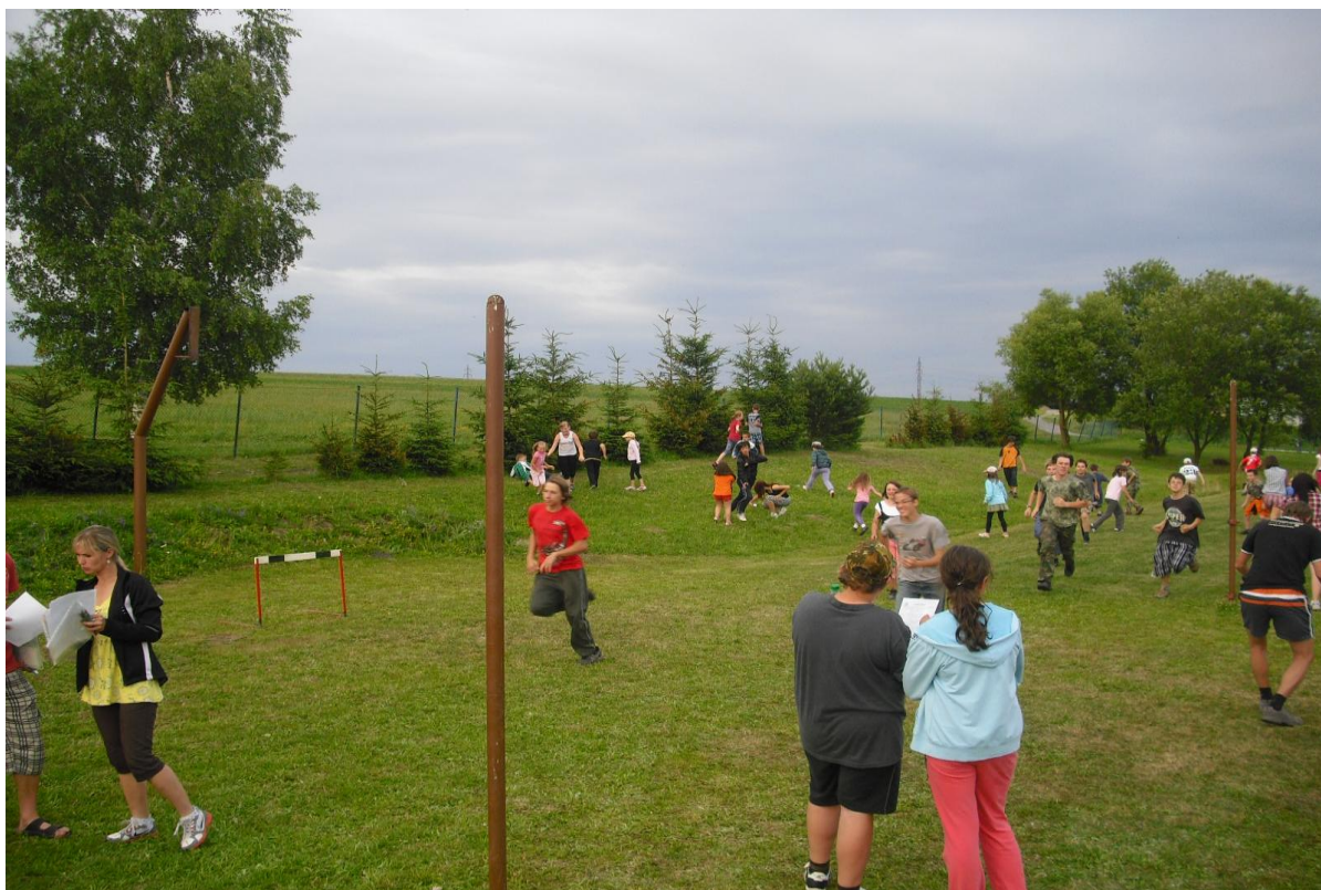
„Pohádky Tisíce a jedné noci“ – spolupráce, tvořivost, fantazie, zdravá soutěživost