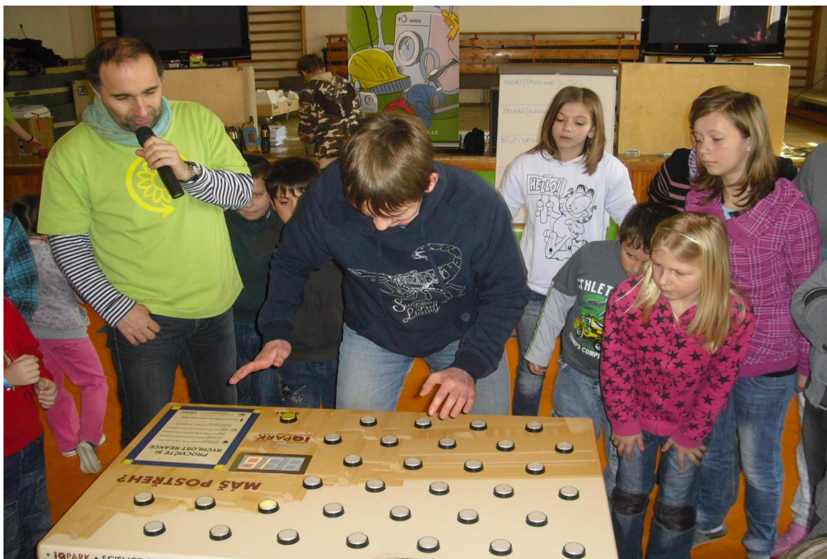
„Recyklační hlídka“ – naučně zábavný program společnosti Elektrowin