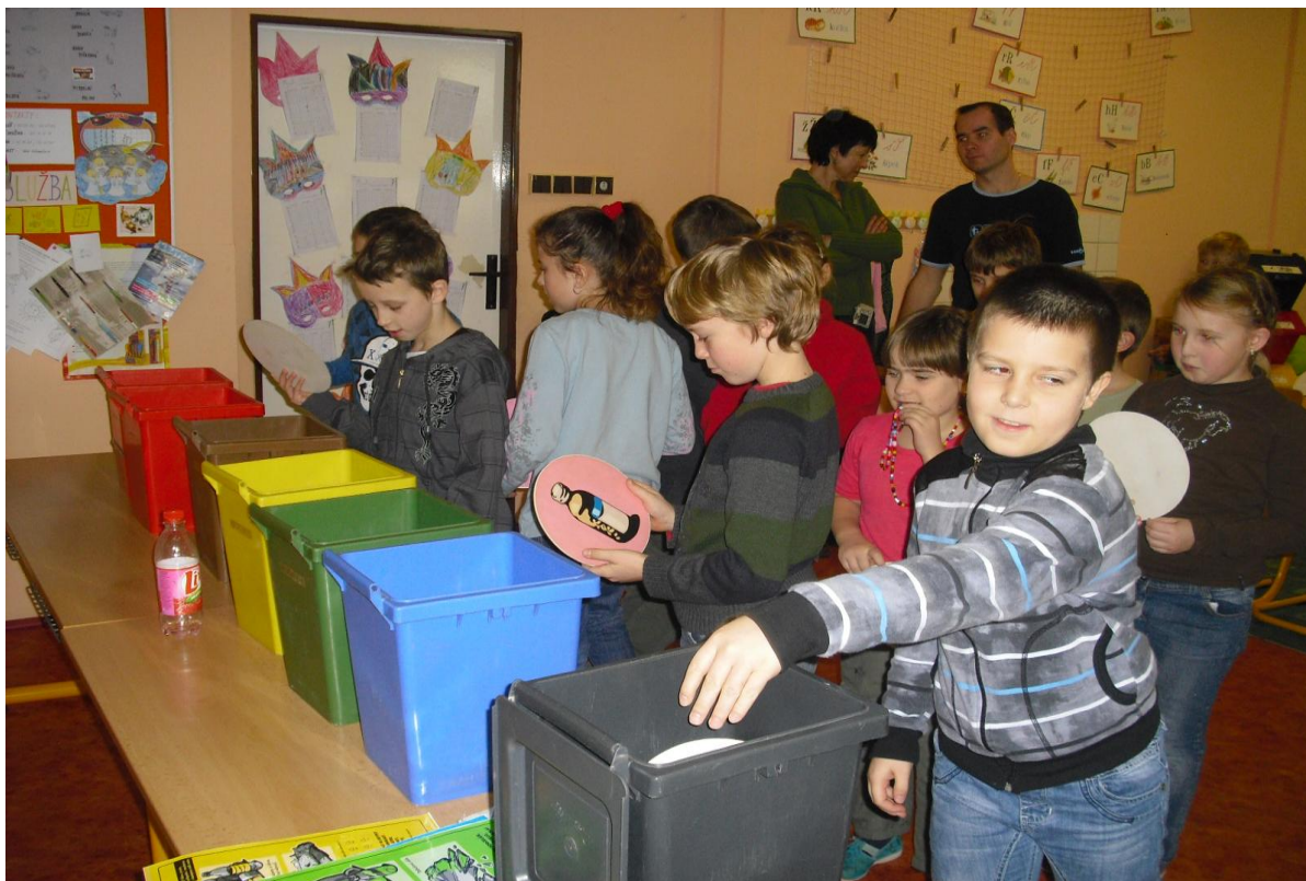
Účast okolních škol na výchovně-vzdělávacím programu „Tonda Obal na cestách“