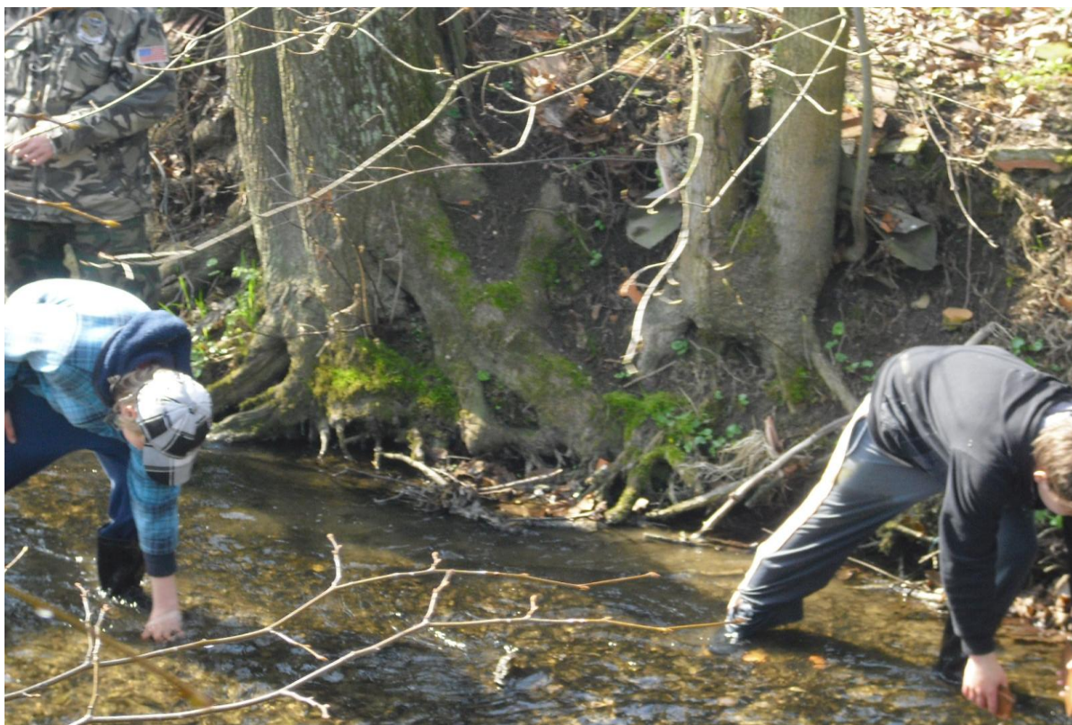
Den Země – 2. stupeň