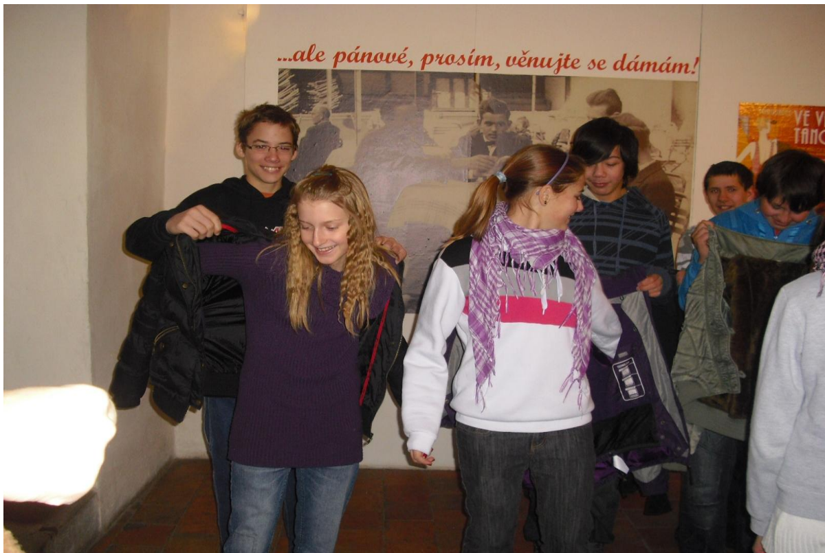
„Ve víru tance“ – výukový program zaměřený na společenské chování