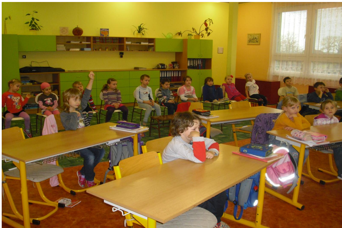
Návštěva předškoláků v 1. třídě