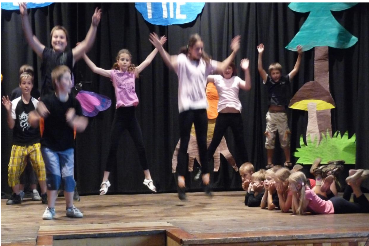
Školní akademie – taneční vystoupení žáků 2. a 5. ročníku