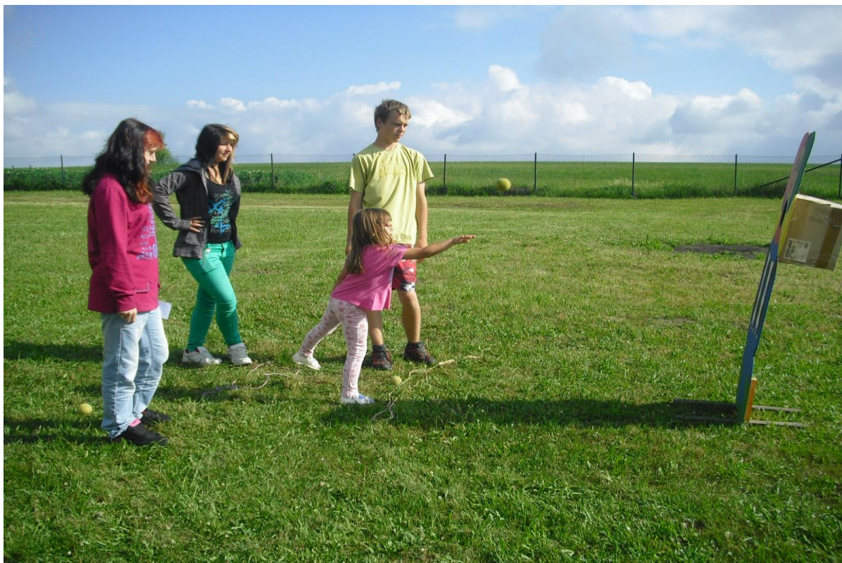
Nejstarší společně s nejmladšími – Dětský den