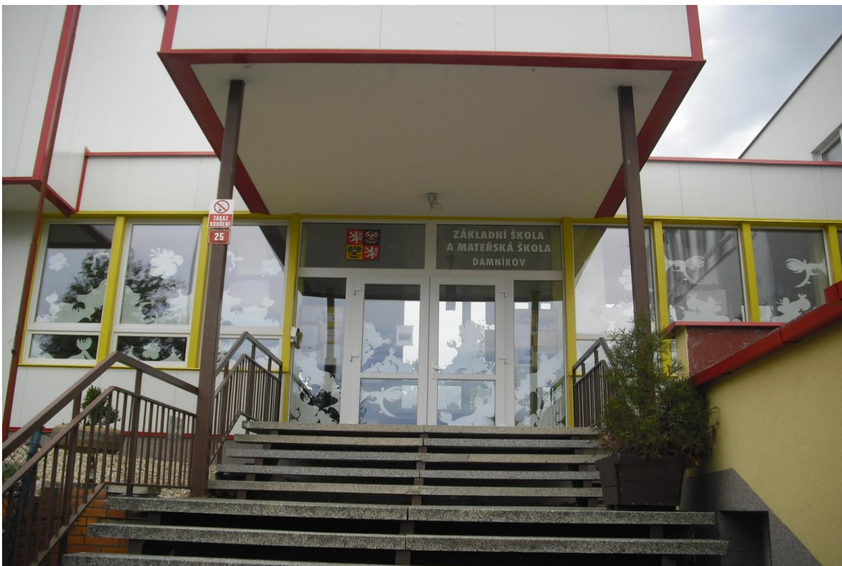
Vstup do školy hlavním vchodem