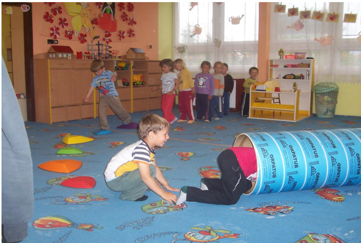
Využití říčních kamenů