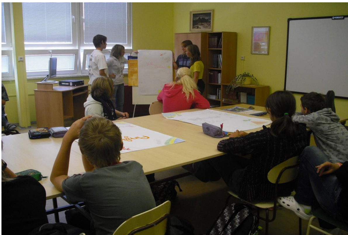
Práce žáků z vyučovací hodiny finanční matematika

V rámci Operačního programu Vzdělávání pro konkurenceschopnost v oblasti podpory Zlepšení podmínek pro vzdělávání na základních školách jsme vybavili první třídu interaktivní tabulí s dataprojektorem, učebnu výpočetní techniky novými počítači, novým softwarem ke stávající interaktivní tabuli a hlasovacím zařízením. Tento projekt bude ve škole probíhat do konce července 2013. Škola v rámci projektu získá v následujícím období 2 nové interaktivní tabule a 1 dataprojektor.