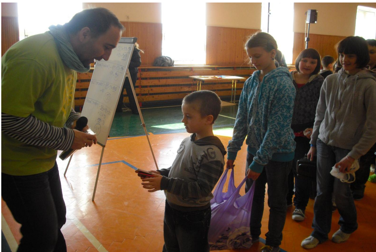
Předávání vysloužilých elektrospotřebičů v rámci programu Recyklační hlídka