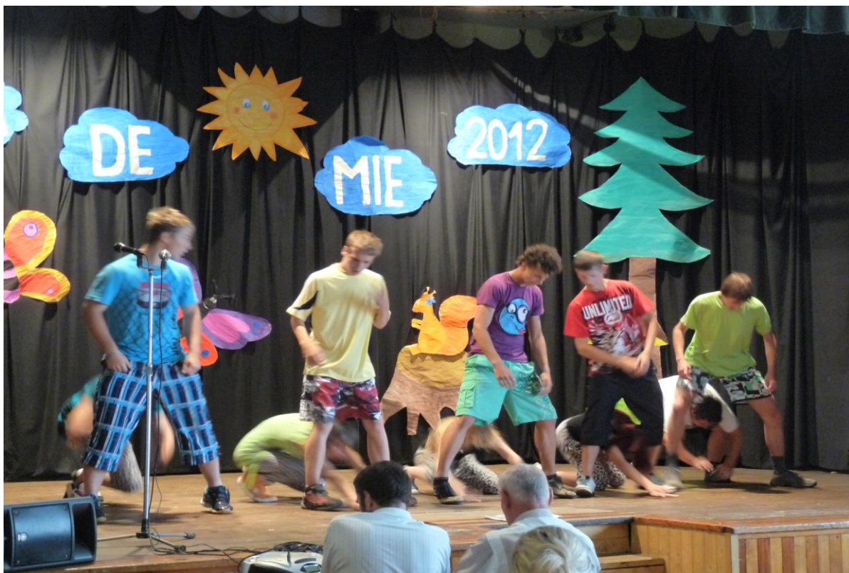
Školní akademie – závěrečný tanec 9. ročníku