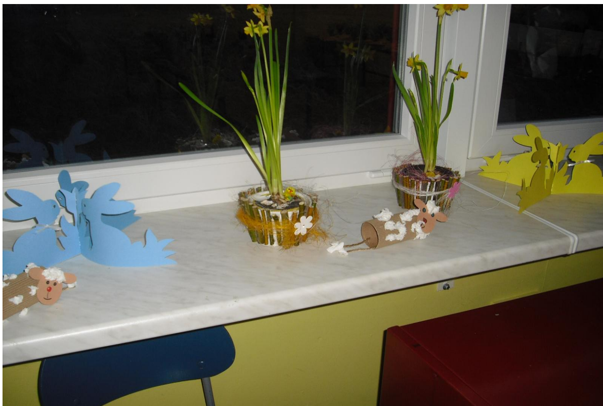
Výstava výrobků školní družiny na velikonoční výstavě