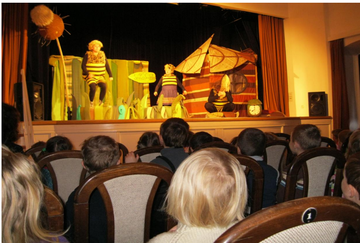
Příběhy včelích medvídků – divadelní představení Lanškroun