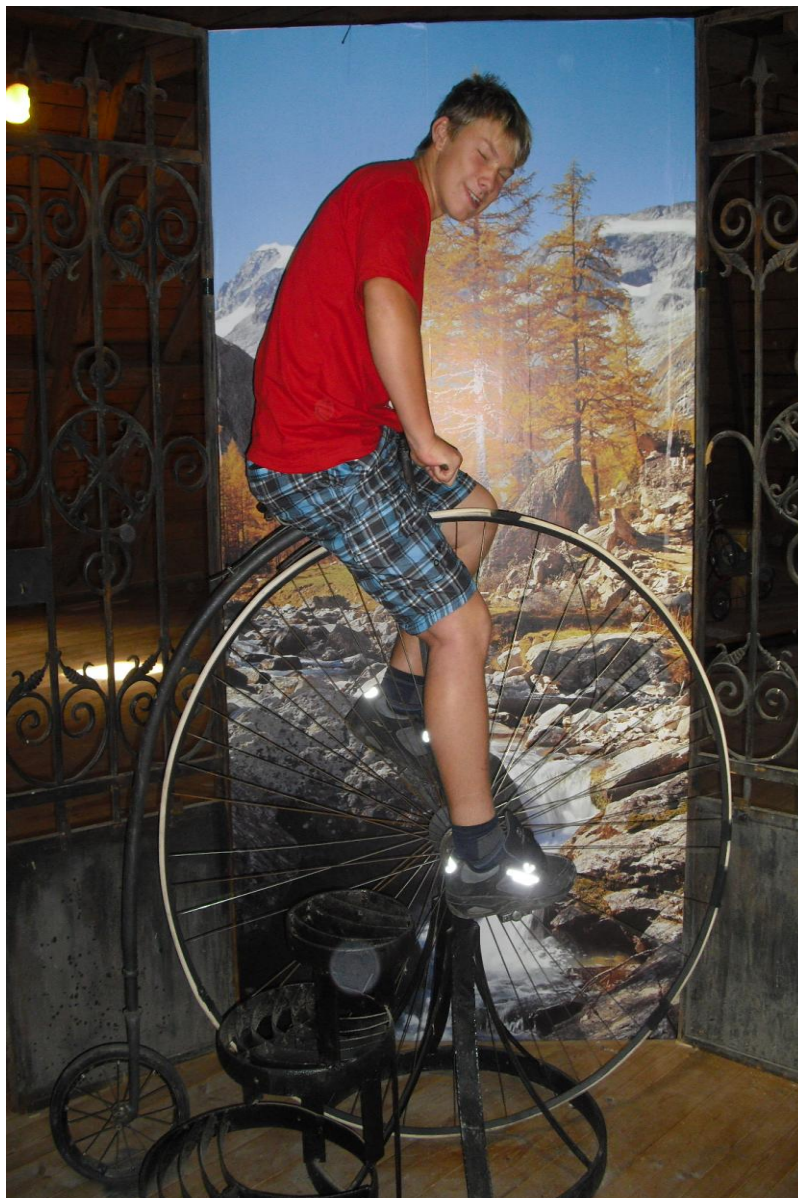
Prohlídka Muzea kol v Nových Hradech