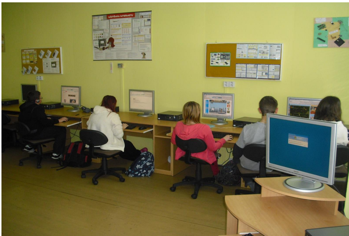
Hodina aplikačních technologií