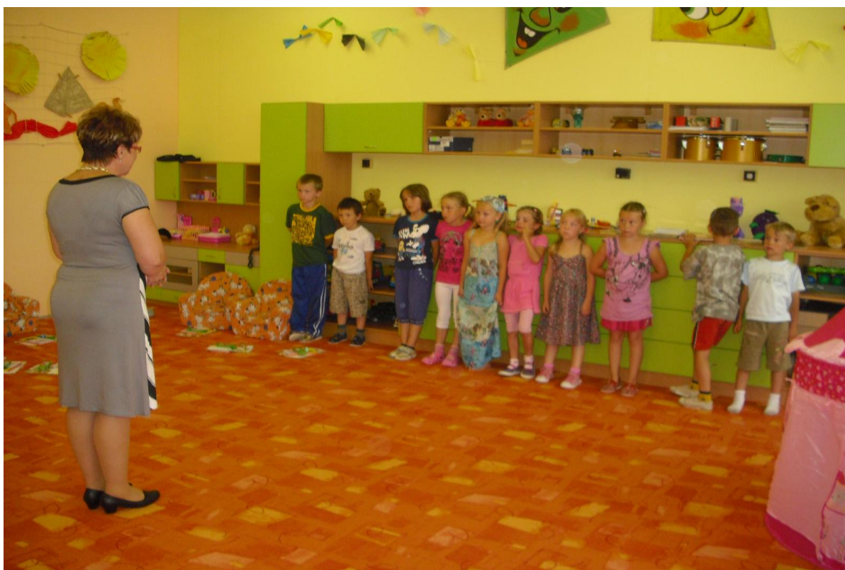
Nahlédnutí do běžného života mateřské školy