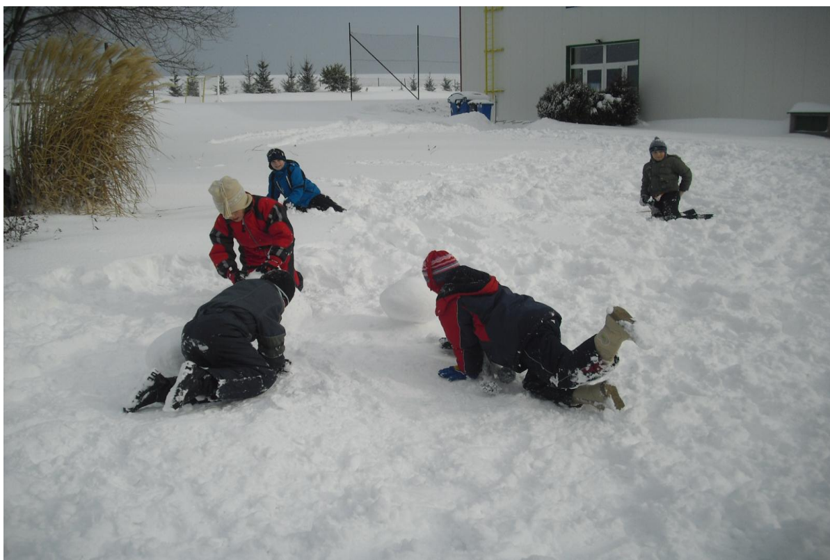
„Když jsou u nás cesty zavátý“ – spolupráce při pohybových činnostech na sněhu