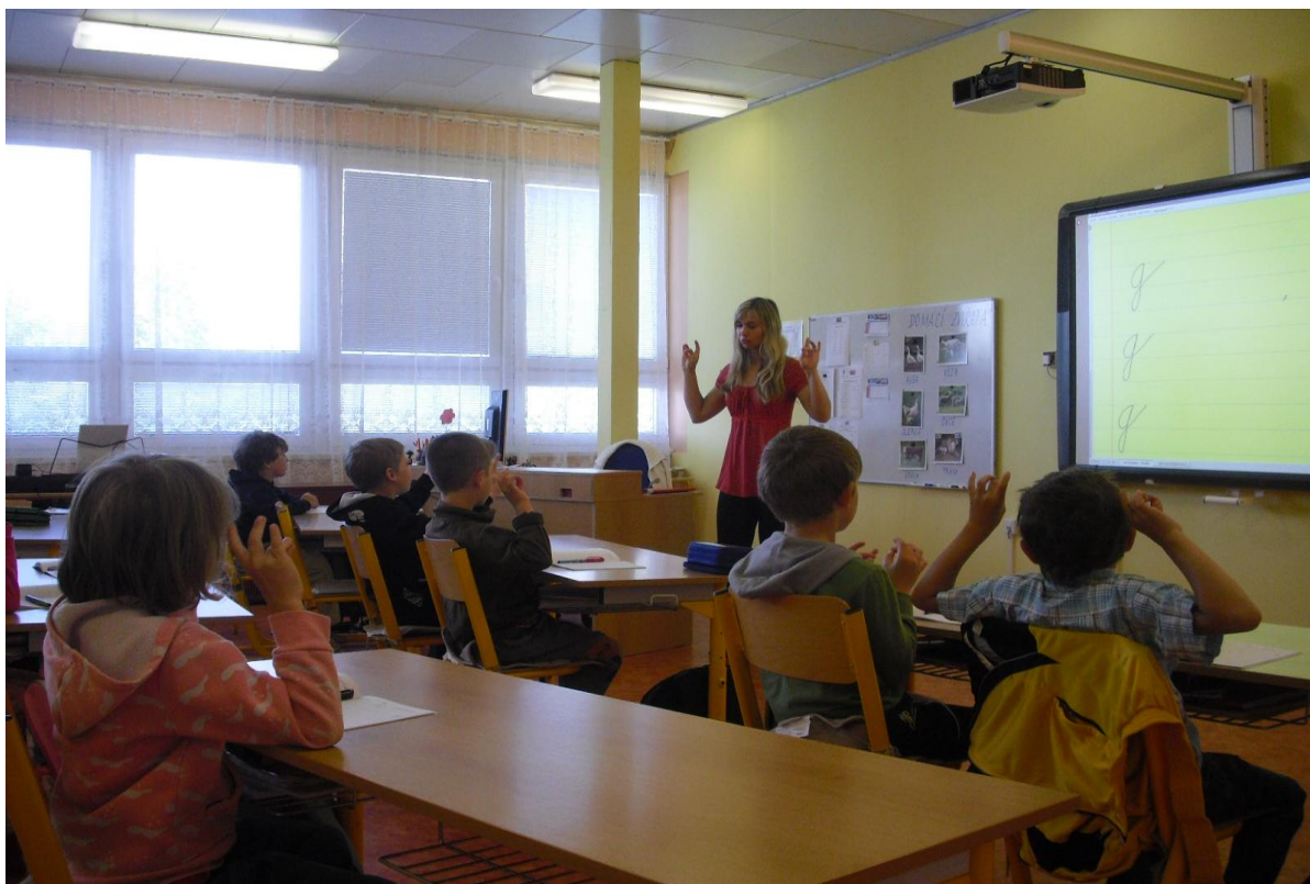
Hodina českého jazyka 1. ročníku – rozevření prstíků před psaním