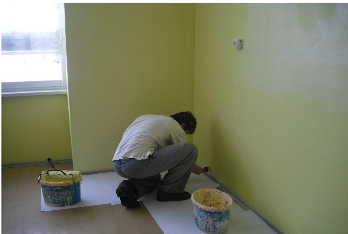
Budování nové herny školní družiny