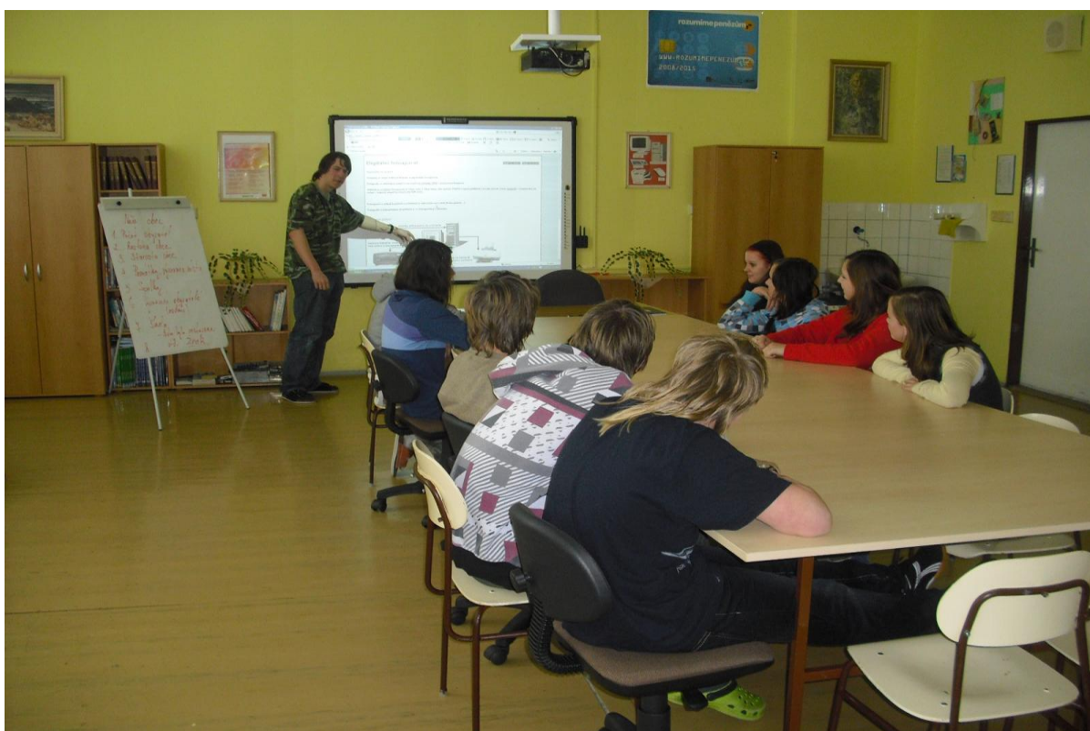
Hodina aplikačních technologií