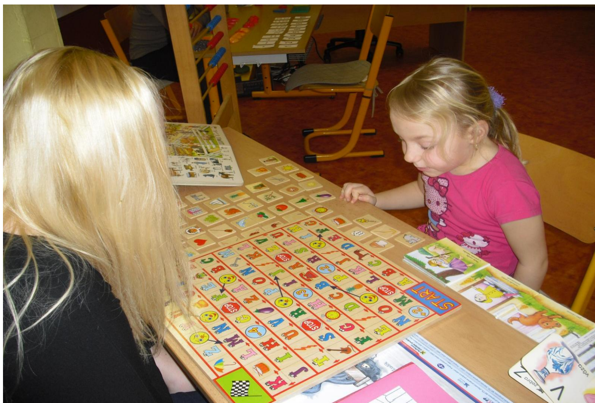
Tradiční zápis dětí do 1. ročníku základní školy

Proběhl v prostorách první třídy. Každé dítě obdrželo kartičku, na kterou dostávalo razítka za úspěšné splnění úkolů při své okružní cestě. Výsledek snažení dětí byl nalepen do knížky, kterou pro ně připravila děvčata 9. ročníku. Na závěr si děti vybraly upomínkový dárek, vyrobený žáky 9. ročníku a dětmi ze školní družiny. Celkem se k zápisu dostavilo 16 dětí. Všechny děti byly přijaty do 1. ročníku. Rodiče dvou děvčat podali žádost o přestup a jeden žák bude vykonávat školní docházku v zahraničí s právem vykonání zkoušky z českého jazyka a literatury ve spádové škole. Na konci školního roku byly podány 3 přihlášky od rodičů dětí z Lukové. Do 1. třídy nastoupilo 17 prvňáčků, jeden však bude docházku plnit v zahraničí.