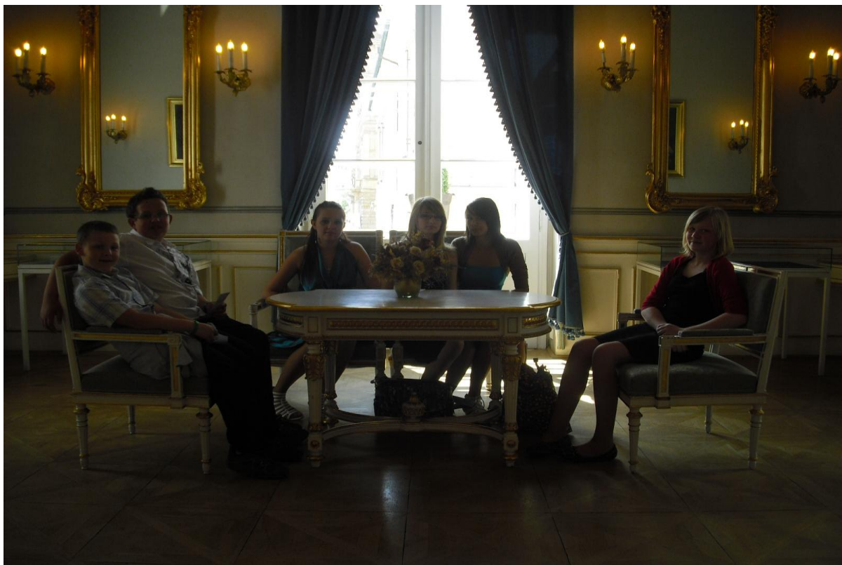
„Deváté srdce“ – představení ve Stavovském divadle