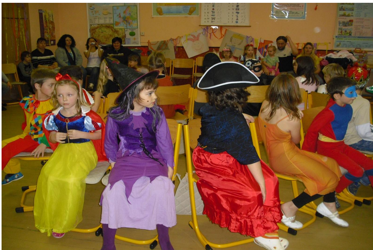
Zájem rodičů o karnevaly, pořádané žáky 1. stupně