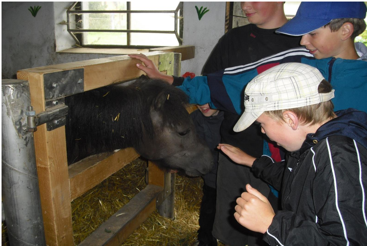
Poznávací výlet – Okolo našeho domova – Na statku