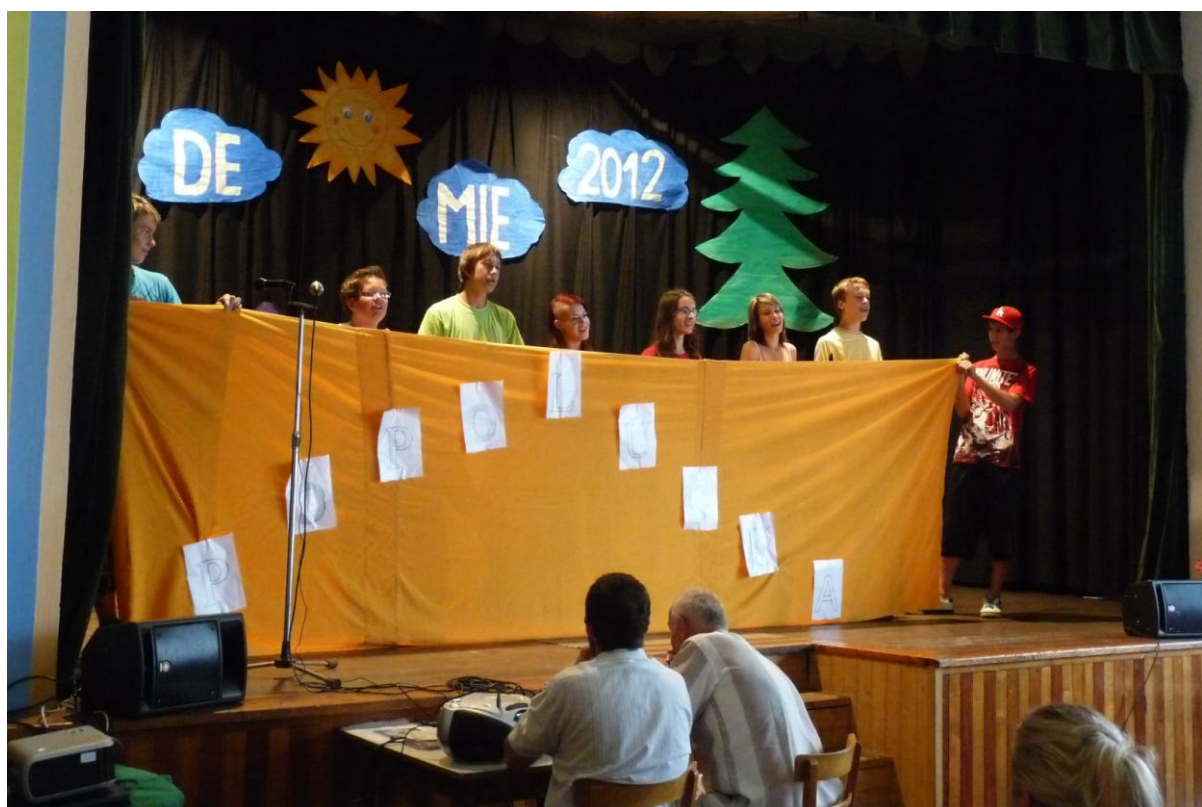
Školní akademie – dramatizace pohádky v režii žáků 9. ročníku