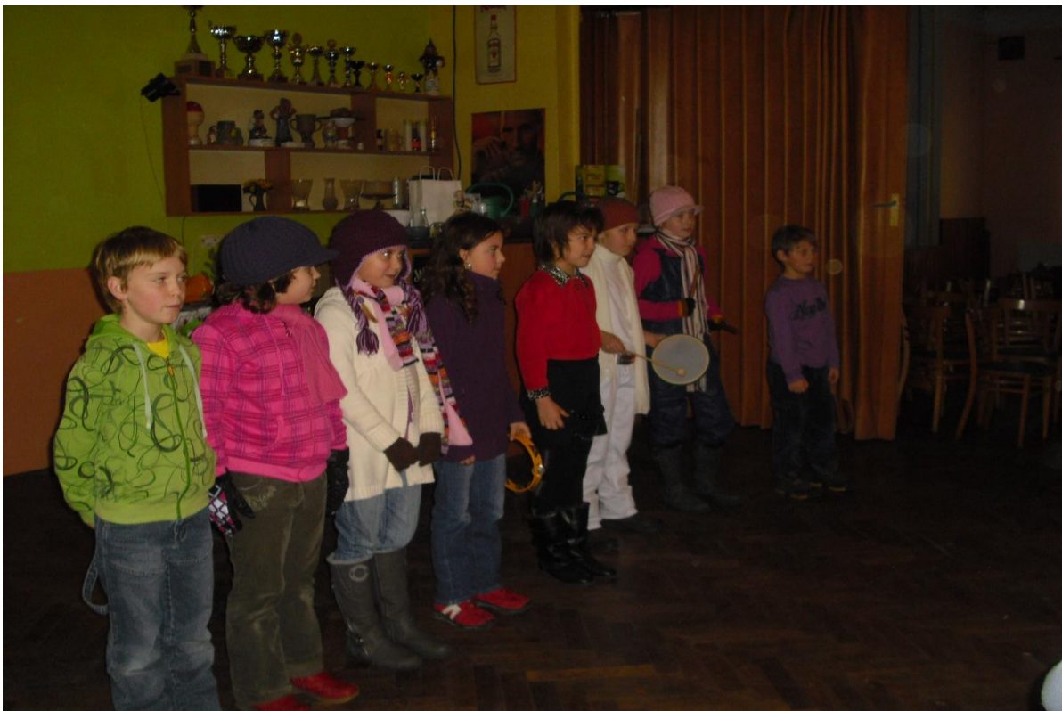
Vystoupení žáků na vánočním posezení důchodců