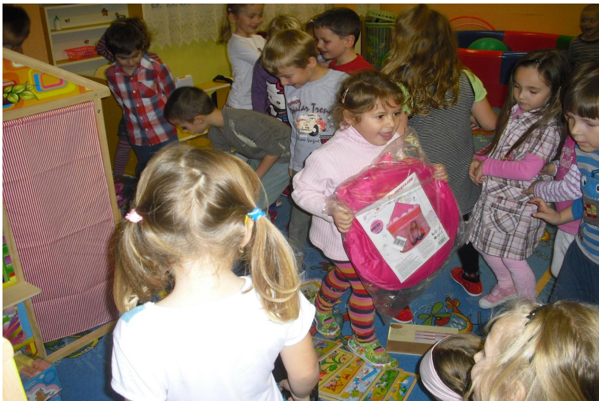
Pohled na vánoční nadílku