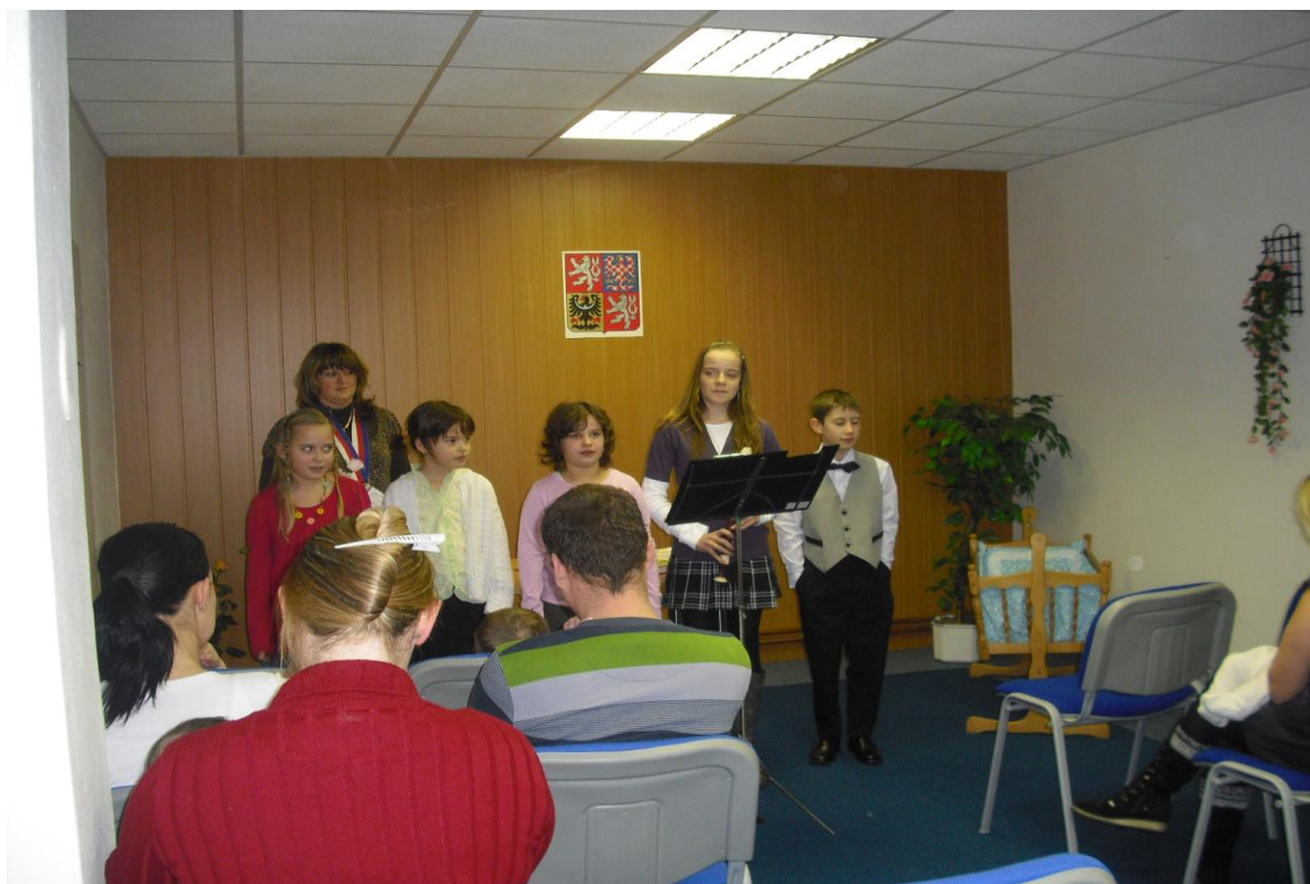
Vítání nových občánků Damníkova – žáci 1. stupně