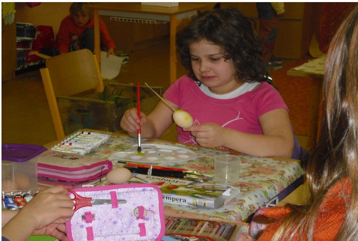
„Jarní hrátky“ – příprava výrobků na velikonoční výstavu