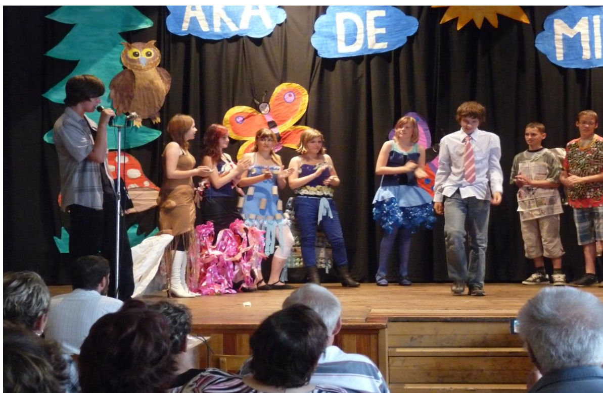
Školní akademie – Recyklační módní přehlídka žáků 7. ročníku