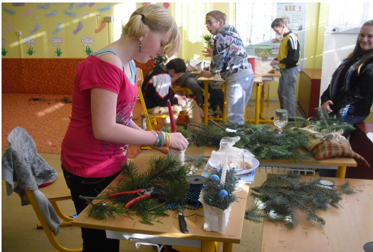
Tvoříme z odpadu – výrobky k vánočnímu prodeji