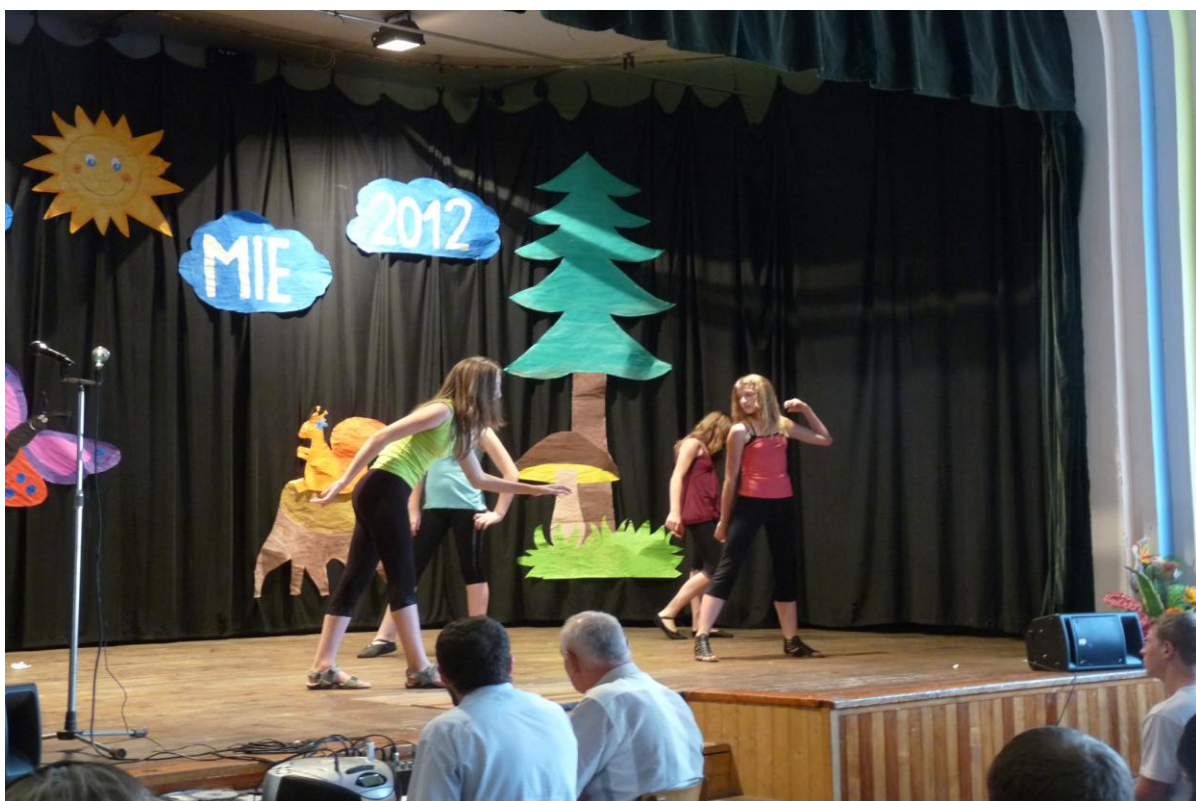
Školní akademie – taneční vystoupení žákyně 6. a 7. ročníku