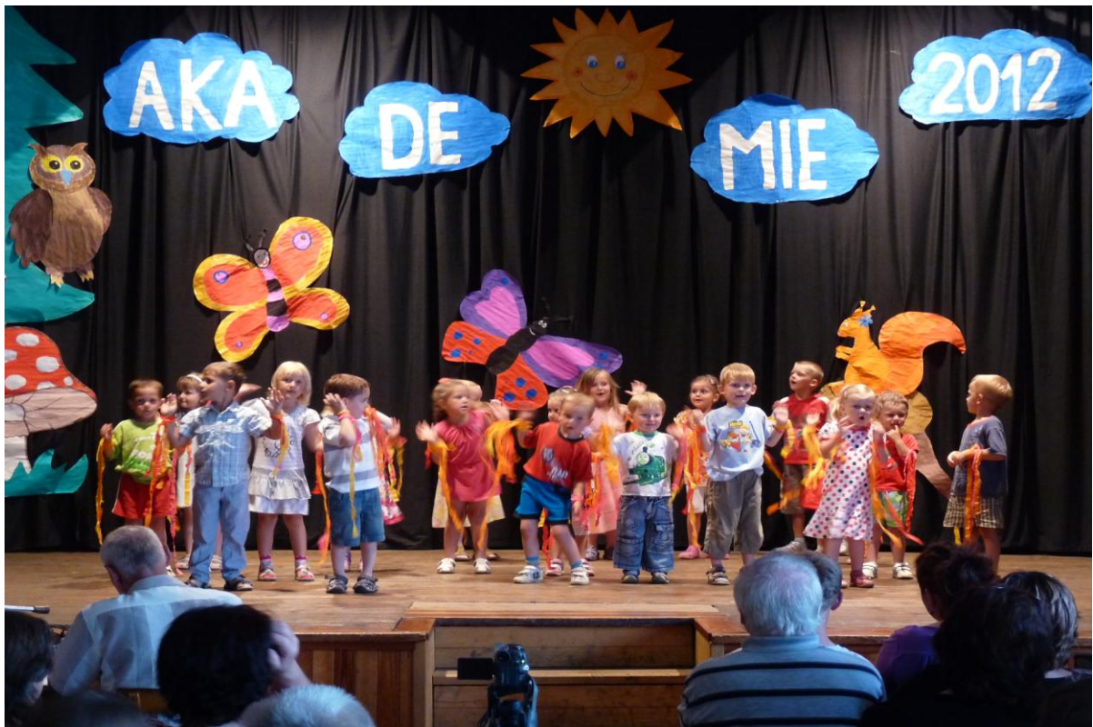
Školní akademie – vystoupení Berušek a Sluníček