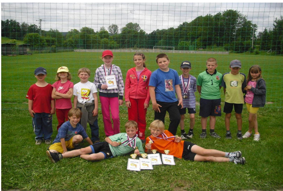
Radost z vítězství – atletické přebory v Rudolticích