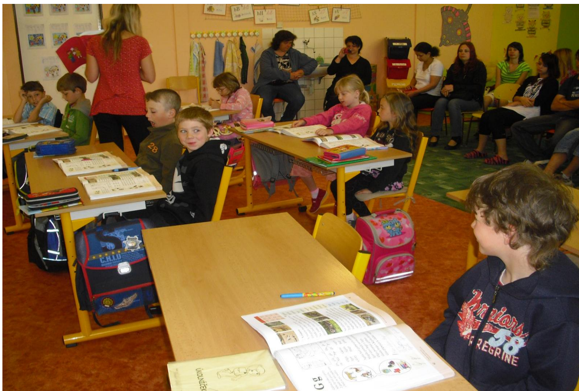
„Chci vám říci básničku“ – představení prvních úspěchů