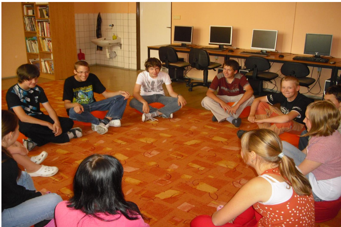
Nové informační centrum