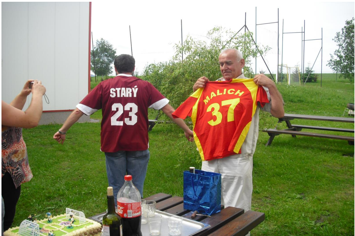
Rozloučení s kolegy – odchod do důchodu, odchod na nové pracoviště