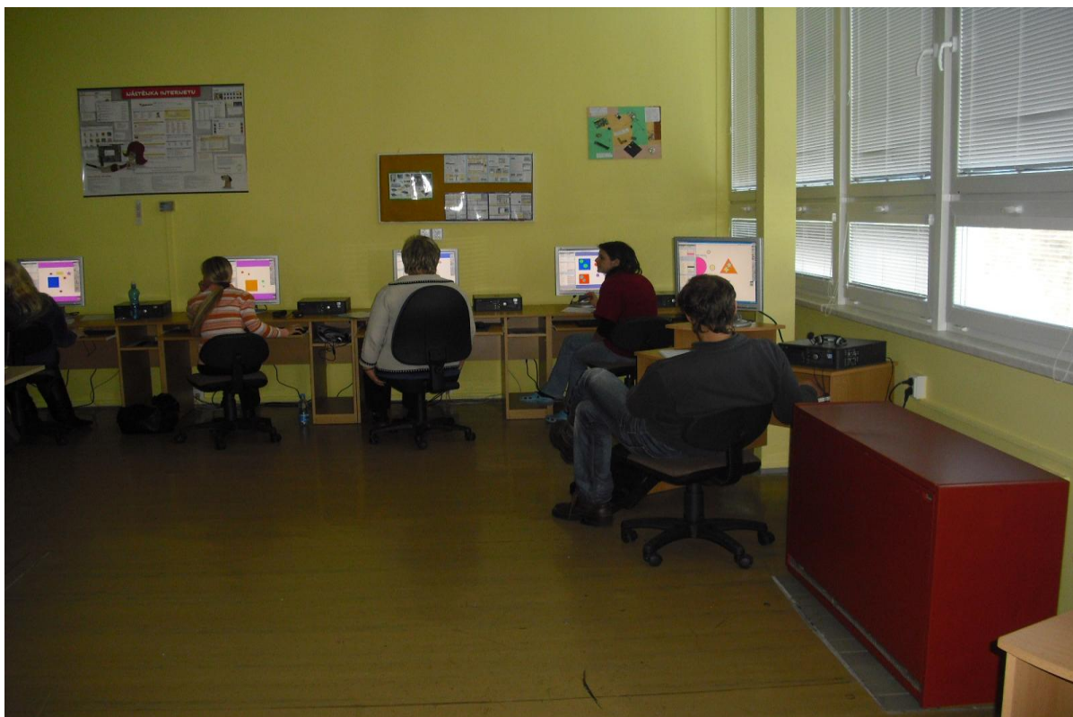
Tvorba digitálních učebních materiálů v rámci projektu „Naše moderní škola“