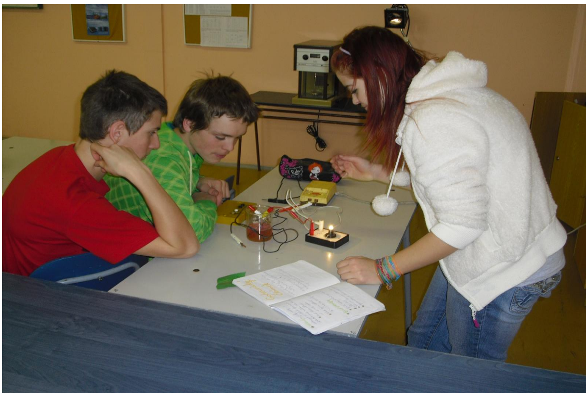
Hodina chemie – pokusy