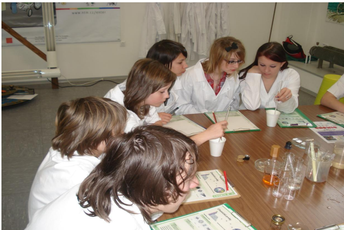
Exkurze do Národního technického muzea, Valdštejnského paláce a na Pražský hrad