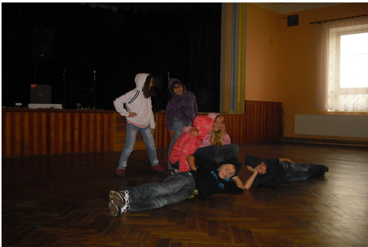
Vystoupení žáků školy na společném setkání důchodců z Třebovice v Čechách a Damníkova