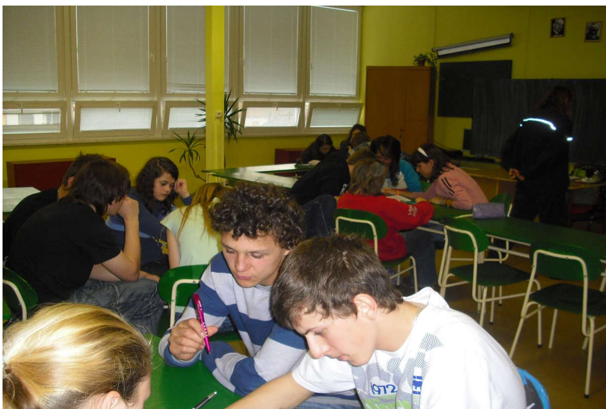
Školní kolo – Právo pro každého