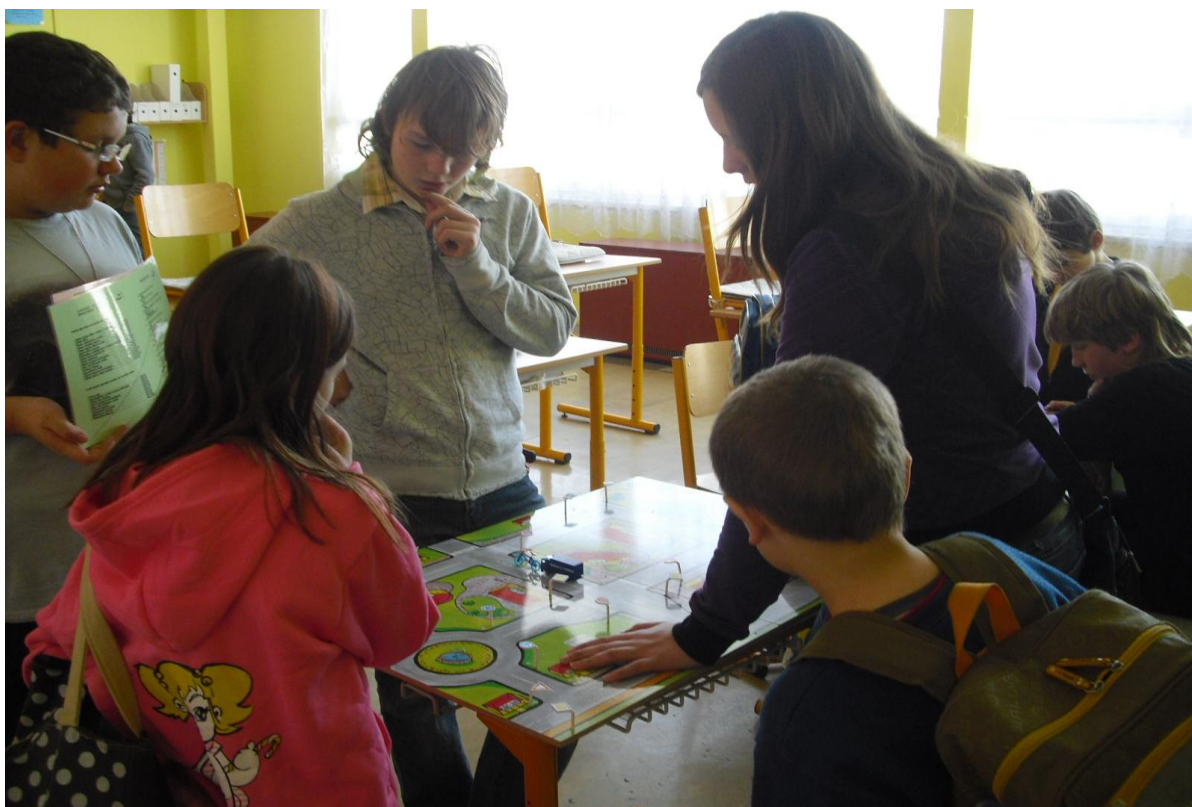
„Bezpečně na chodníku i na silnici“