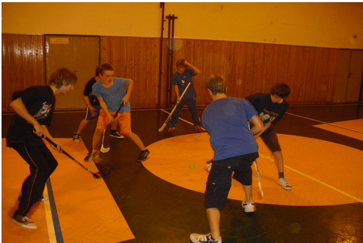
O „Pohár ředitelky školy“ ve florbalu