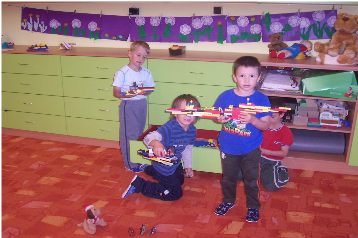
Práce se stavebnicí