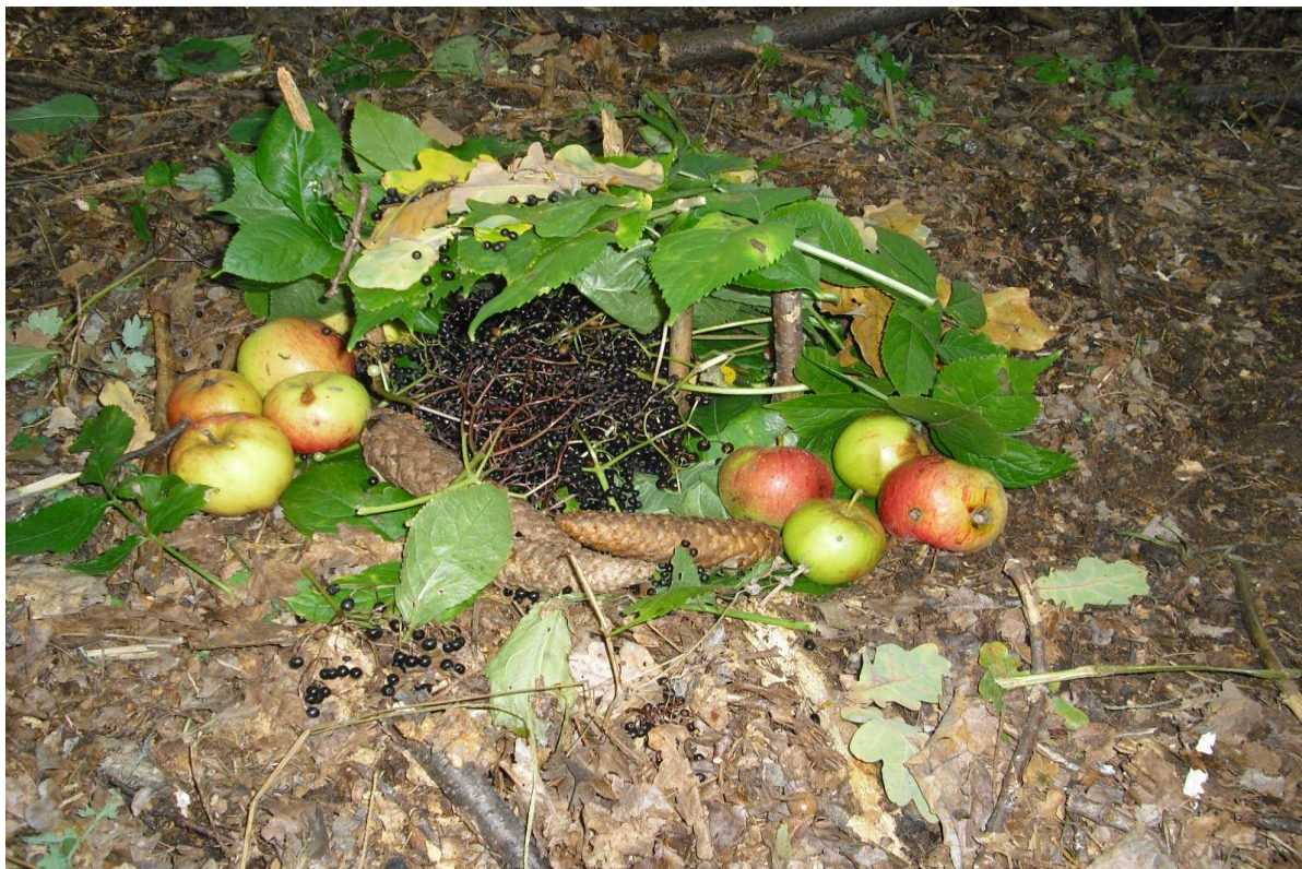
Výtvarná výchova – práce s přírodním materiálem – 1. stupeň