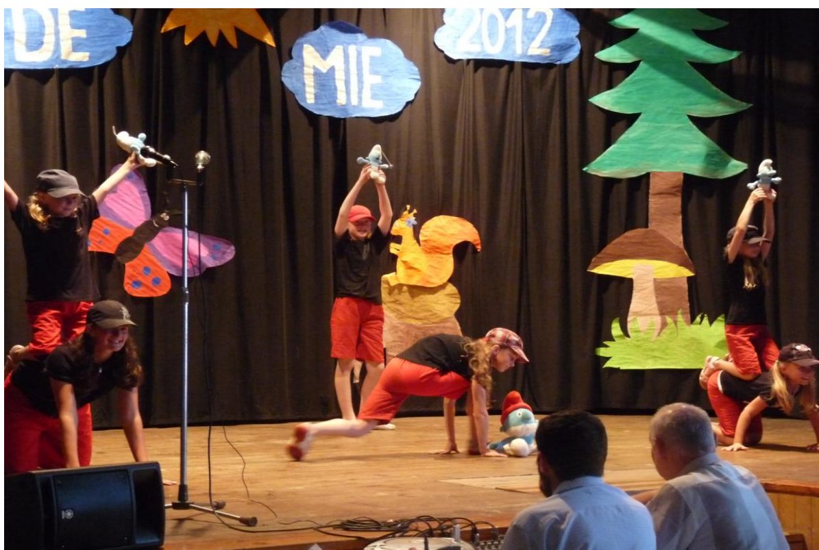
Školní akademie – taneční vystoupení kroužku Šmoulinky