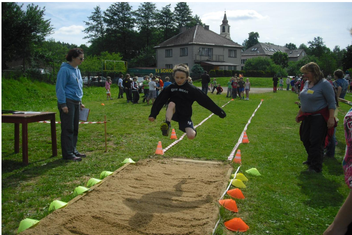
Sportovní výkon ve skoku do dálky – atletické přebory v Rudolticích