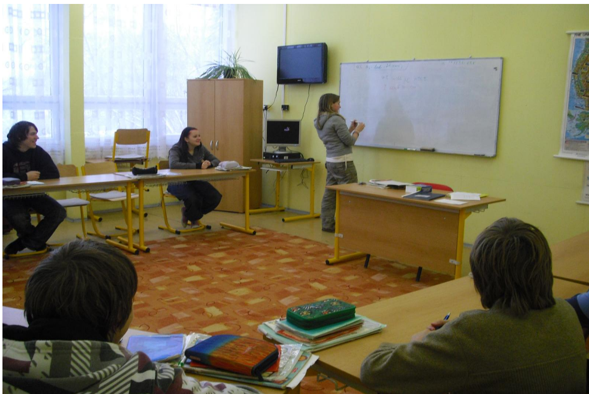
Hodina anglického jazyka