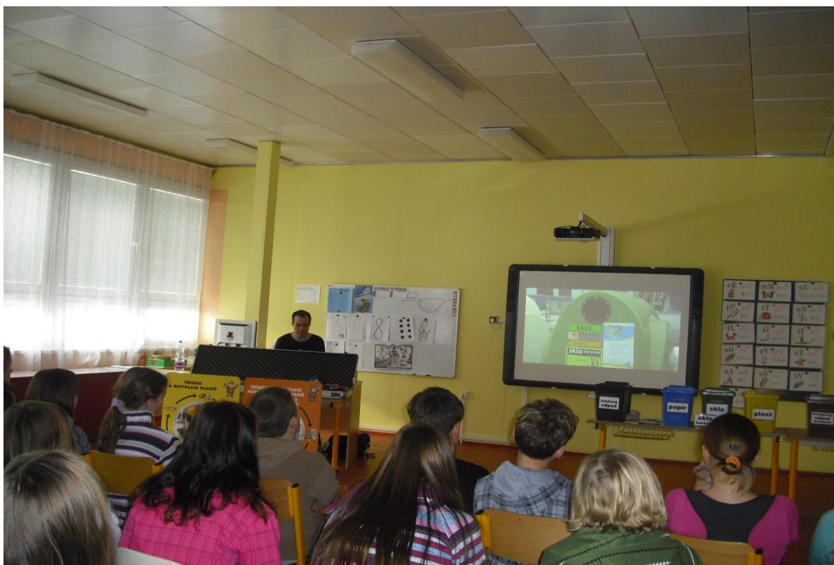
Tonda Obal na cestách – výchovně-vzdělávací program zaměřený na třídění odpadů