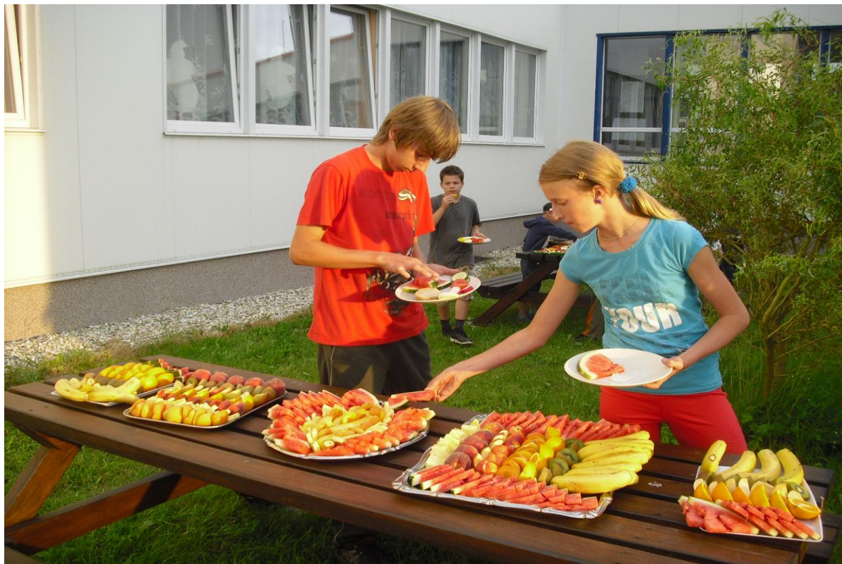
„Pohádky Tisíce a jedné noci“ – večere