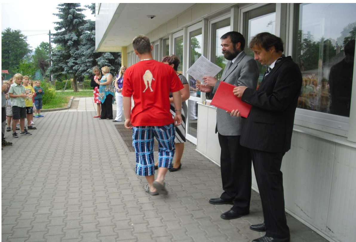
Slavnostní rozloučení se školním rokem – předání odměn