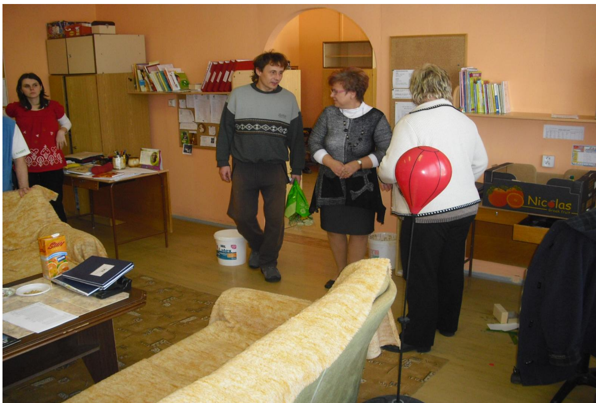
Příprava na předání dárku k odchodu a poslední fáze balení věcí před odchodem na nové působiště v rámci stěhování