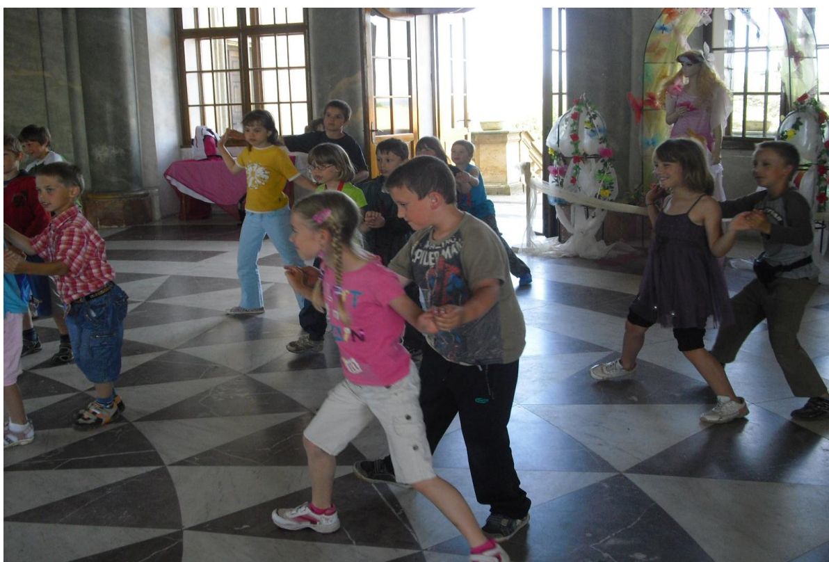
Poznávací výlet – Chlumeck nad Cidlinou