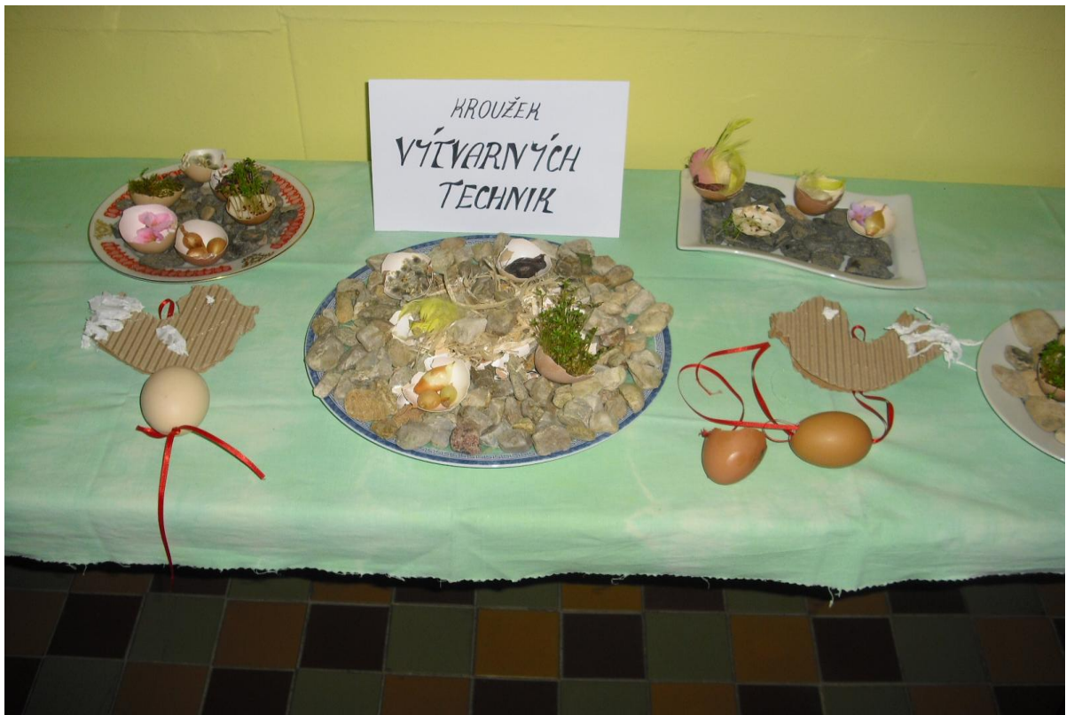
Kroužek výtvarných technik – prezentace na velikonoční výstavě