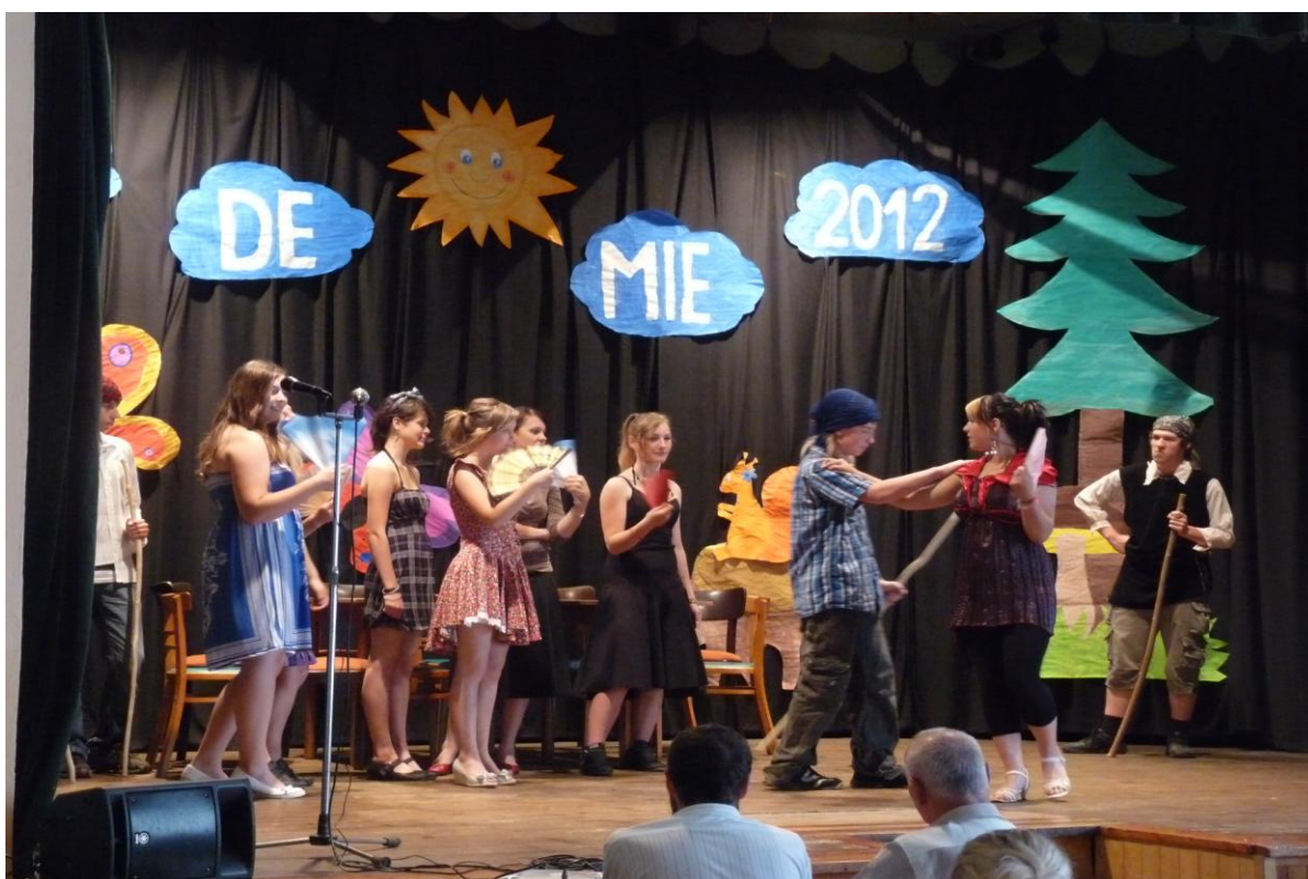
Školní akademie – Carmen v podání žáků 8. ročníku