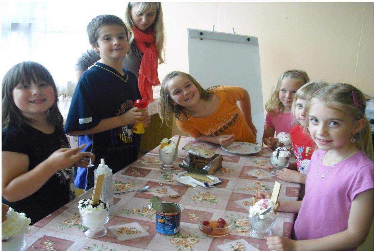
Zdravý životní styl