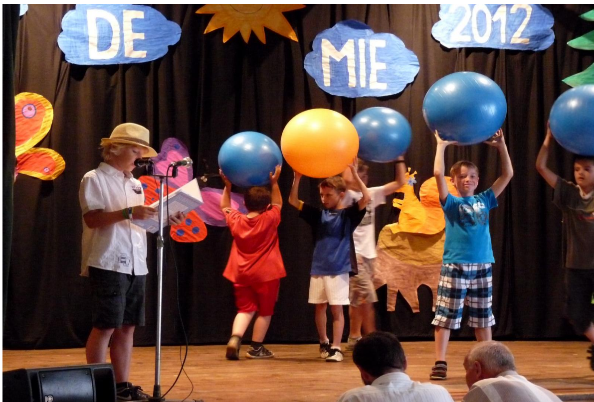
Školní akademie – vystoupení školní družiny