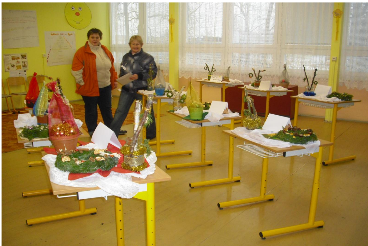
Účast rodičů na výstavách