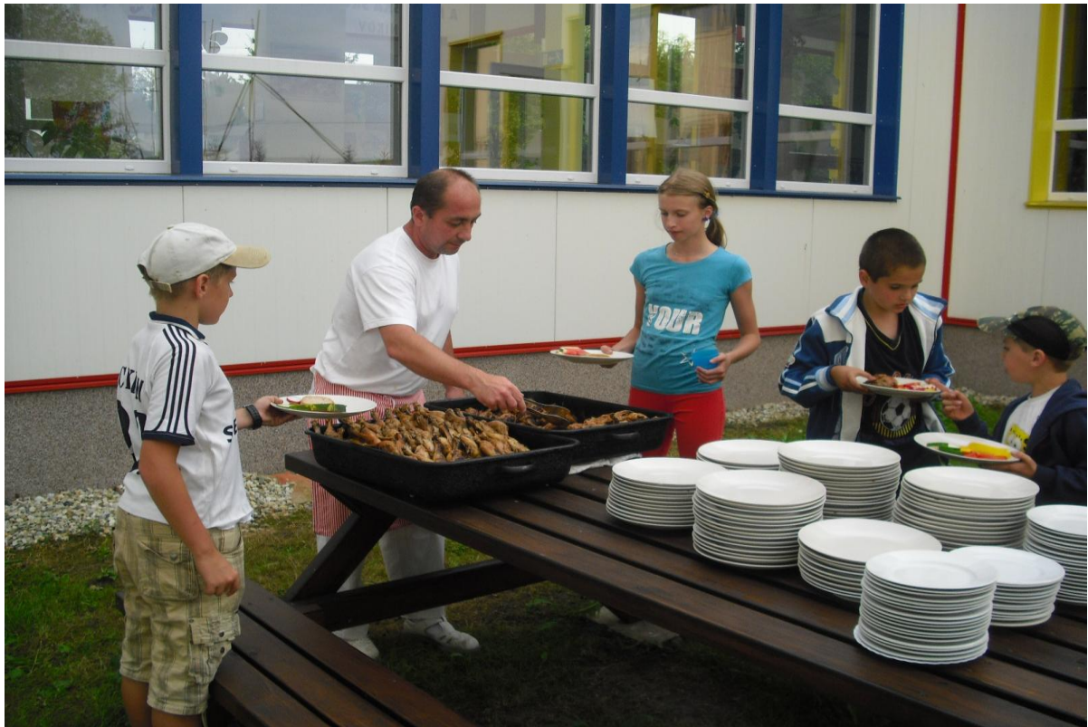
„Pohádky Tisíce a jedné noci“ – večere