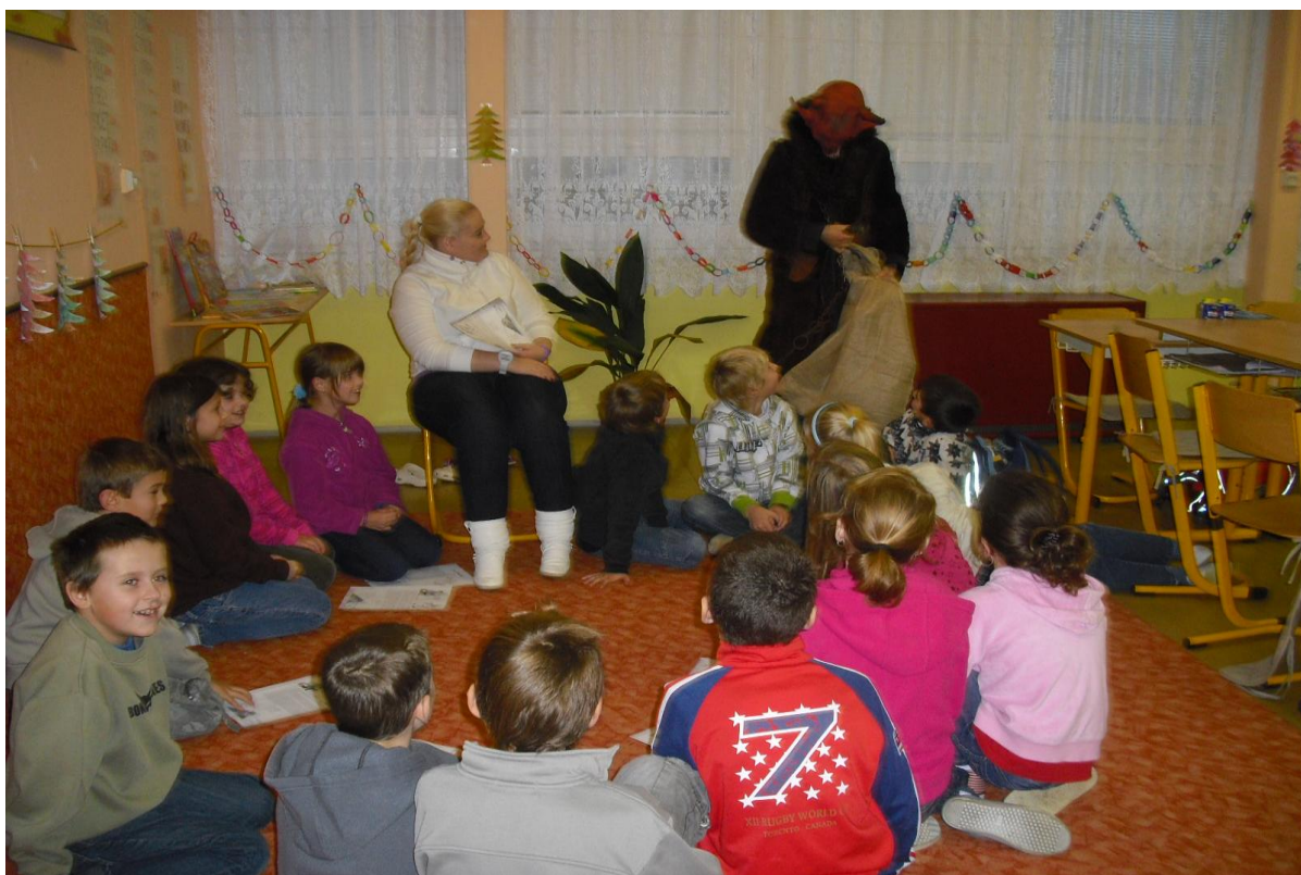
Tradiční mikulášská nadílka