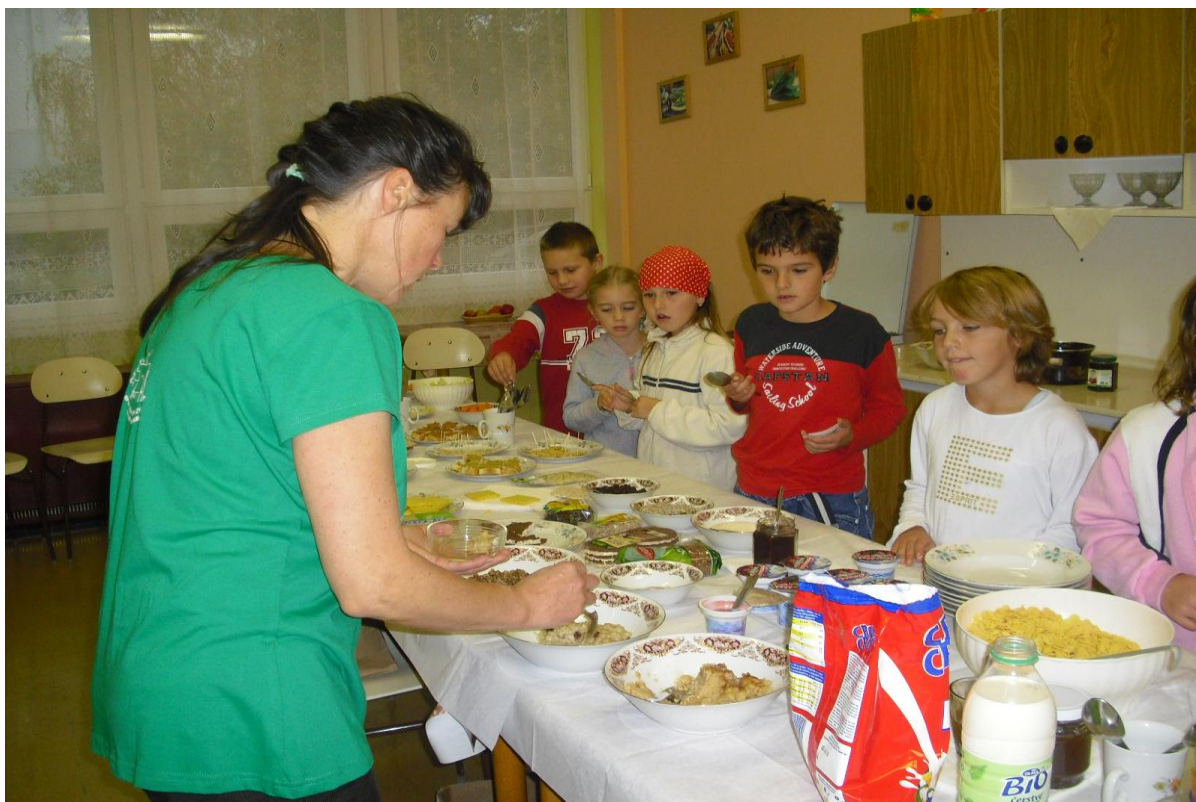
„Hravě a zdravě“ – projekt ve spolupráci s nadačním fondem Albert