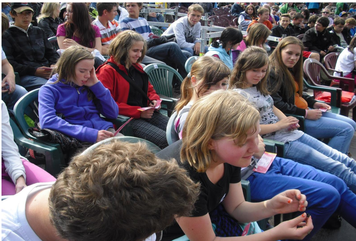
„Enšpígl“ – divadelní představení na Kunětické hoře