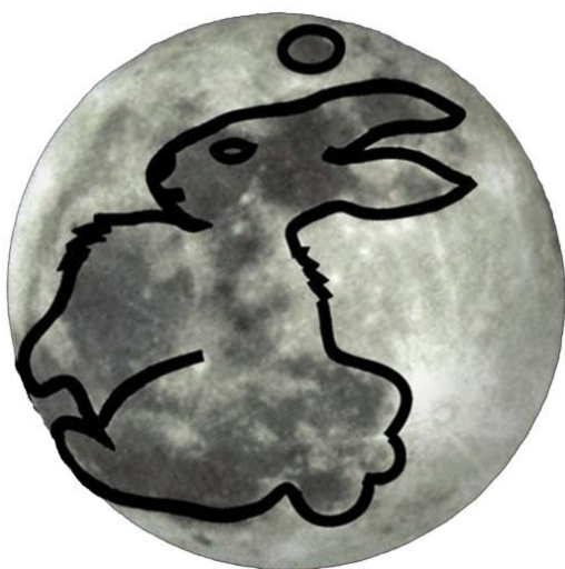
jedno z možných řešení