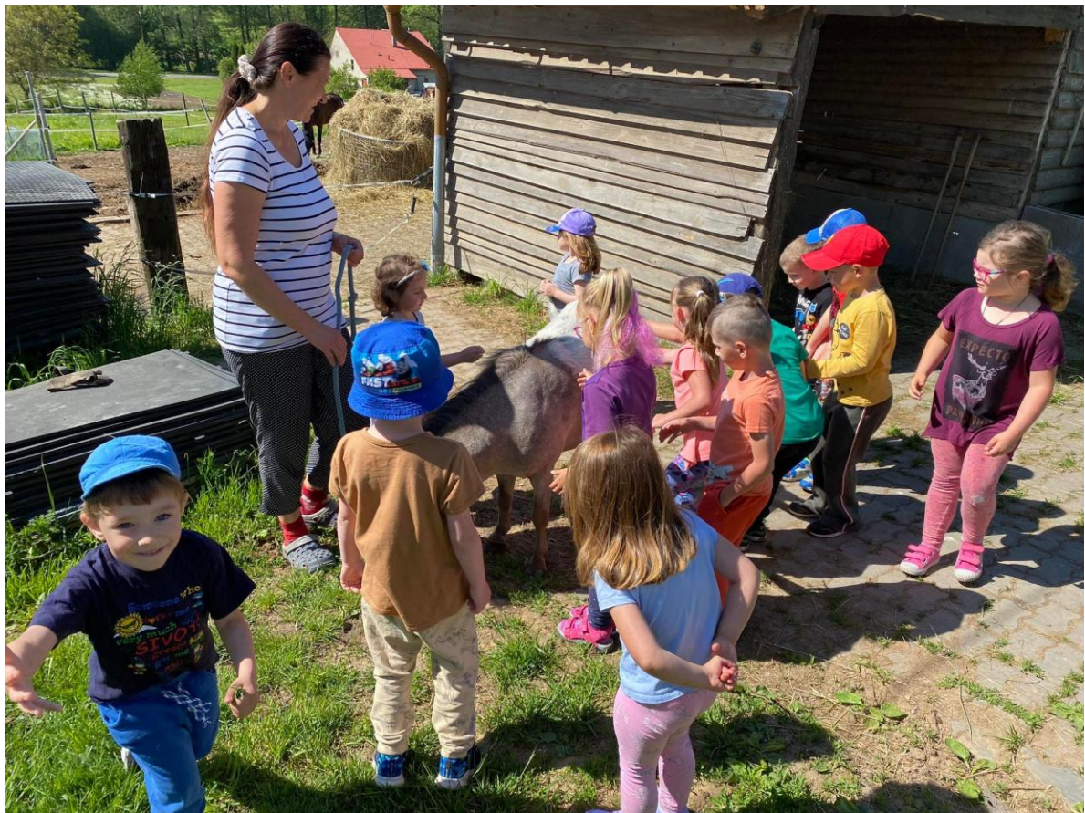
Na výletě u zvířátek.