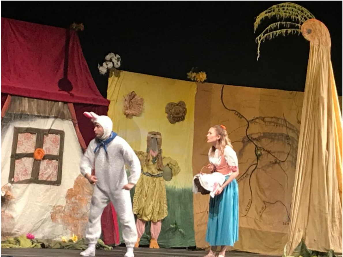
Představení v Lanškrouně – Velikonoční království.