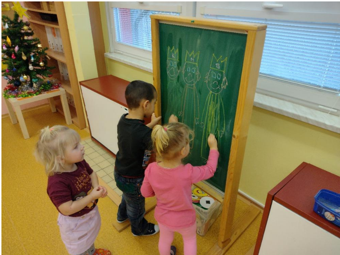
Tři králové ve školce.