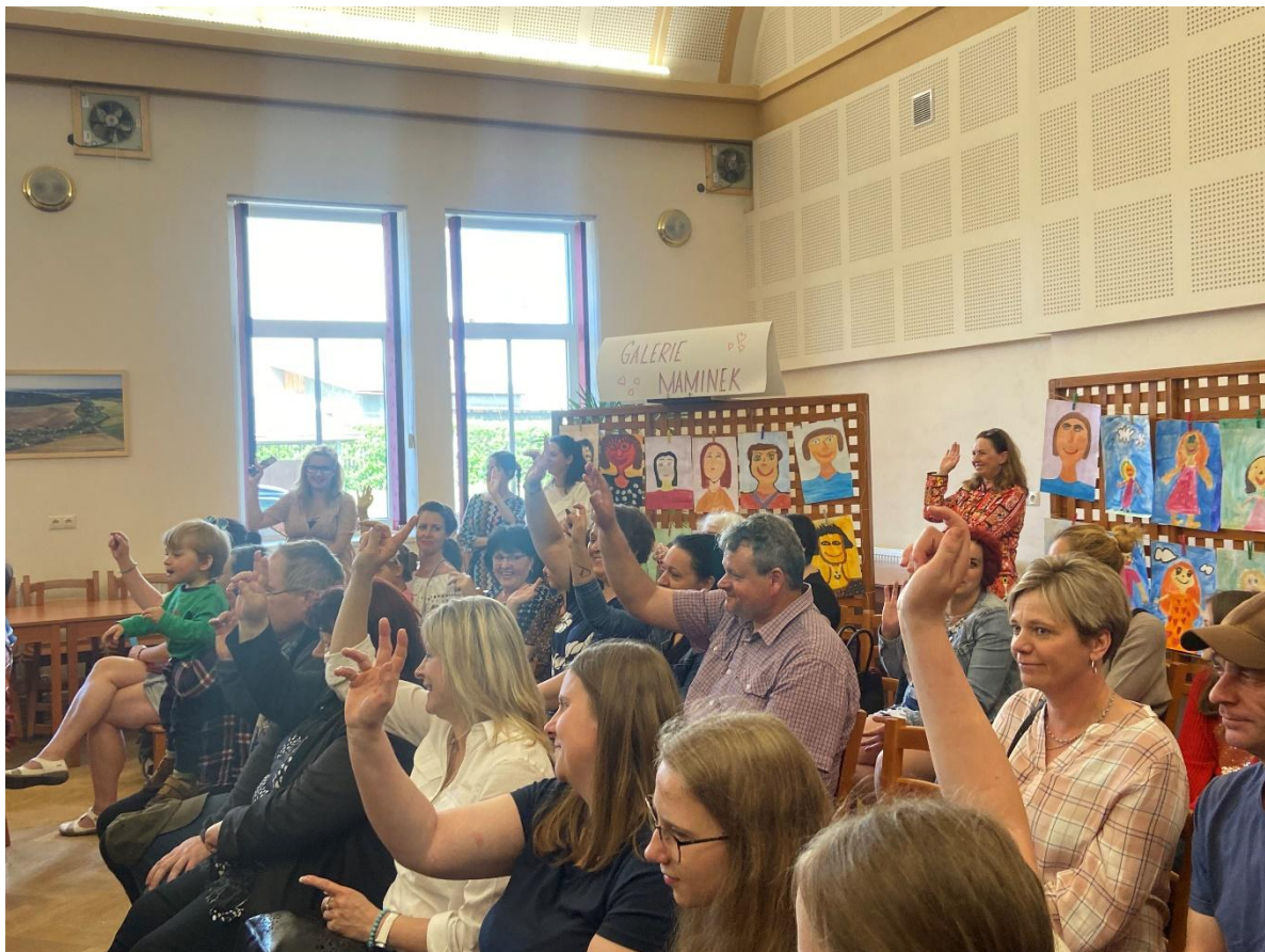
Den pro rodinu