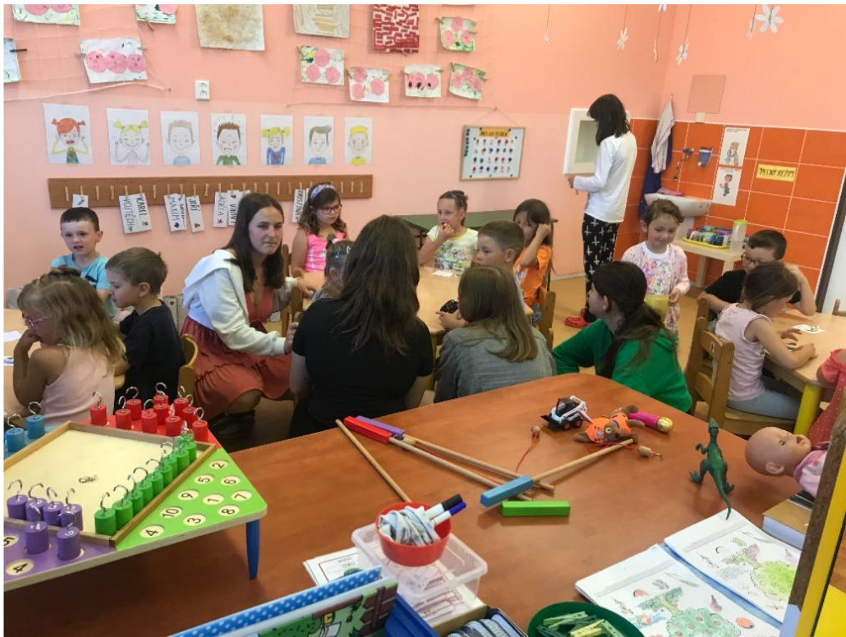
Spolupráce s dětmi předškolního věku