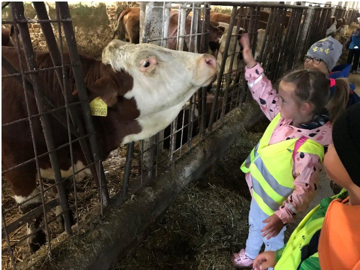
Družstevní slavnosti v Žichlíčku.