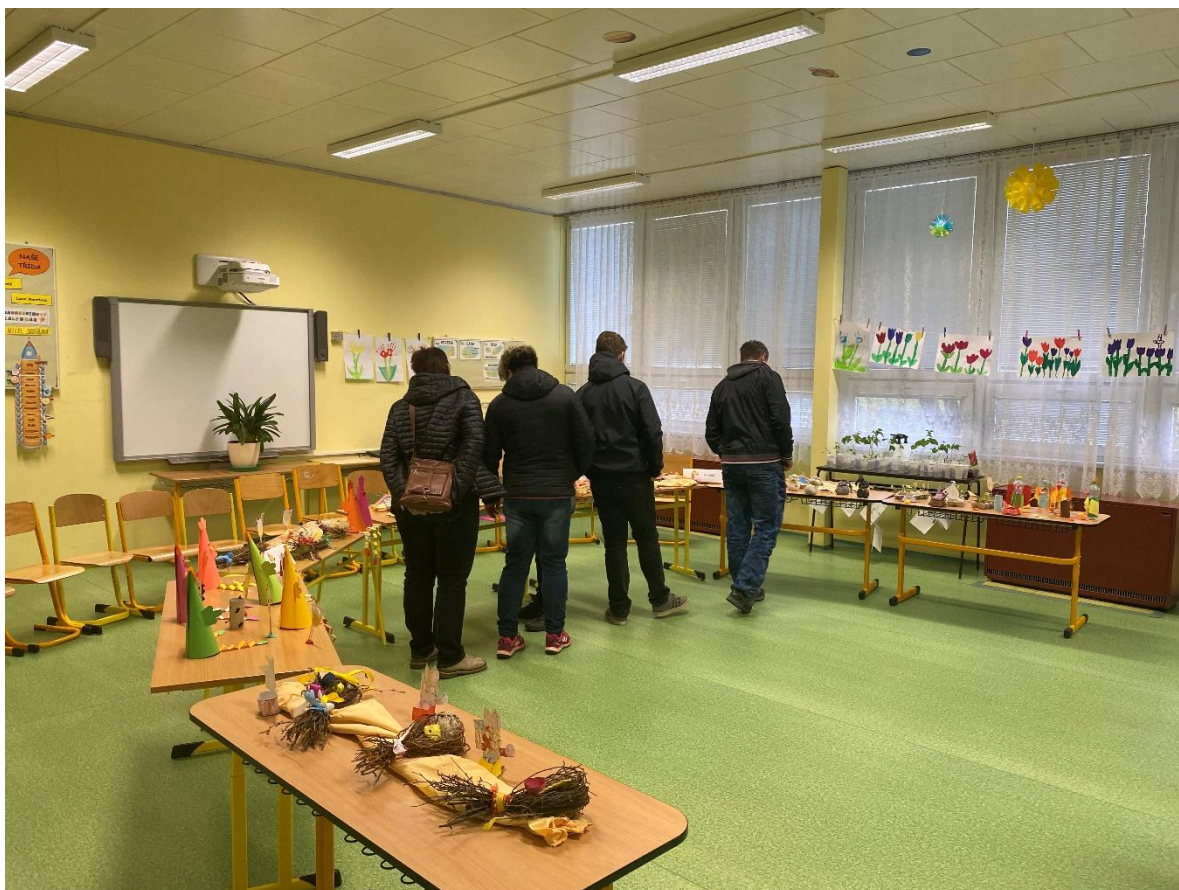
Účast rodičů na výstavách