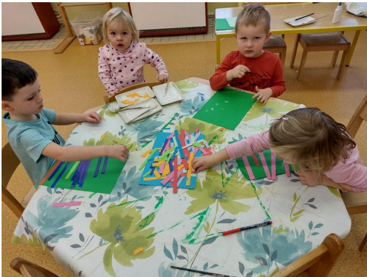
Poslední den probíhal ve znamení vánoční nadílky a vánočních zvyků.