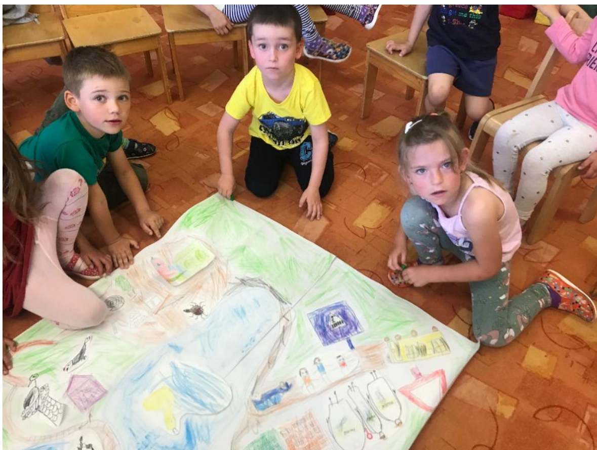
Příprava výletu a výlet velkých žirafek.