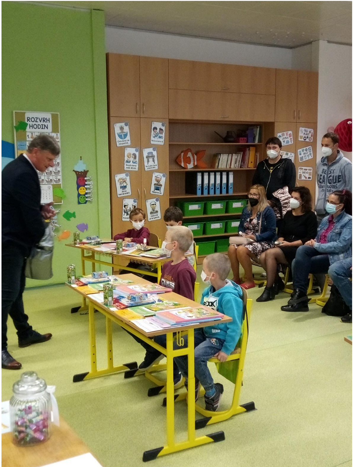
Privítání nových žáků panem starostou