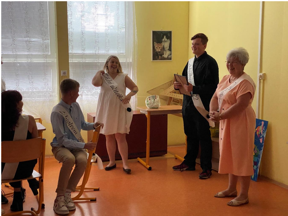
Slavnostní rozloučení s devátáky