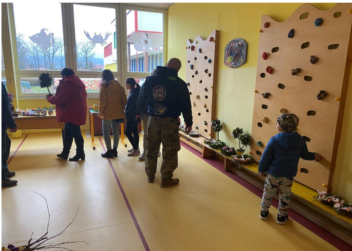
Návštěva bývalých žáků školy během výstav