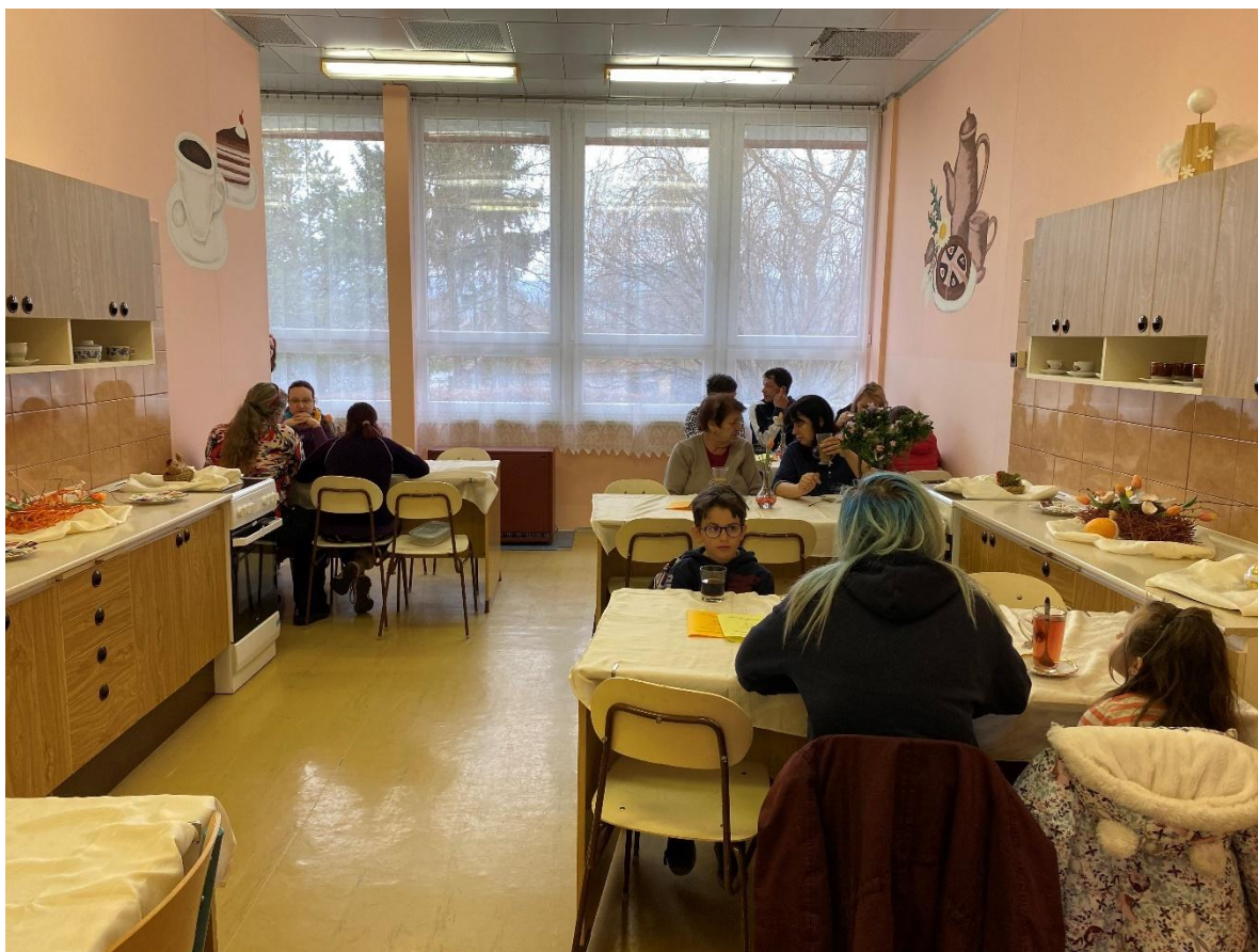
Posezení v kavárničce v průběhu výstav