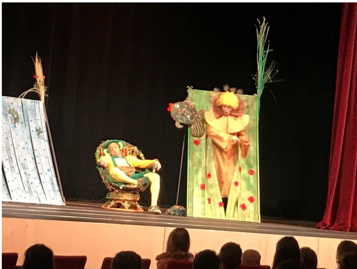
Hrátky s první sněhovou nadílkou.