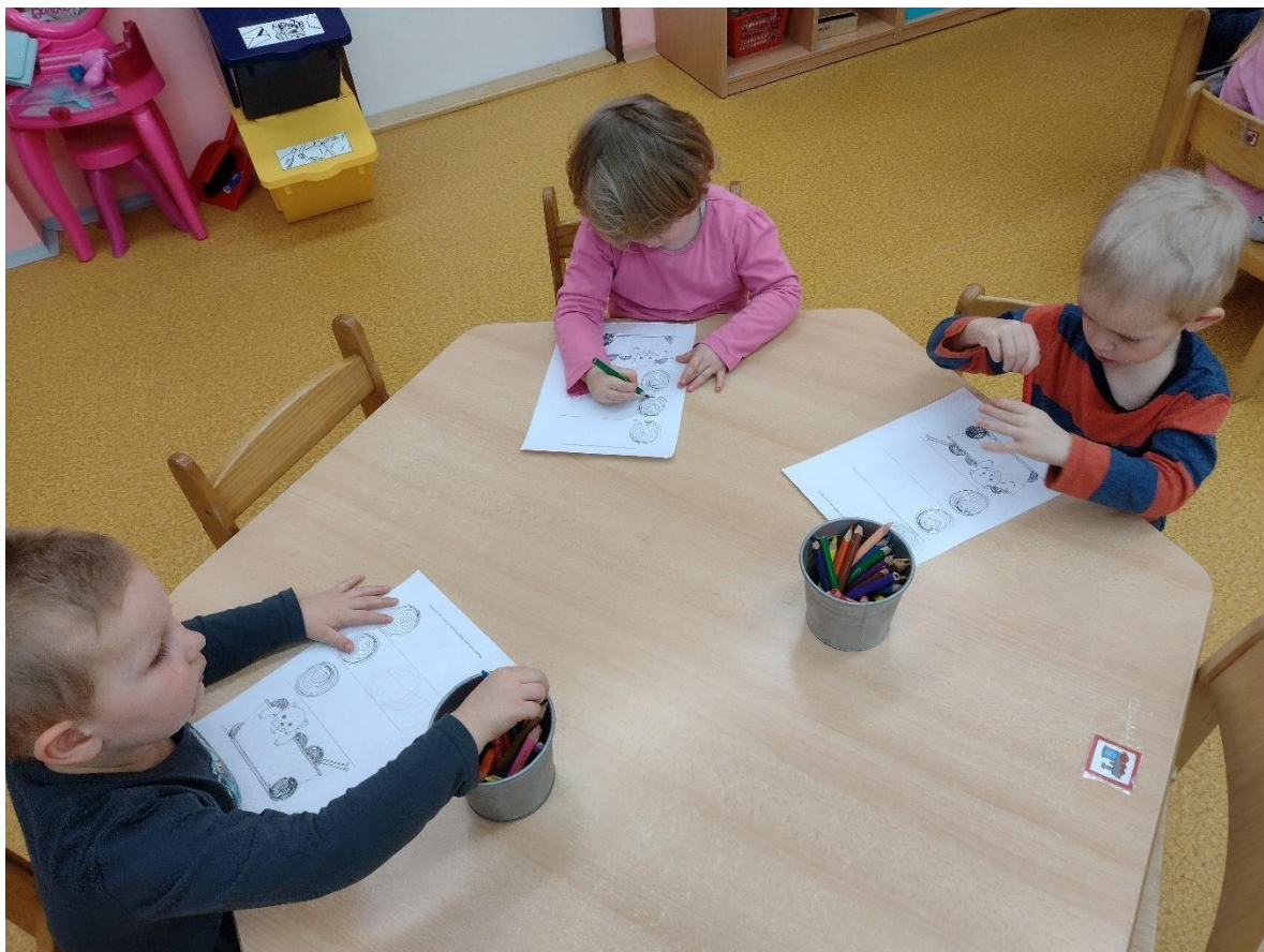
Týden s pohádkami.