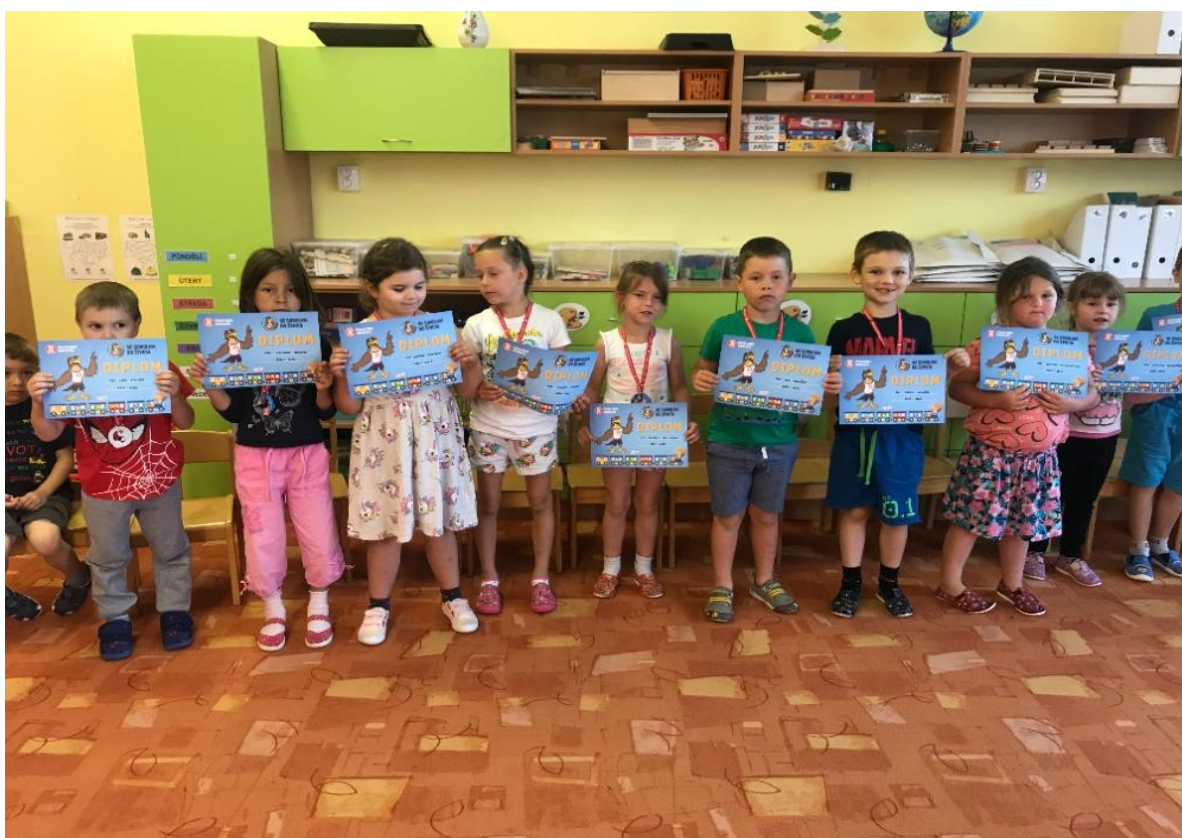
Ukončili jsme kurz plavání a pak jsme si pochutnávali na zmrzlině.