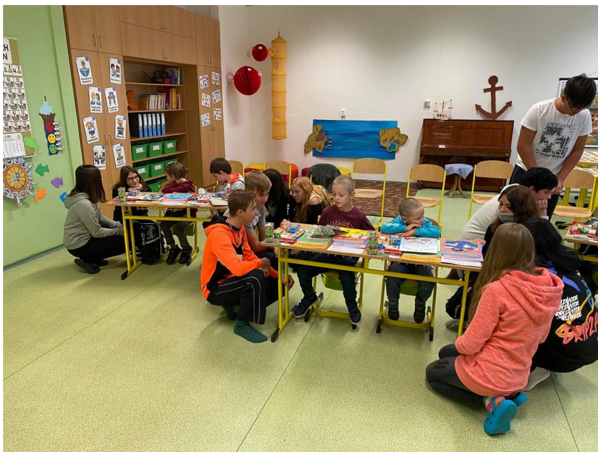
Slavnostní zahájení spolupráce nejstarších s nejmladšími

Nadále se nám daří na naší škole udržet příjemné školní klima, dobré vztahy mezi žáky a rodinné prostředí.