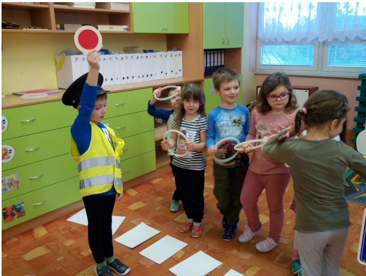
Na jaře nezapomínáme na bezpečnost na silnici.