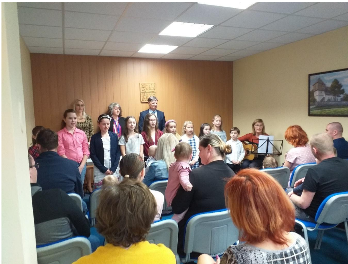
Vystoupení žáků na vítání občánků