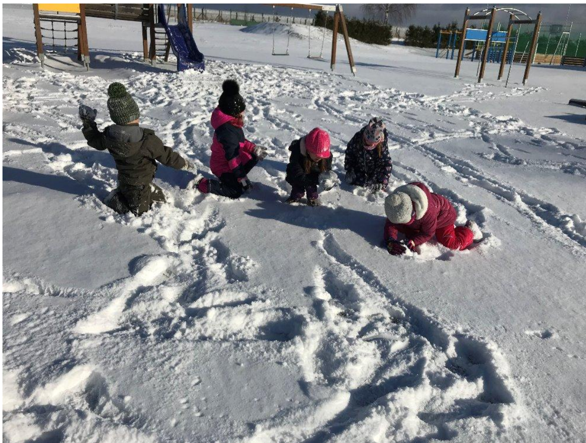
Stopy nejen lidské, ale i od zvířátek.