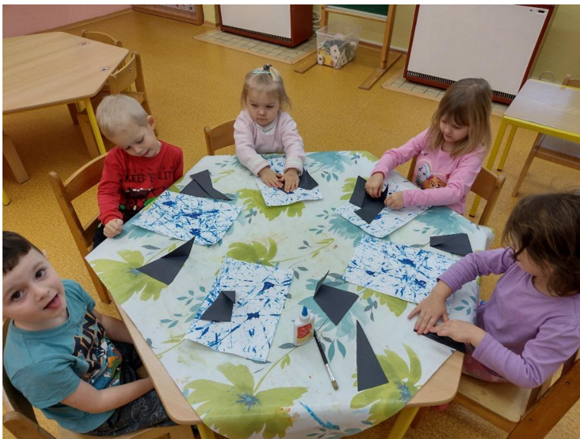
V zimě nezapomínáme na ptáčky.