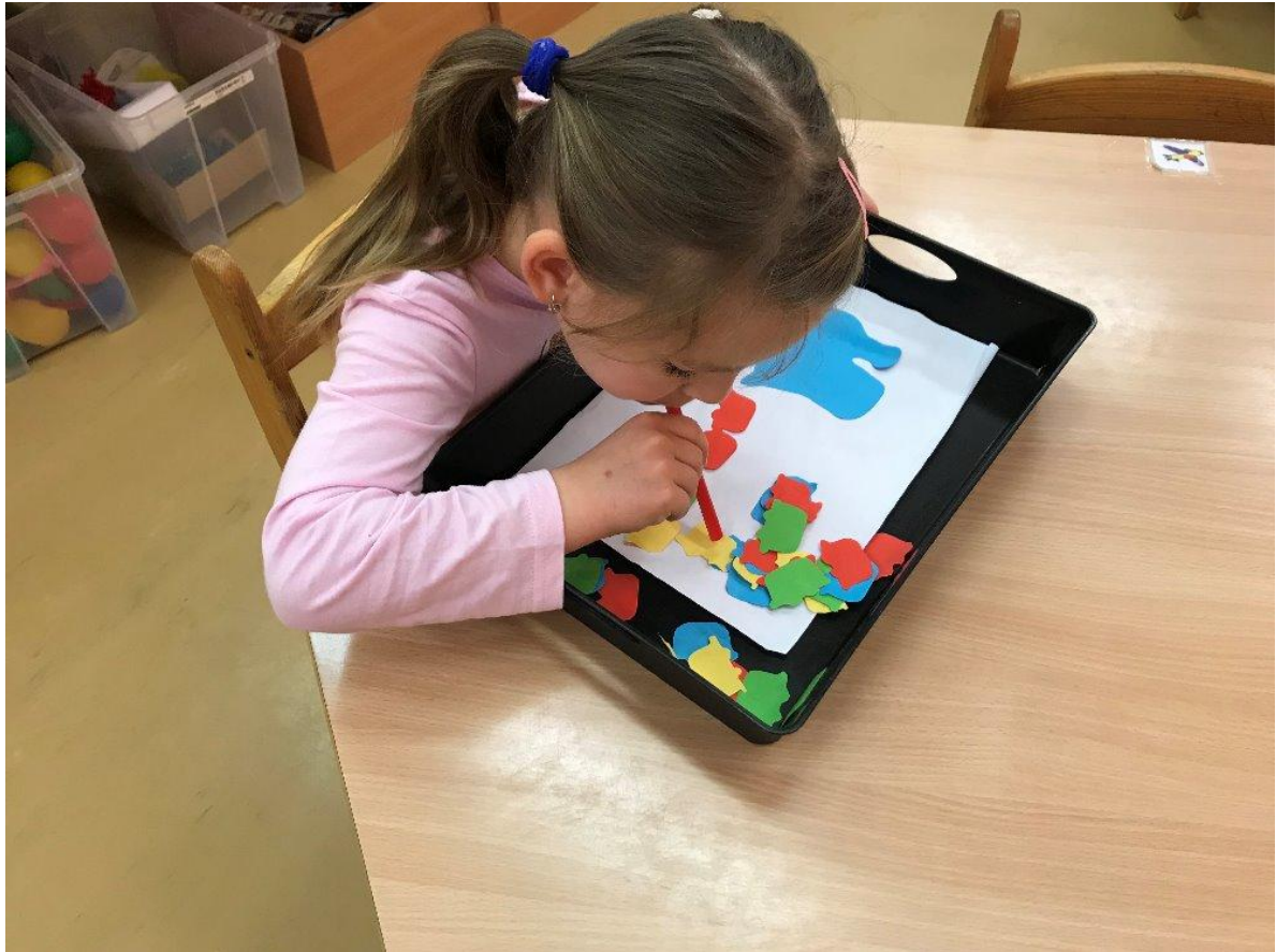
Dopravní výchova trošku jinak.