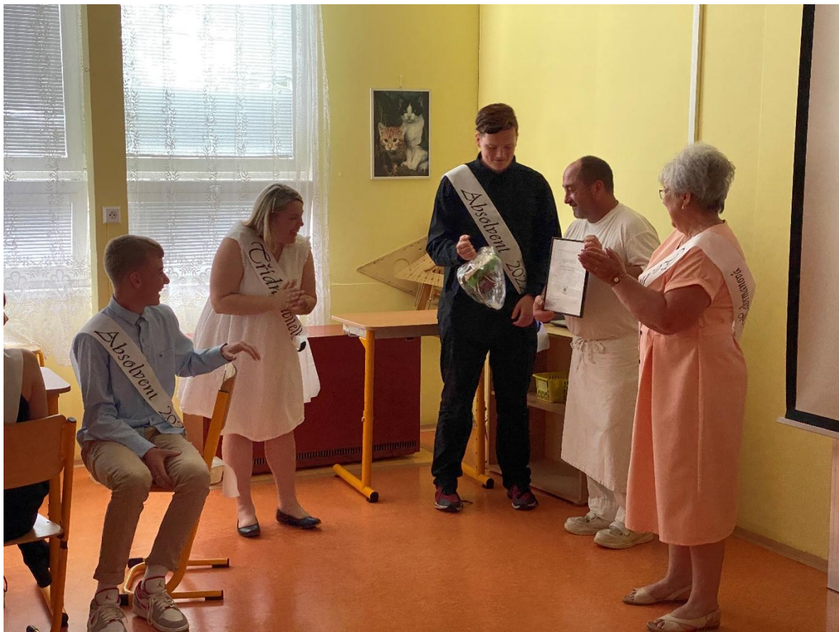
Slavnostní rozloučení s devátáky – předání ceny panu kuchaři