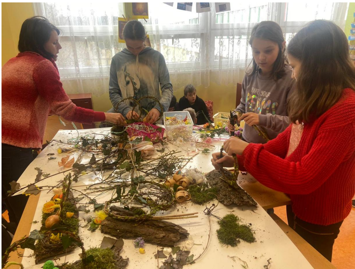
Společné úsilí žáků, pedagogů a nepedagogů na výstavách