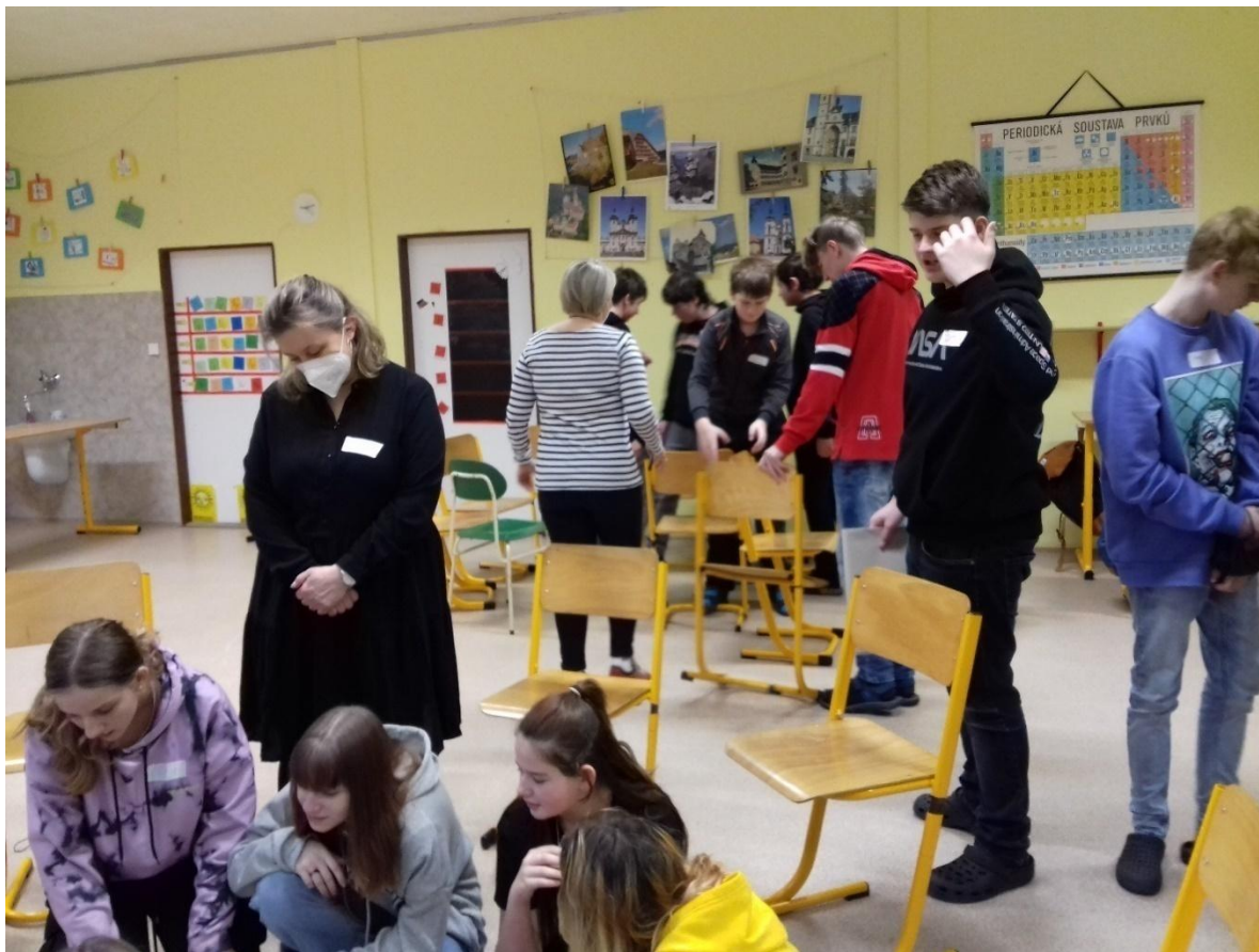
Projektové dny s PPP