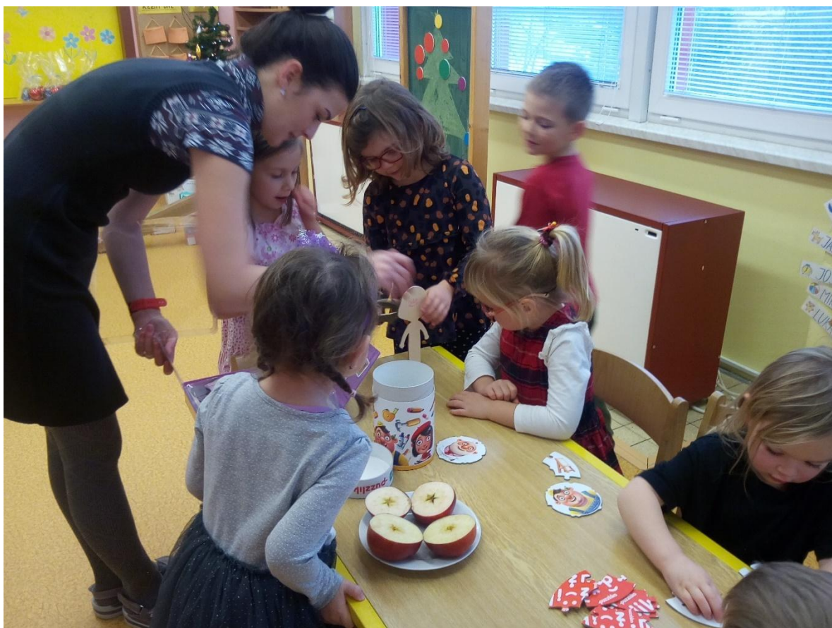
Poslední den probíhal ve znamení vánoční nadílky a vánočních zvyků.