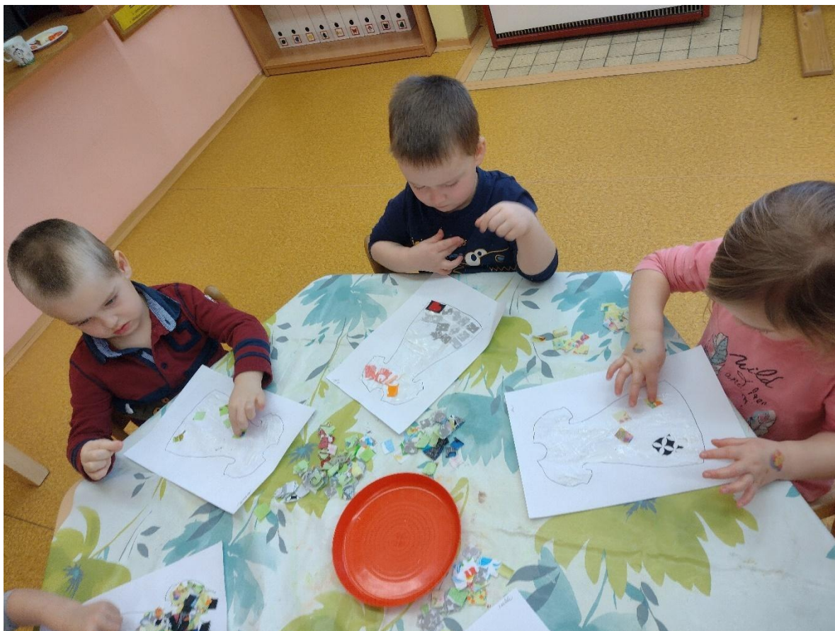
Týden s pohádkami.