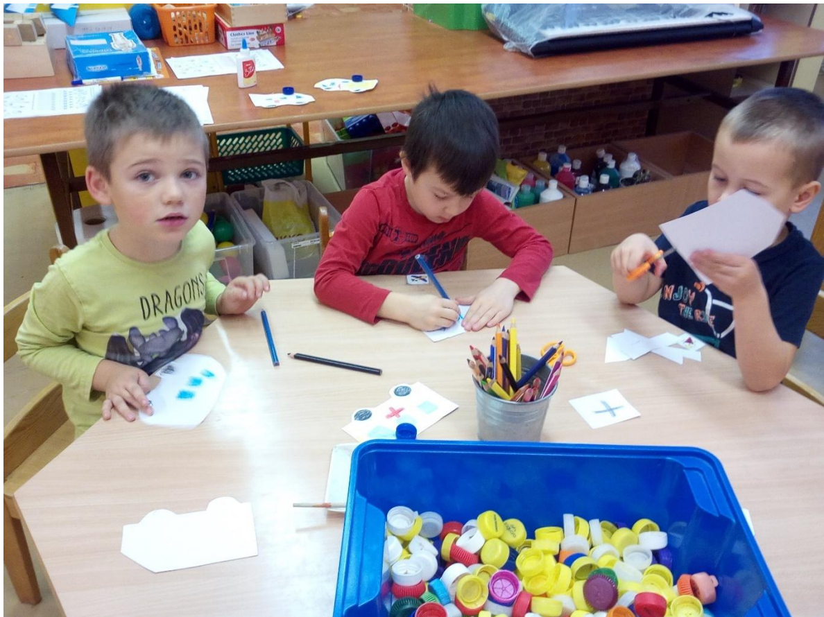
Naše tělo a zdraví.