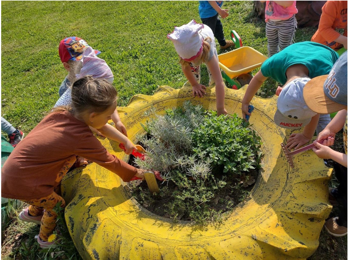
Práce na záhonku.