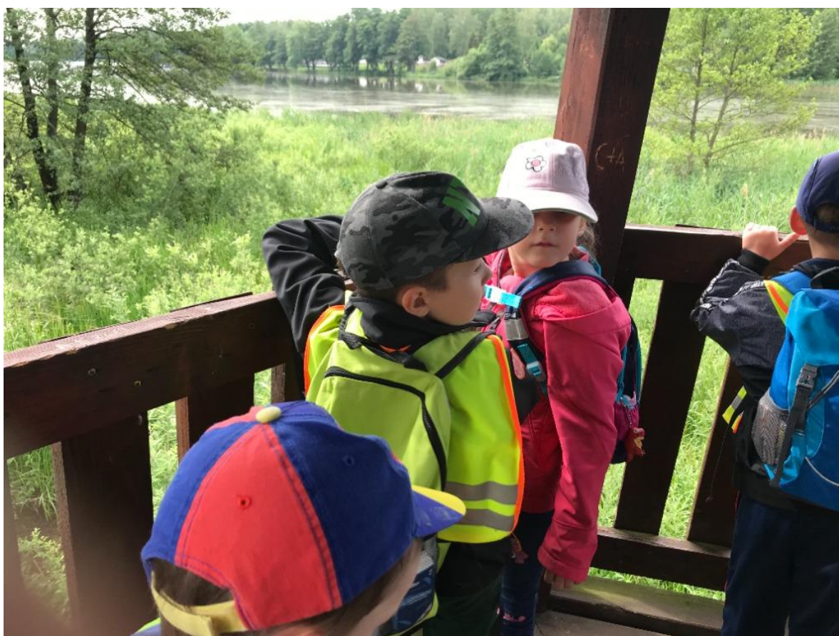
Koncem června jsme splnili poslední etapu z projektu „Svět nekončí za vrátky, cvičíme se zvířátky“ a kromě krásných medailí jsme obdrželi i spoustudárků.