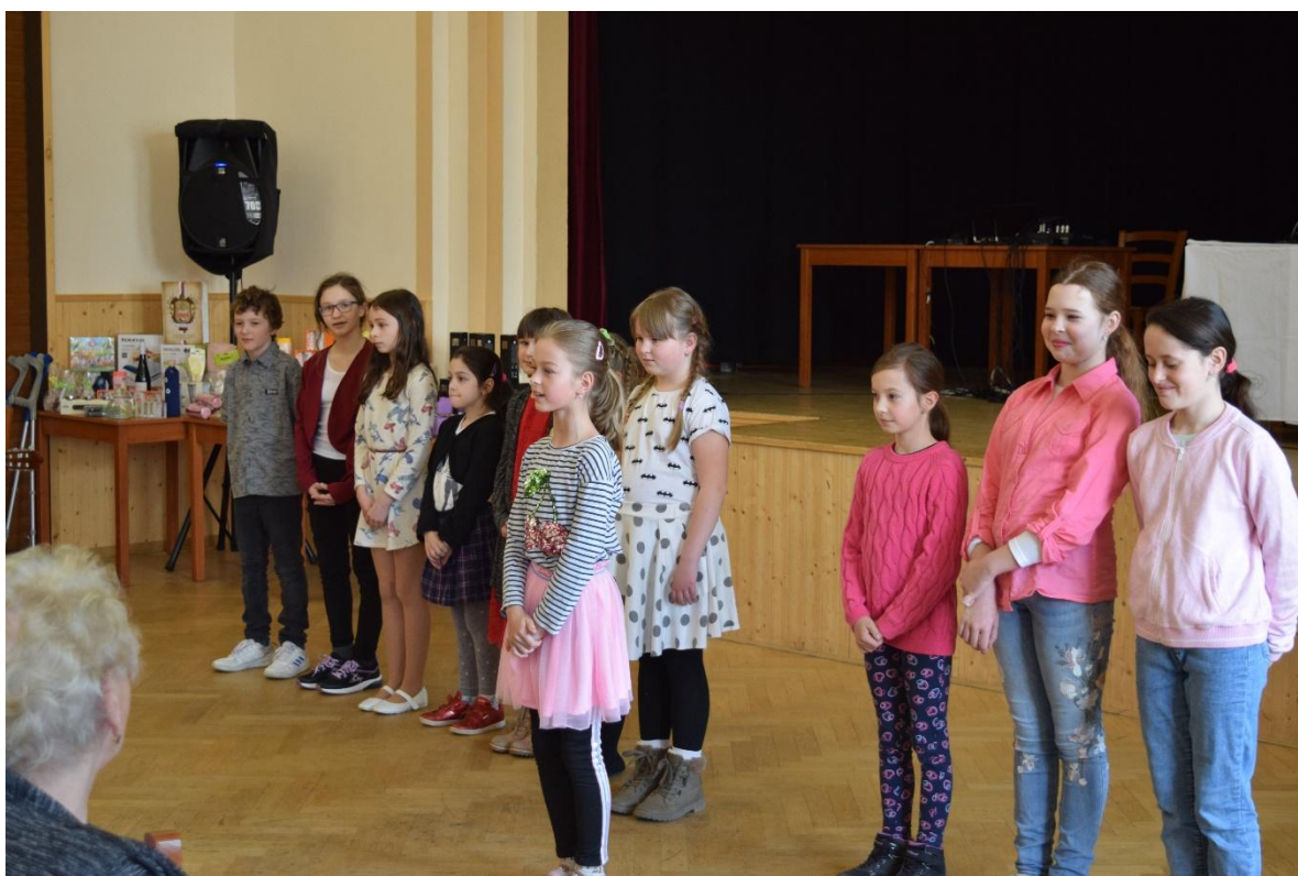
Vystoupení na schůzi důchodců

Mezi nové aktivity patří návštěva pana starosty ve škole. Zde se seznamuje s akcemi na další období a domlouváme návrhy pro další spolupráci.