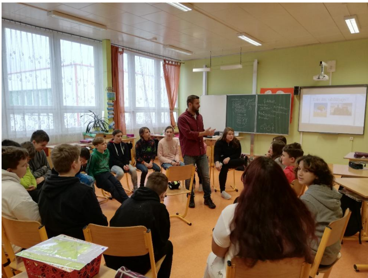
Projektové dny s ACERem