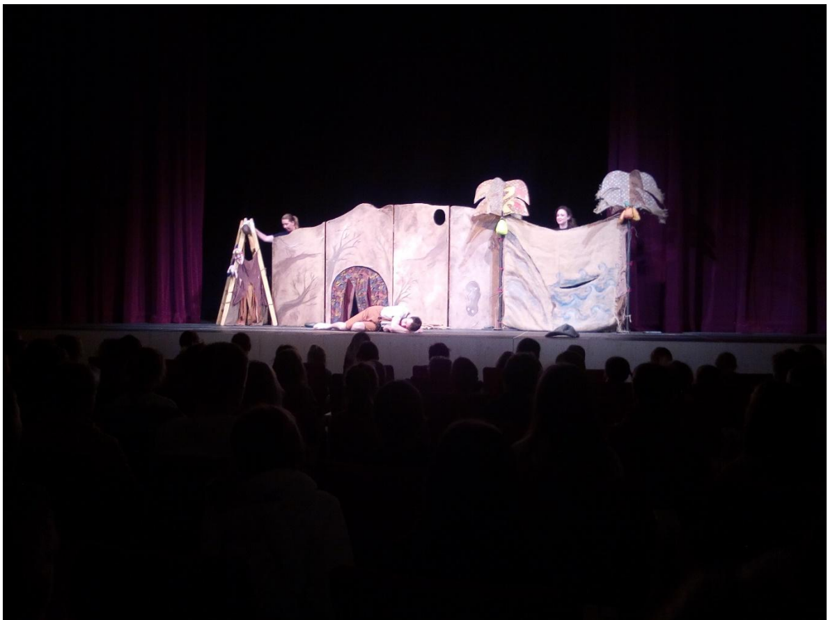
Představení v Lanškrouně – O Pračlovíčkovi.