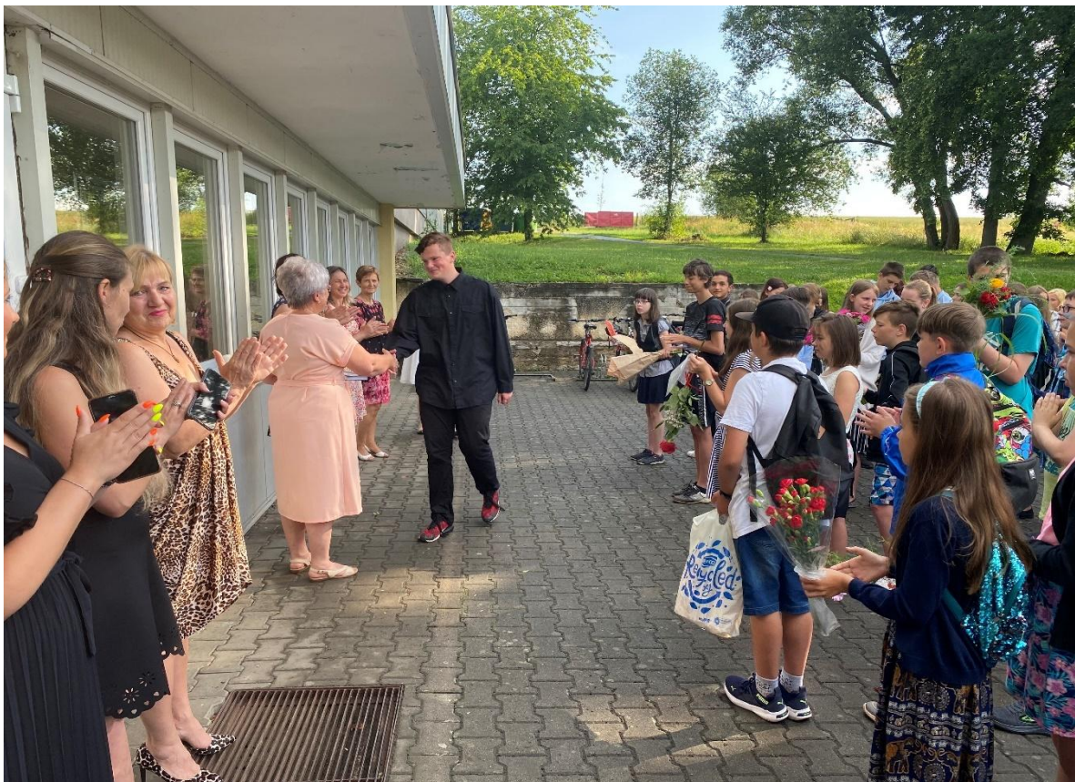
Společné ukončení školního roku a předání odměn před budovou školy