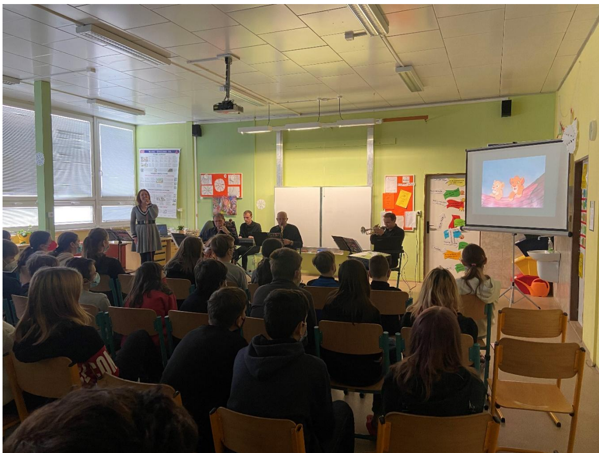
„Svět muzikálů“ – Filharmonie Pardubice