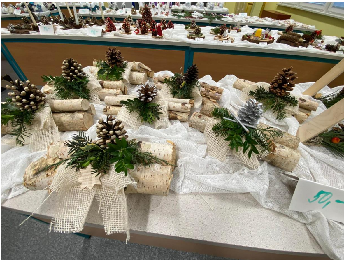
Pohled na vánoční výrobky připravené k prodeji