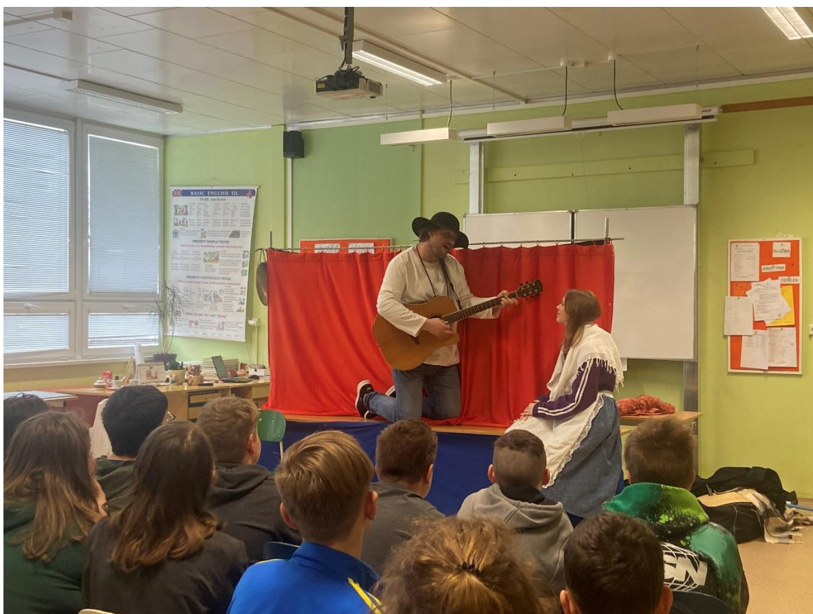
„Divadelní učebnice“ – Divadélko pro školy Hradec Králové