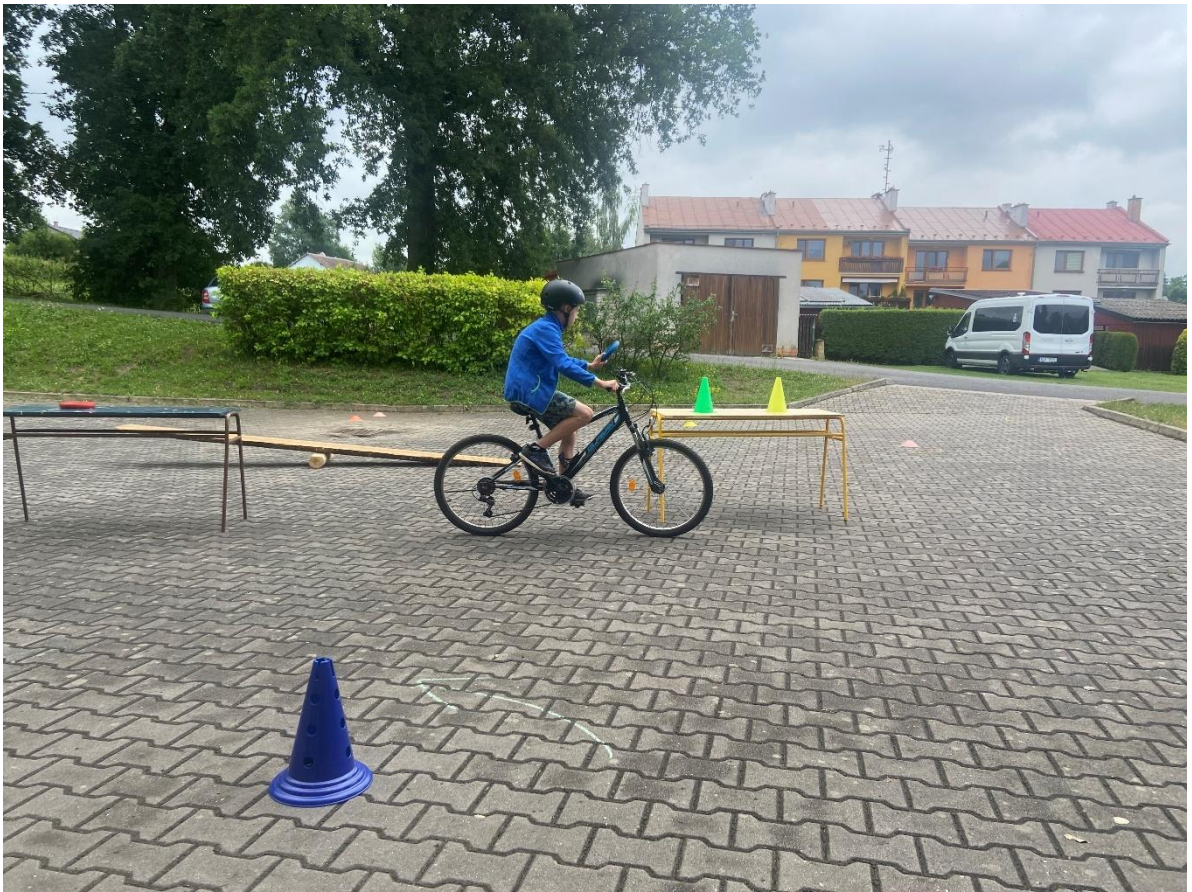
Markétina dopravní výchova