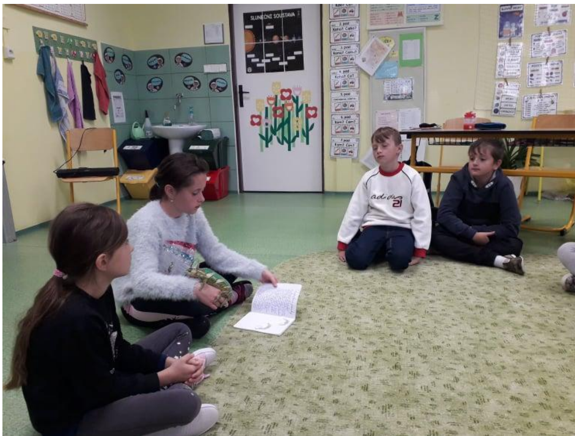
Přírodověda – domácí mazlíčci