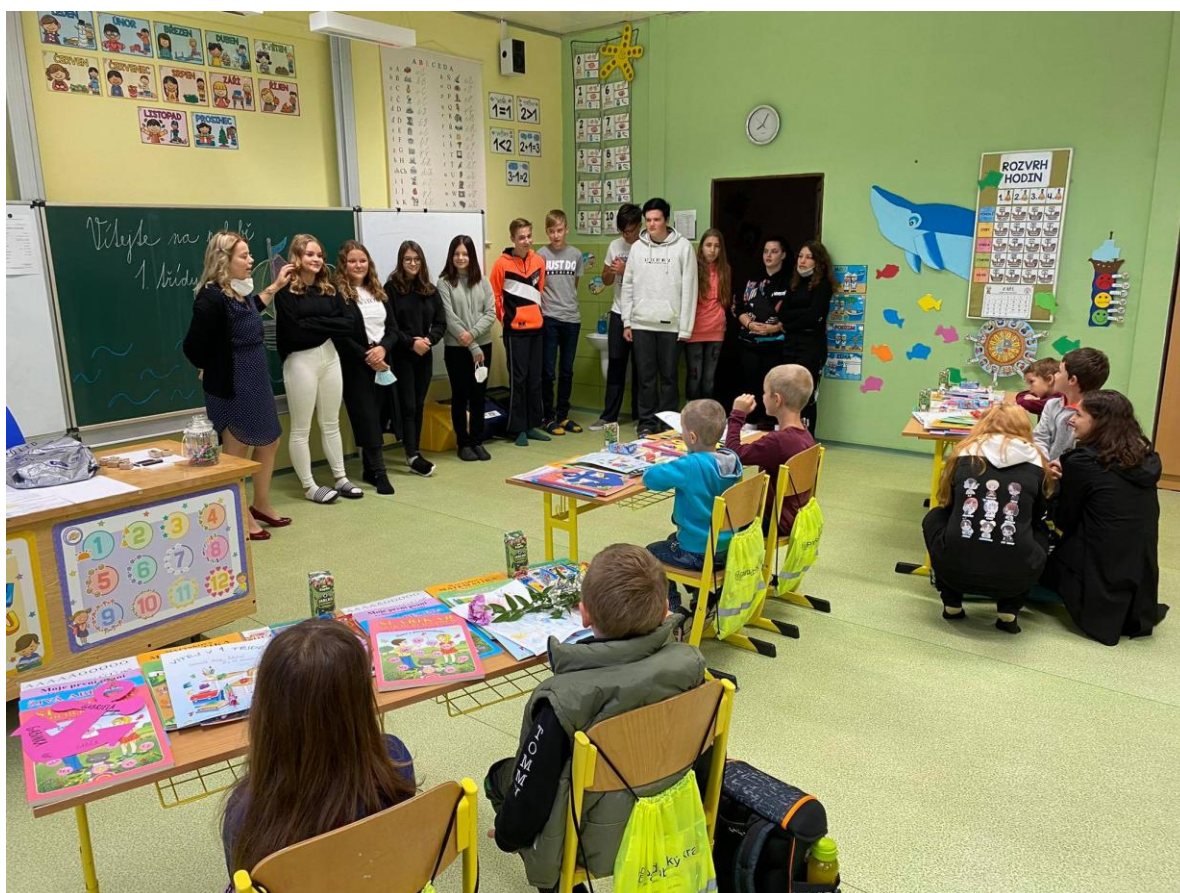
Naši noví žáci – první den ve škole

Celkem se vyučovalo v 9 třídách. Během školního roku bylo otevřeno 1 oddělení školní družiny, které navštěvovalo 54 žáků.