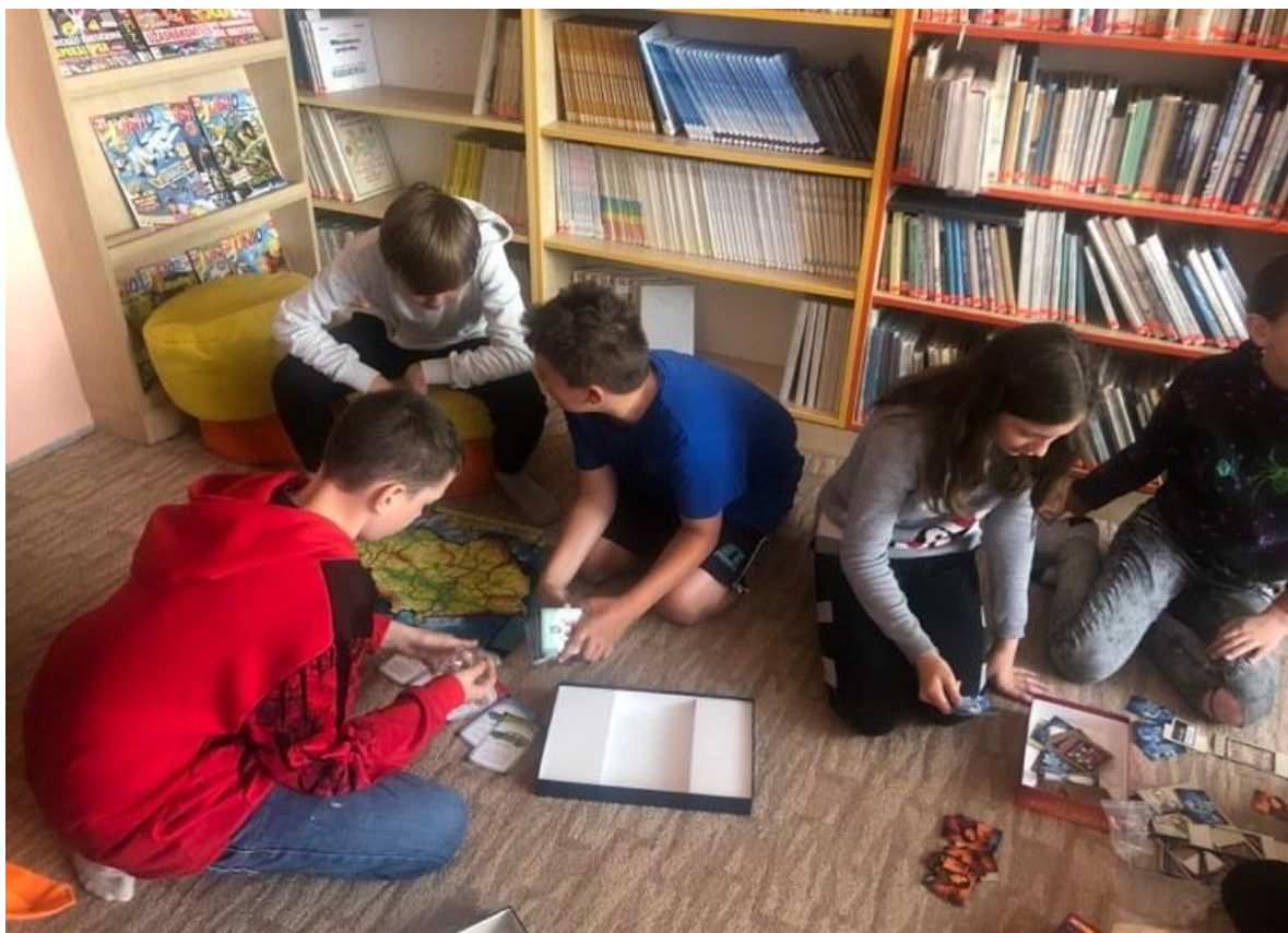
Klub zábavné logiky a deskových her