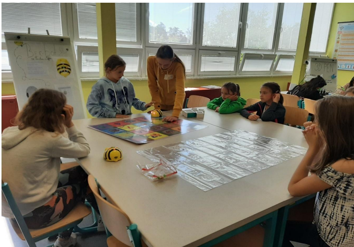
Den s robotikou v Damníkově