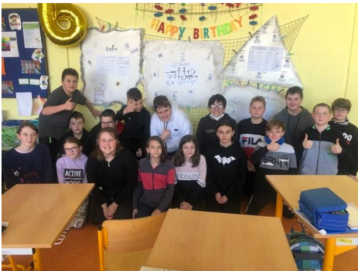
Dějepis - Egypt