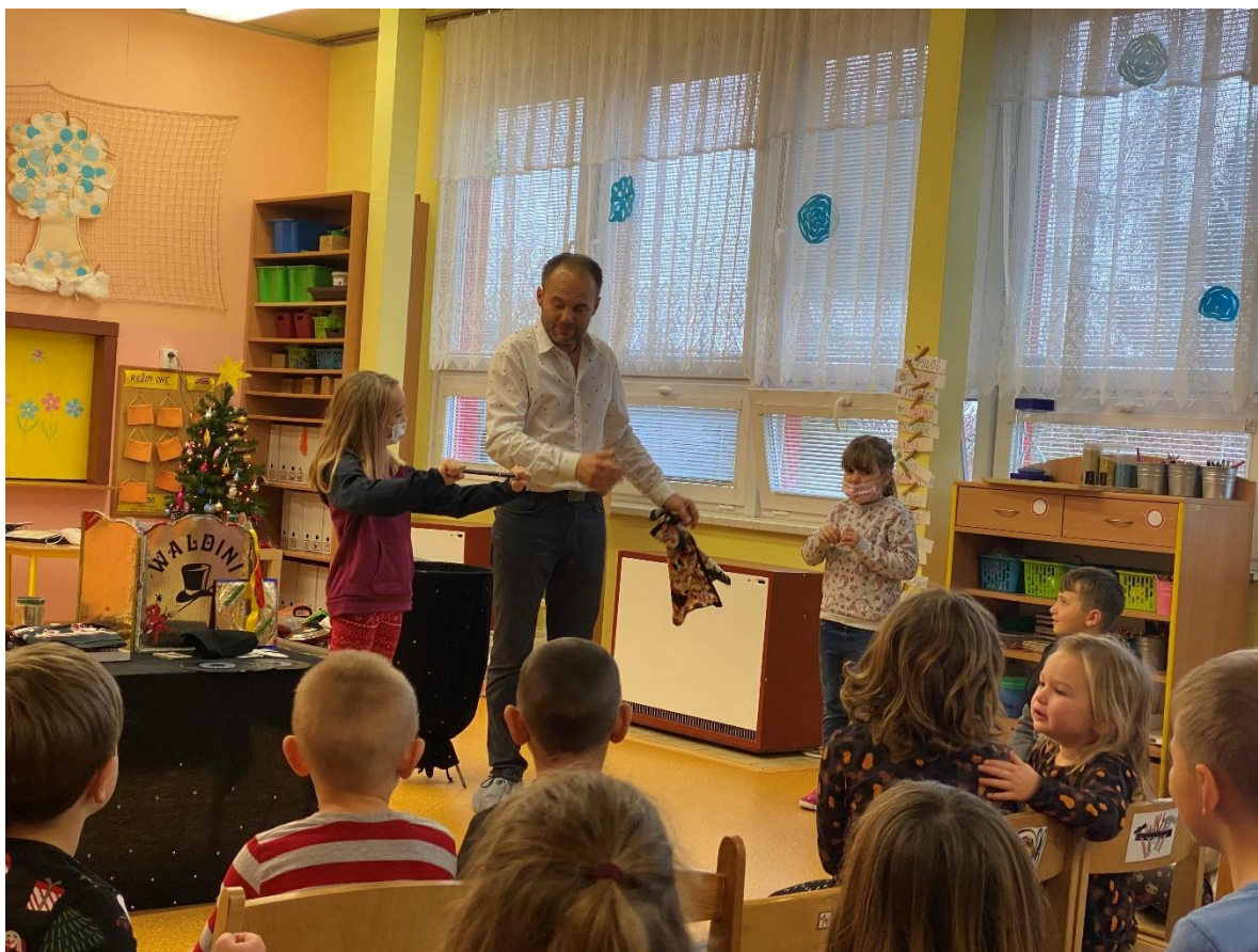
Dopoledne s kouzelníkem