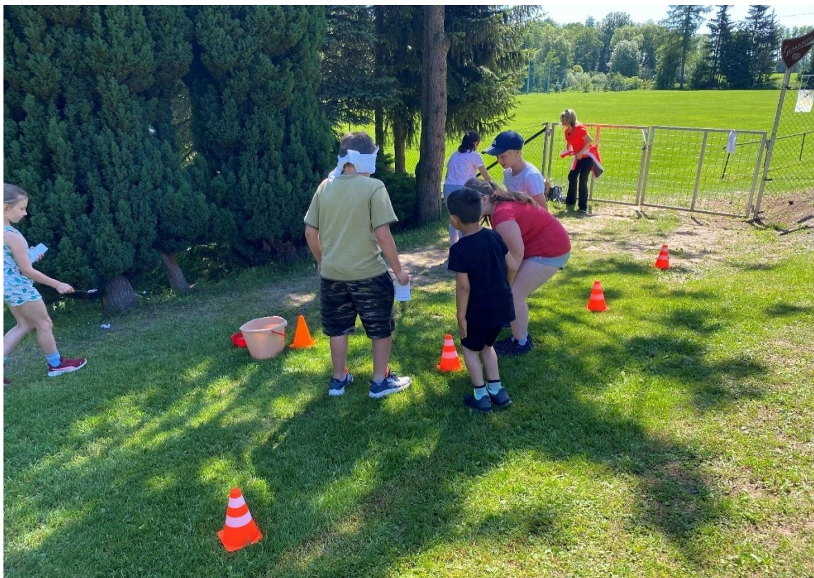
Srandamatch – Semanín

V letošním školním roce začala spolupráce se Základní školou a mateřskou školou Pramínek v Semaníně.