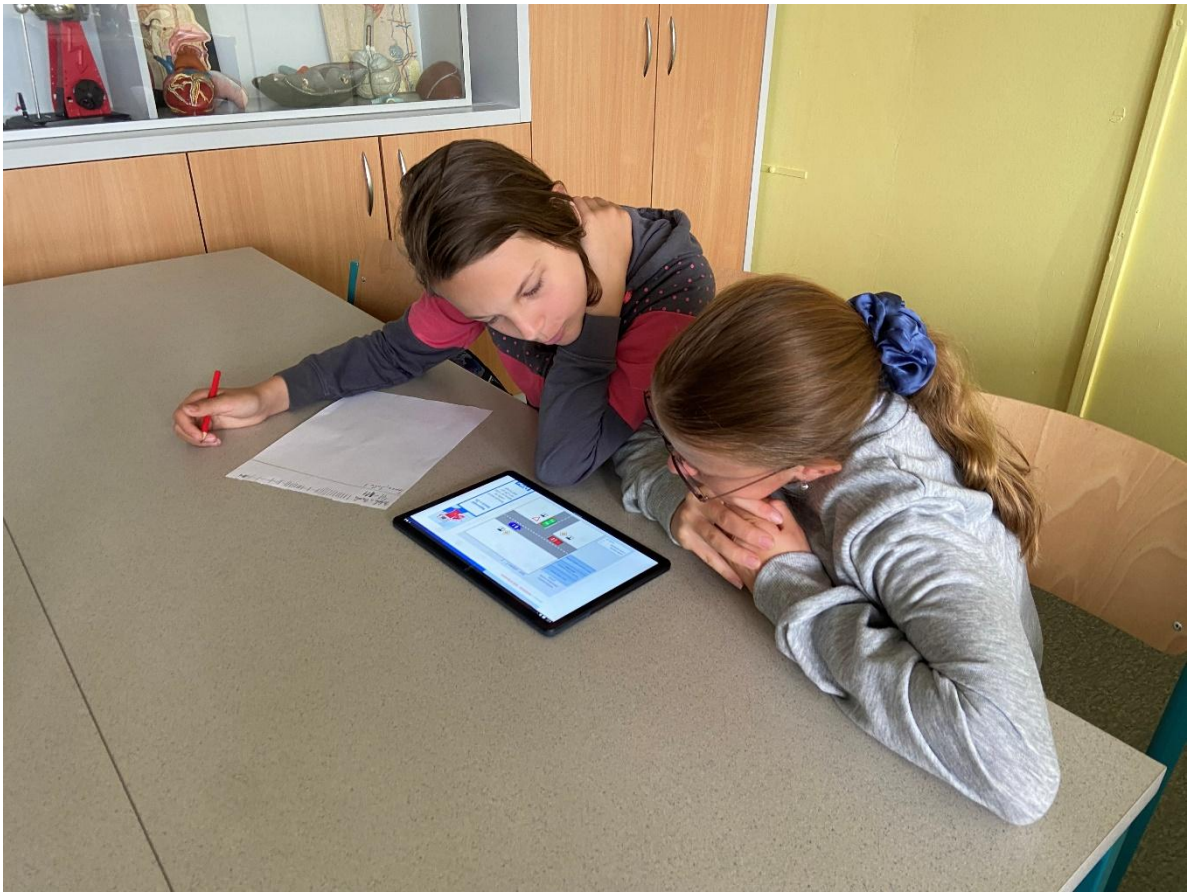
Markétina dopravní výchova