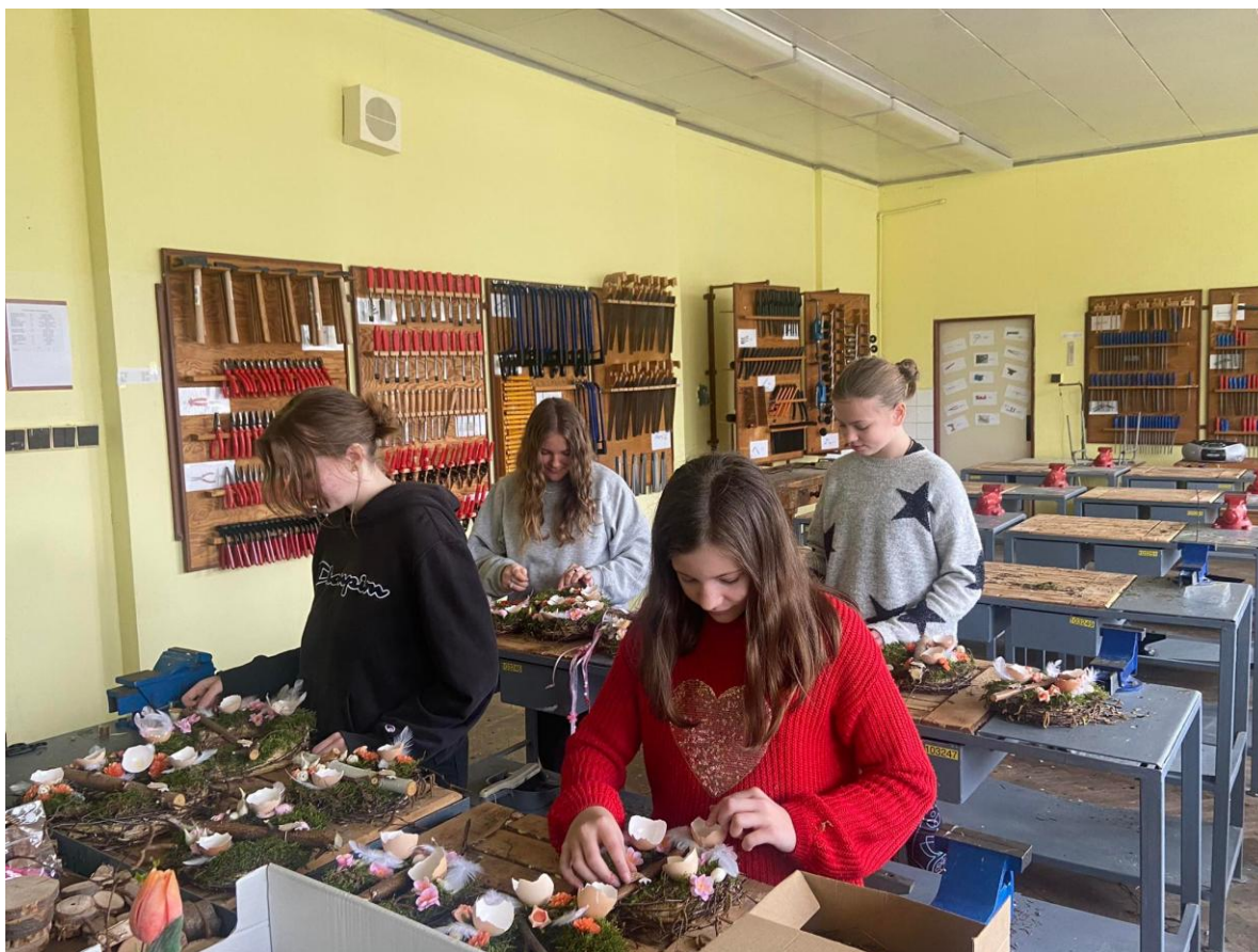
Tvoříme z přírodních materiálů