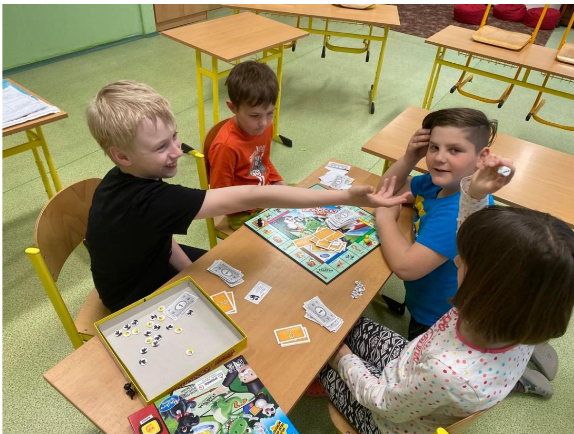
Klub deskových her a zábavné logiky