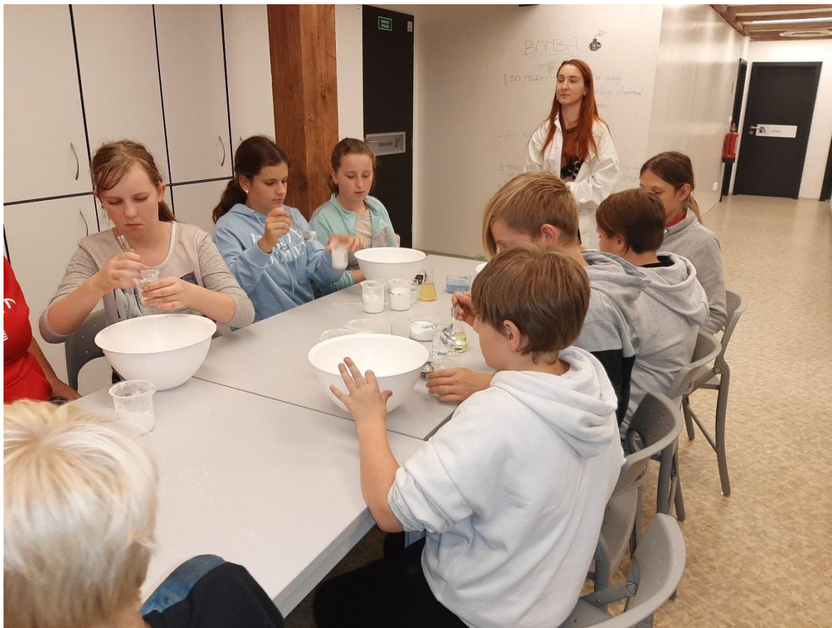
Projektový den mimo školu – Pevnost poznání