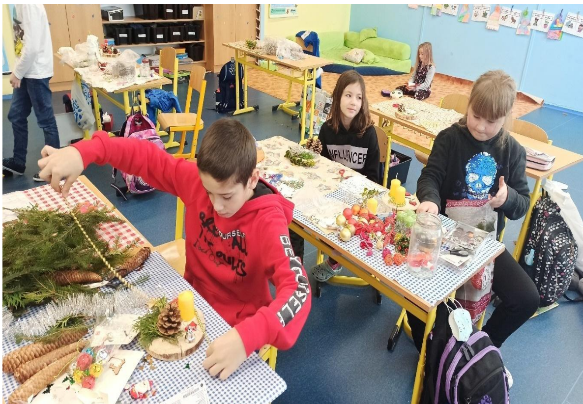
Tvoříme z přírodních materiálů