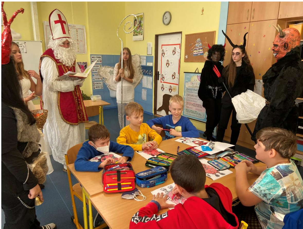
Tradiční mikulášská nadílka