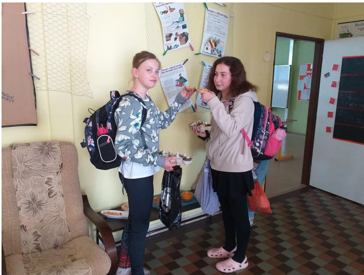
Ochutnávka svačinky připravené staršími spolužáky