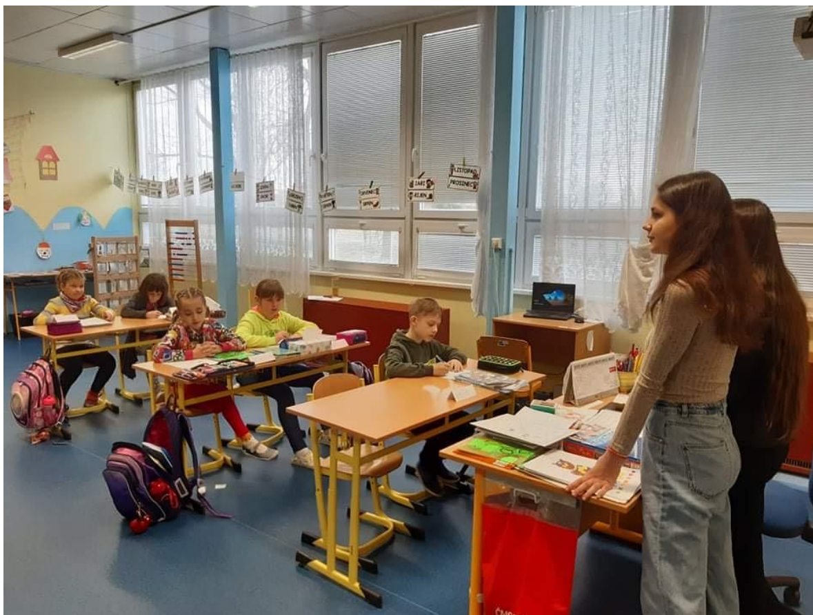
„Škola naruby“ – tradiční akce 9. ročníku