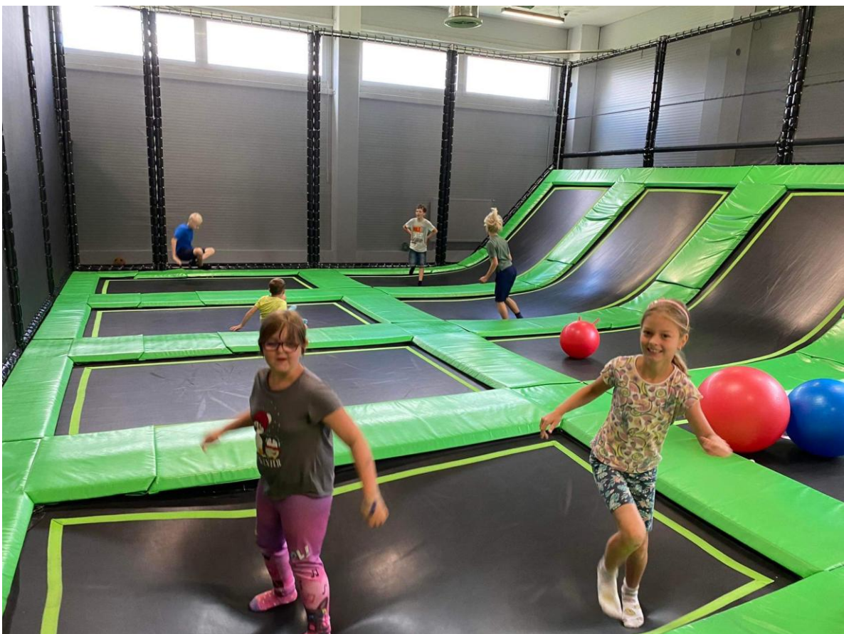
SkipiFunpark - Letohrad