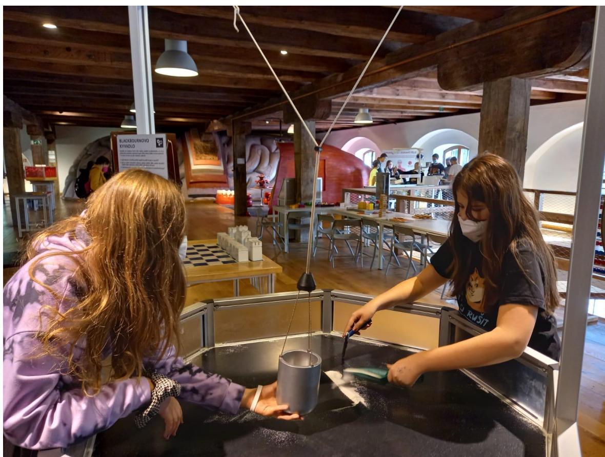
Projektový den mimo školu – Pevnost poznání

V projektu jsme se v mateřské škole zaměřili na projektové dny ve škole. Na základní škole jsme se zaměřili na vedení badatelského klubu, vedení klubu ICT a klubů zábavné logiky a deskových her a na projektové dny mimo školu a projektové dny ve škole. V rámci projektového dne mimo školu navštívili žáci 2. stupně Pevnost poznání v Olomouci, kde si vyzkoušeli spoustu různých interaktivních exponátů, navštívili planetárium a pracovali v dílničkách dle vlastního výběru.