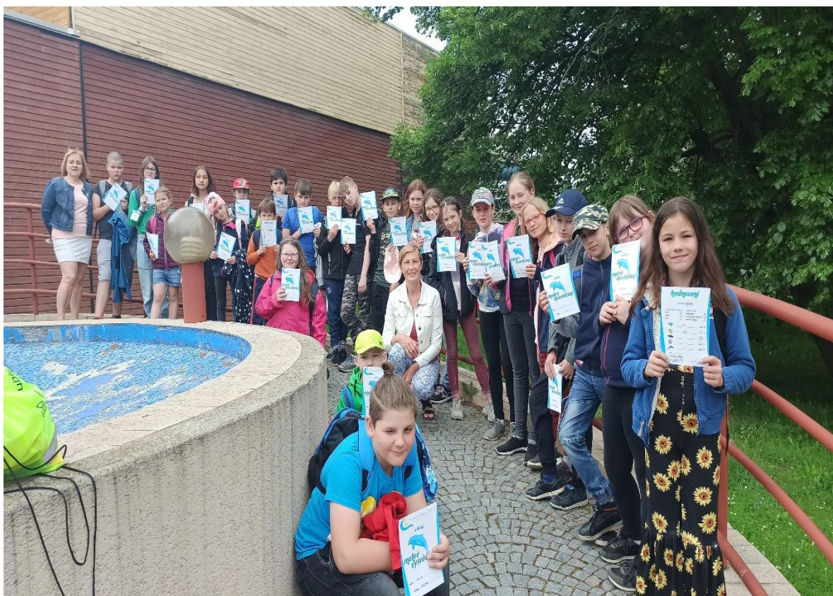
Plavecký výcvik Svitavy