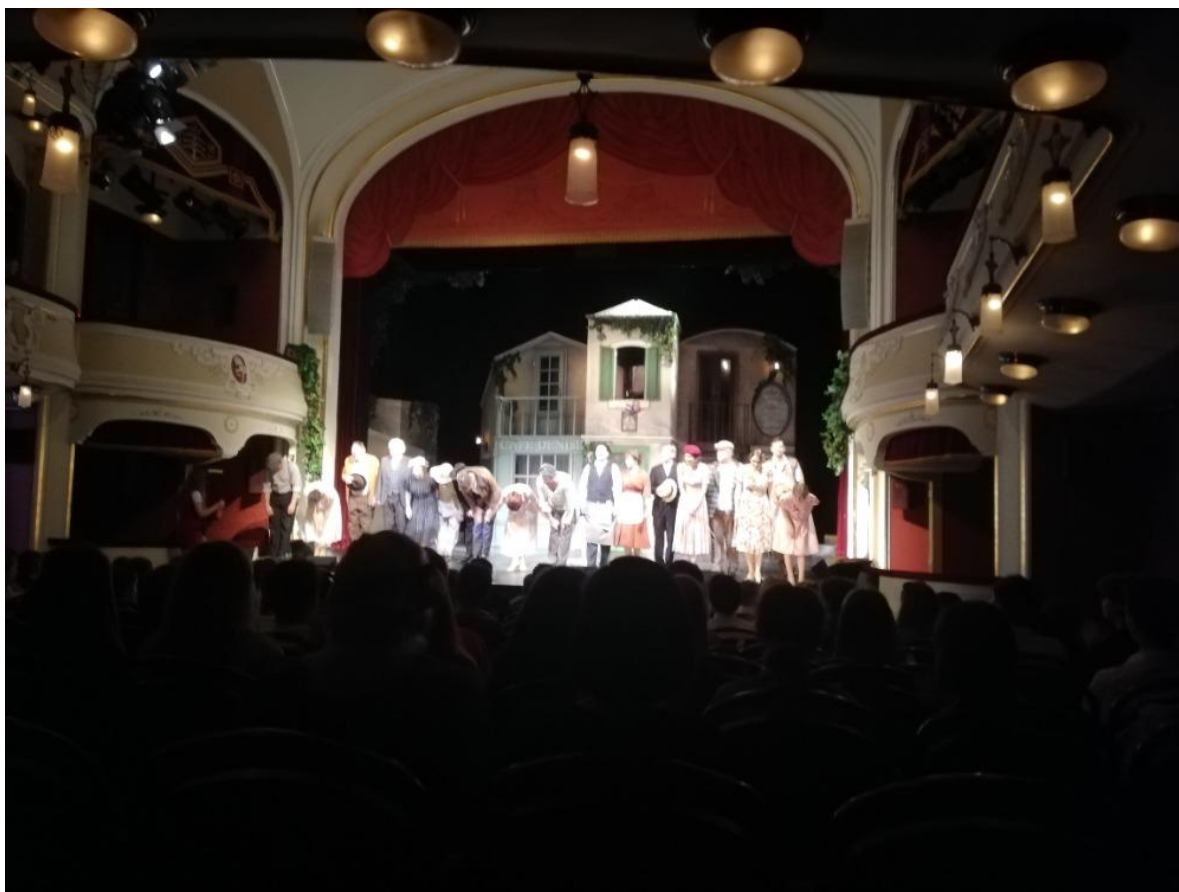
Divadelní představení „Pekařova žena“ – Pardubice