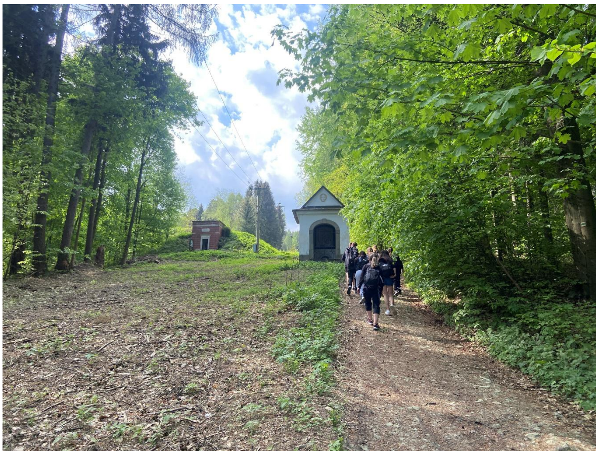
Exkurze – Suchý vrch