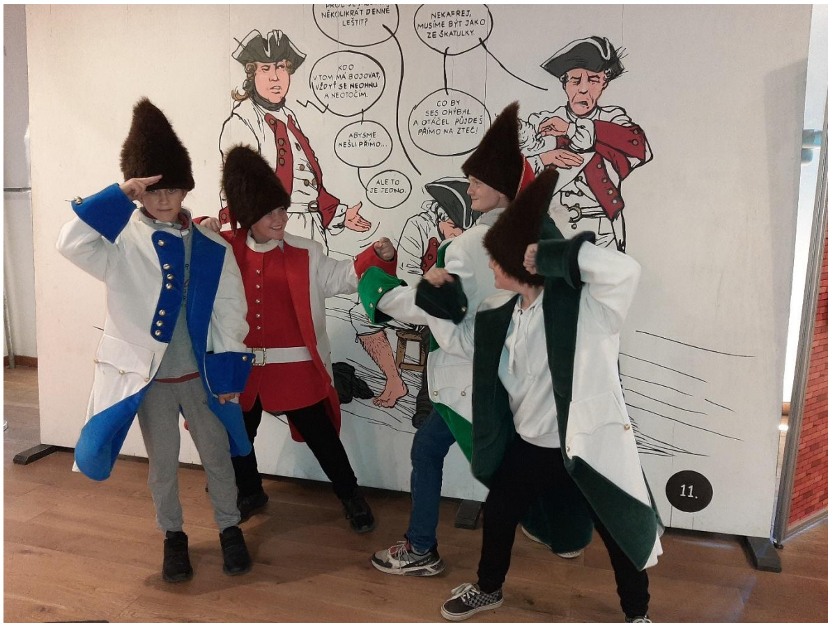
Projektový den mimo školu – Pevnost poznání