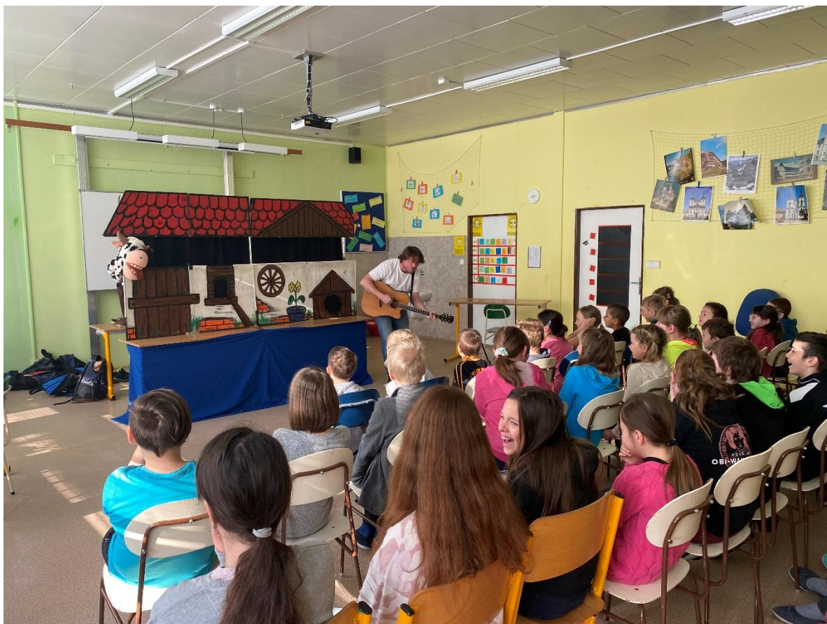
„Pohádky ze statku“ – Divadélko pro školy Hradec Králové