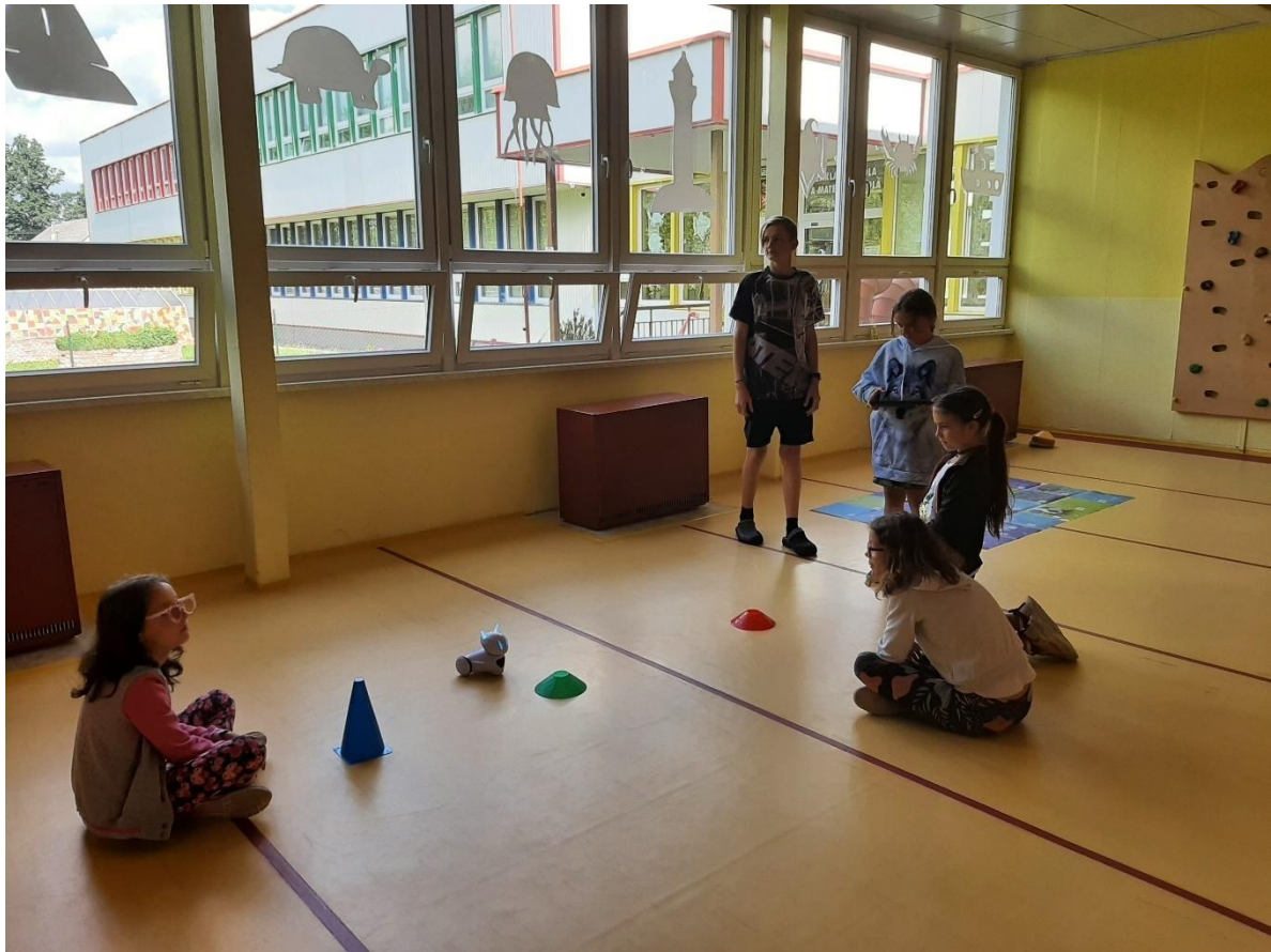
Den s robotikou v Damníkově