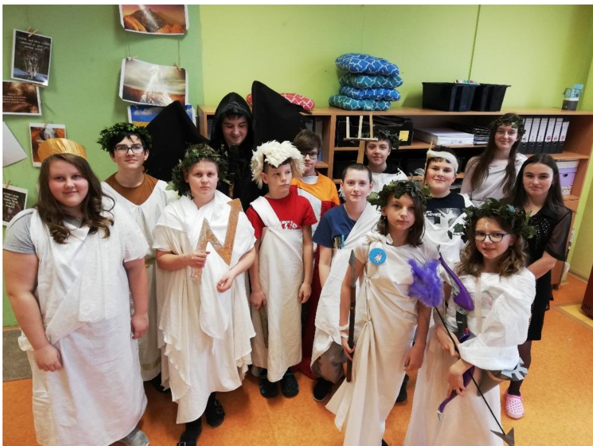
Hodina českého jazyka – Staré řecké báje a pověsti