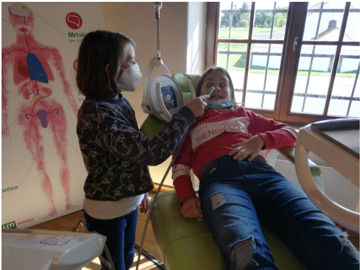
Projektový den mimo školu – Pevnost poznání