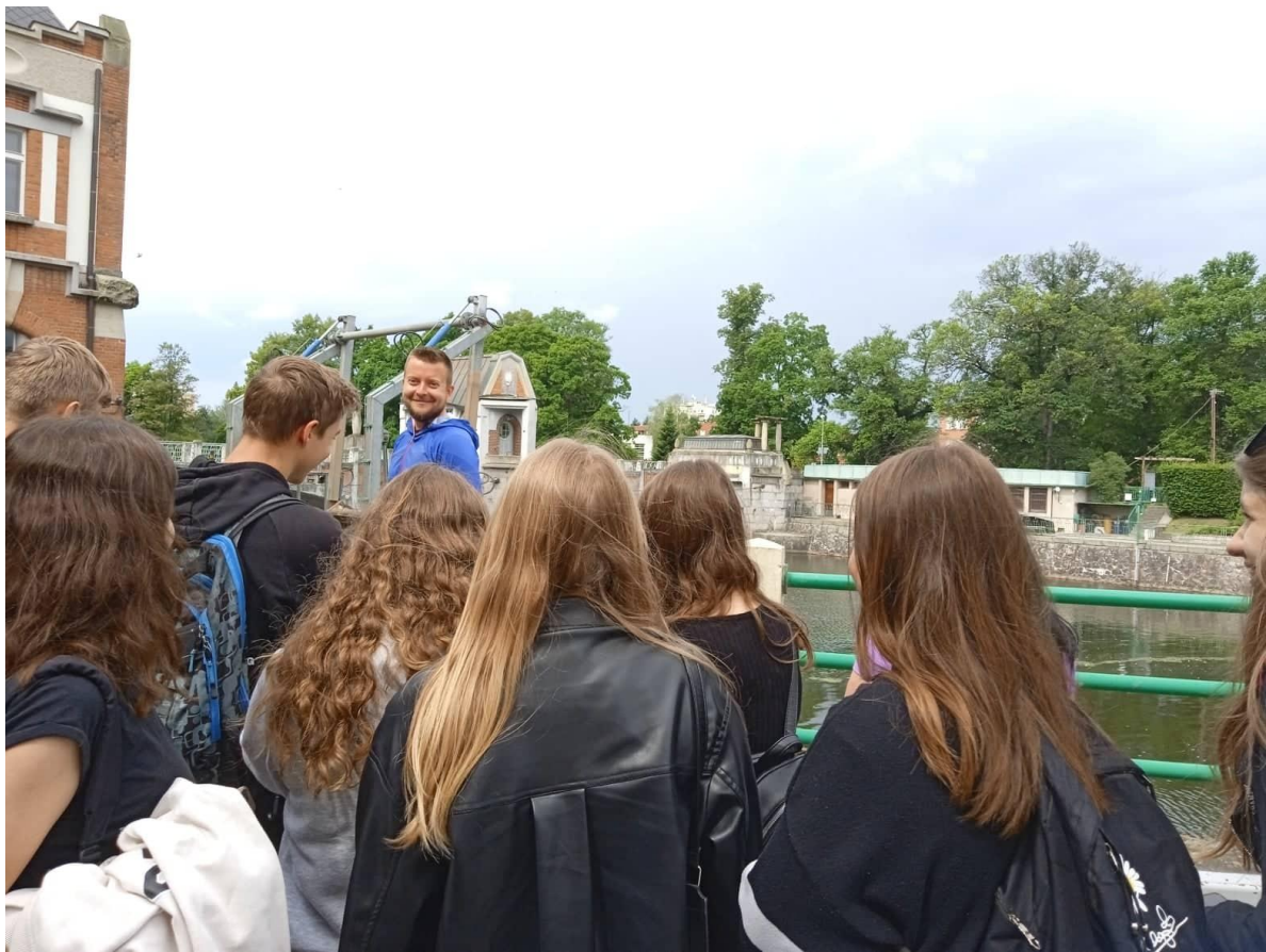
Exkurze Hučák – vodní elektrárna Hradec Králové