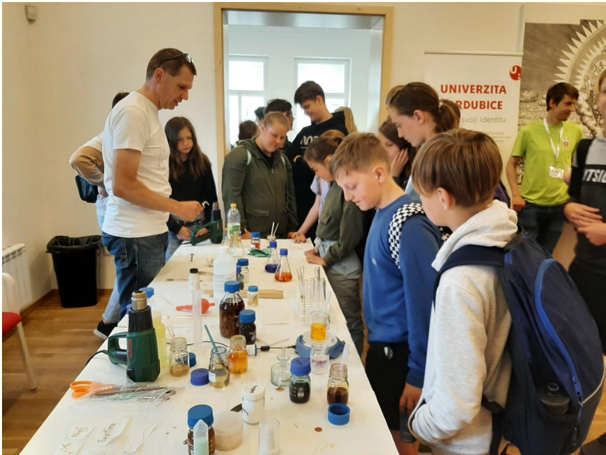
Dny s Univerzitou Pardubice