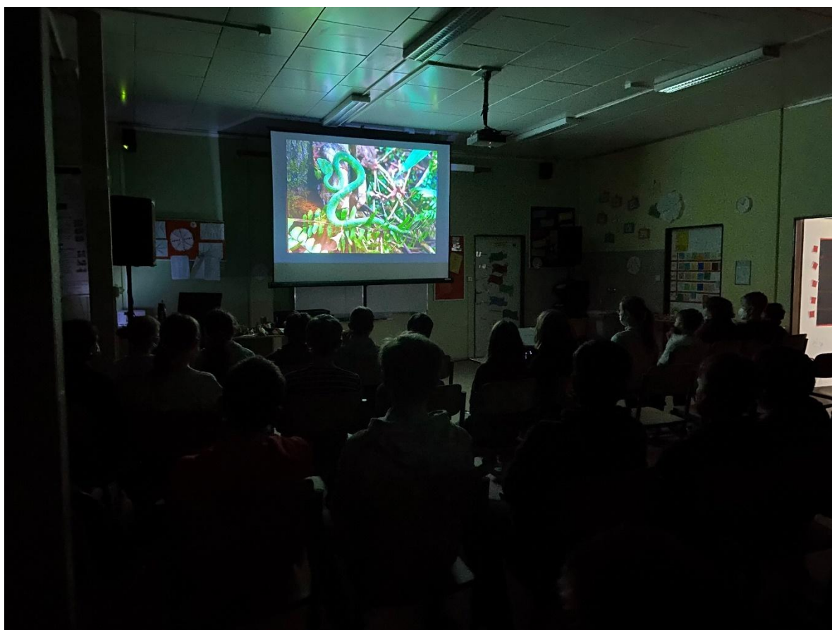
„Borneo“ – výchovně vzdělávací program