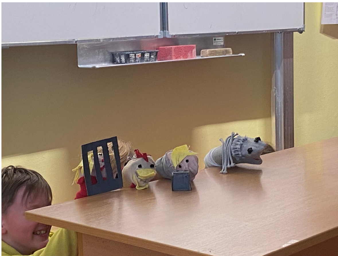
Literárně – dramatická výchova