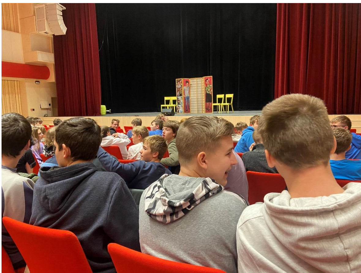
„Ten trapas nepřeziju“ – divadlo Praha