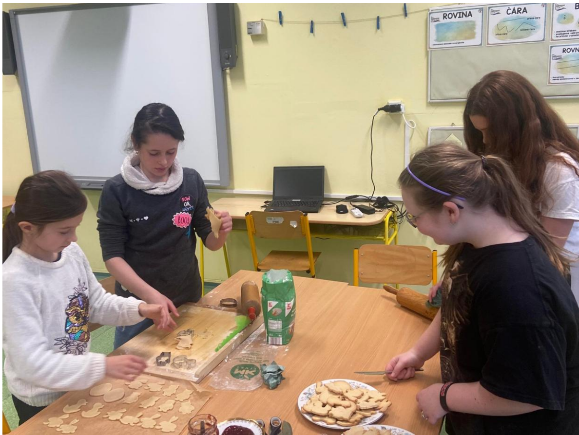
Tvoříme pro výstavy