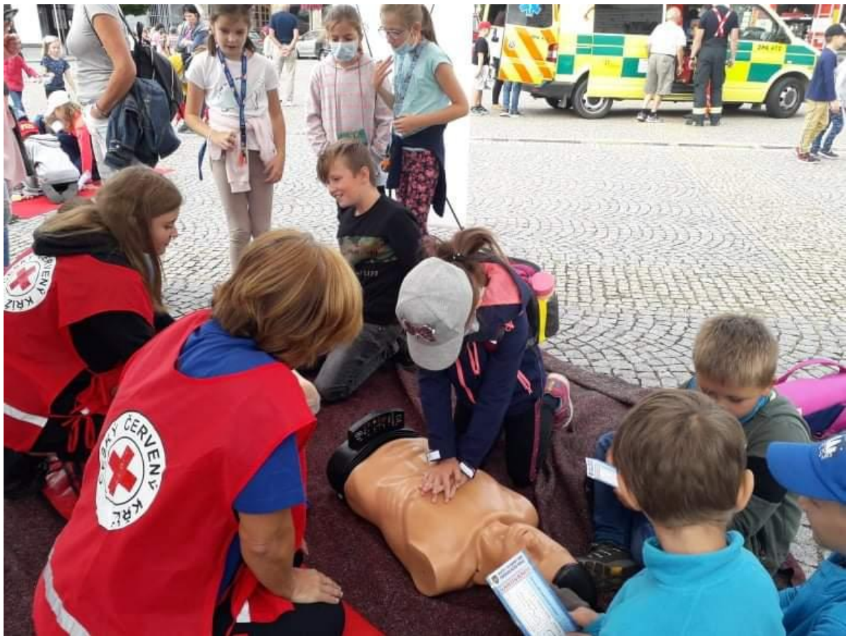
Den se záchranným systémem