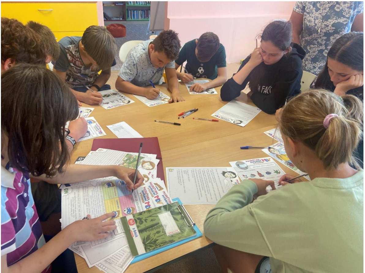
Markétina dopravní výchova