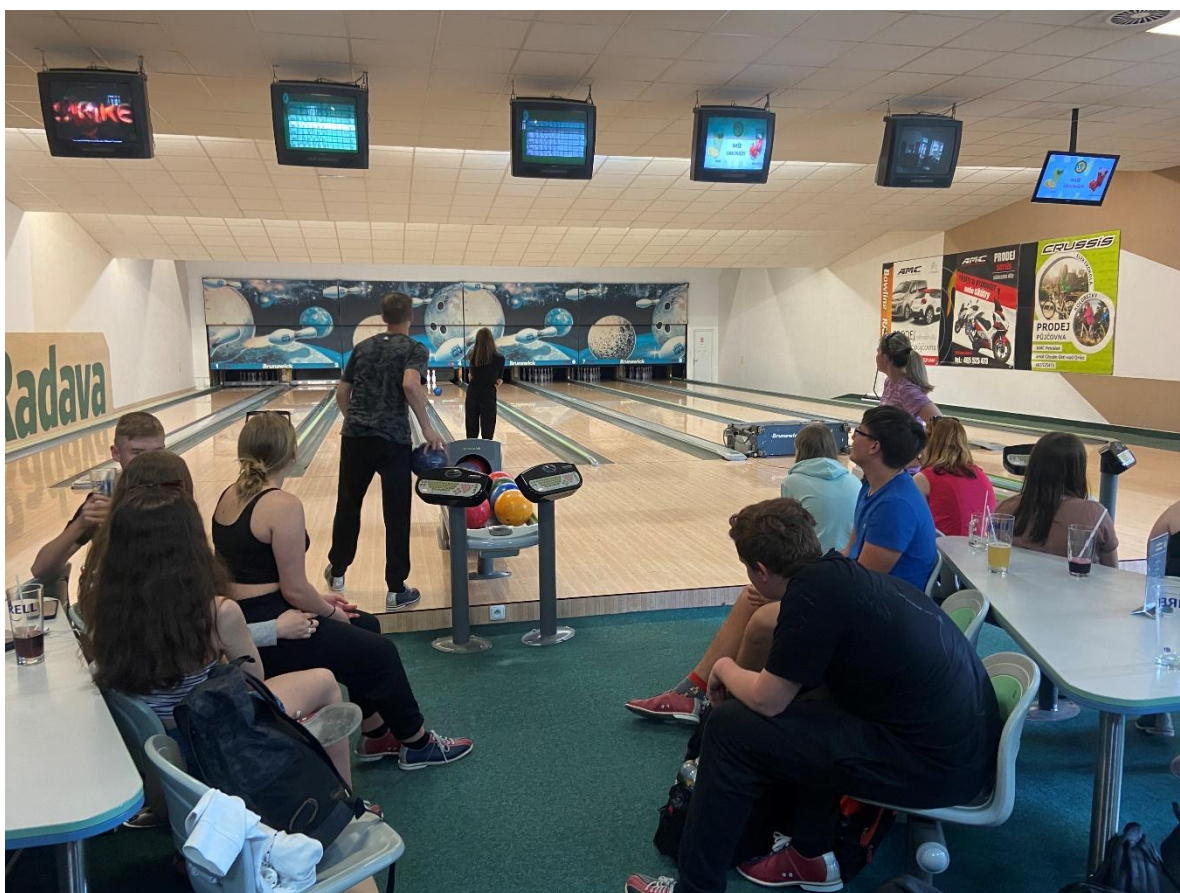
Bowling – Ústí nad Orlicí