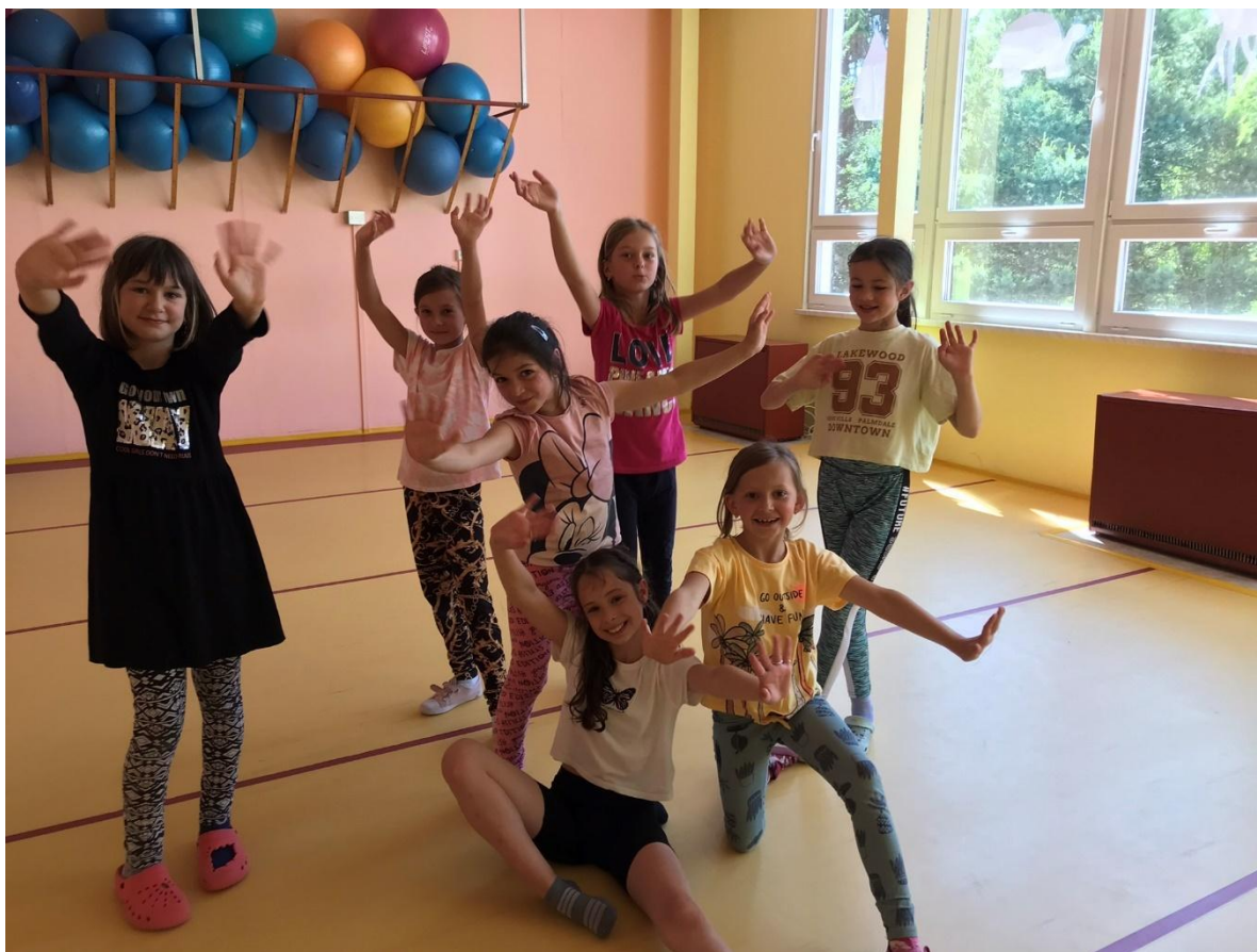
Taneční kroužek Šmoulinky