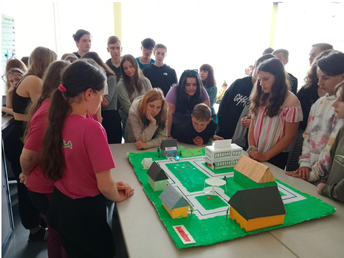
Seznamujeme spolužáky se svými projekty na Microtele