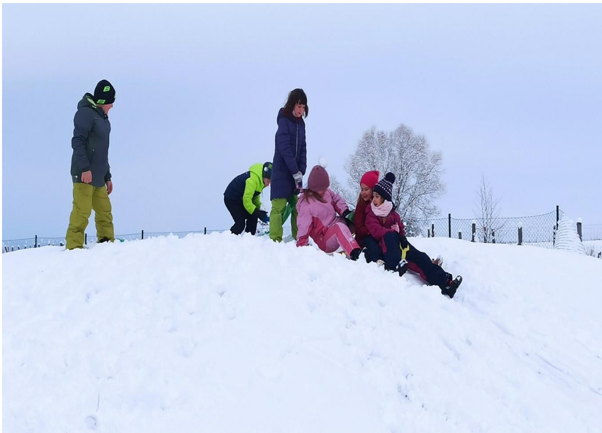
Hrátky na sněhu