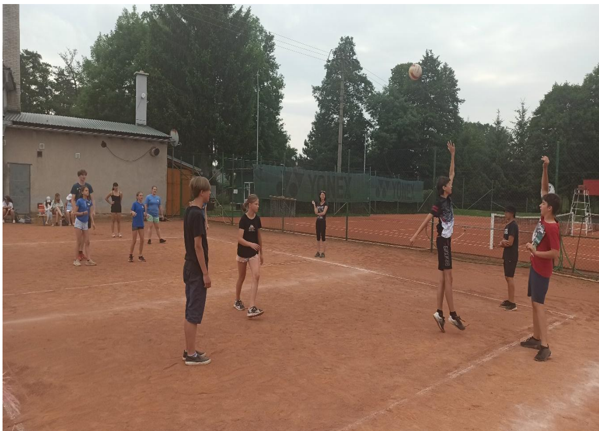
Turnaj ve vybíjené