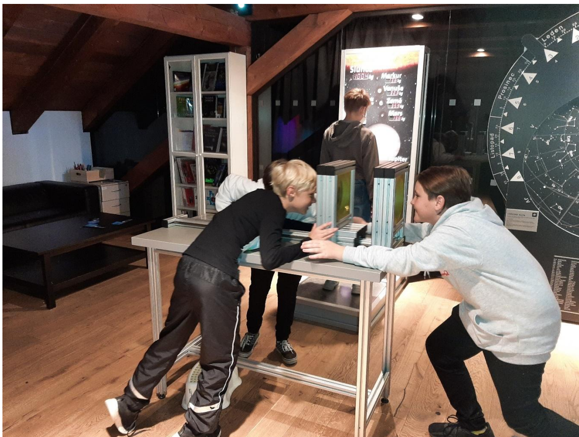
Projektový den mimo školu – Pevnost poznání