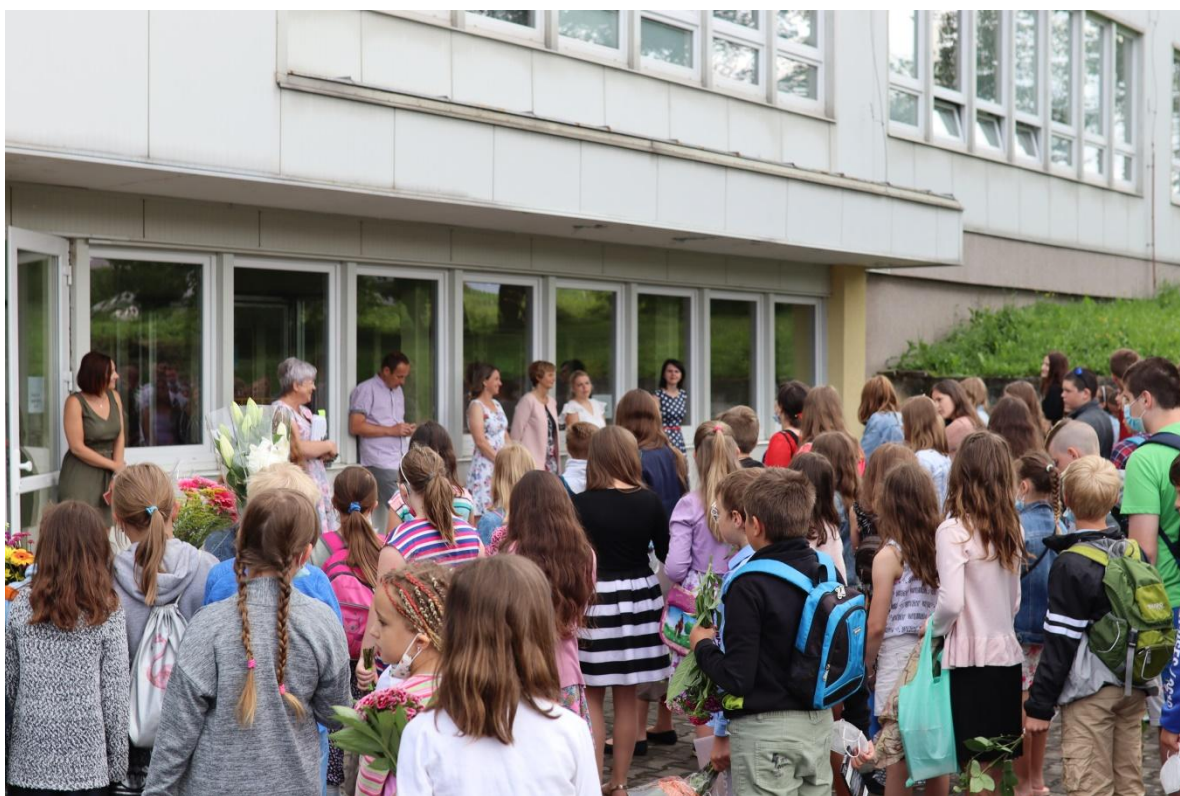
Slavnostní ukončení školního roku a předání knižních odměn