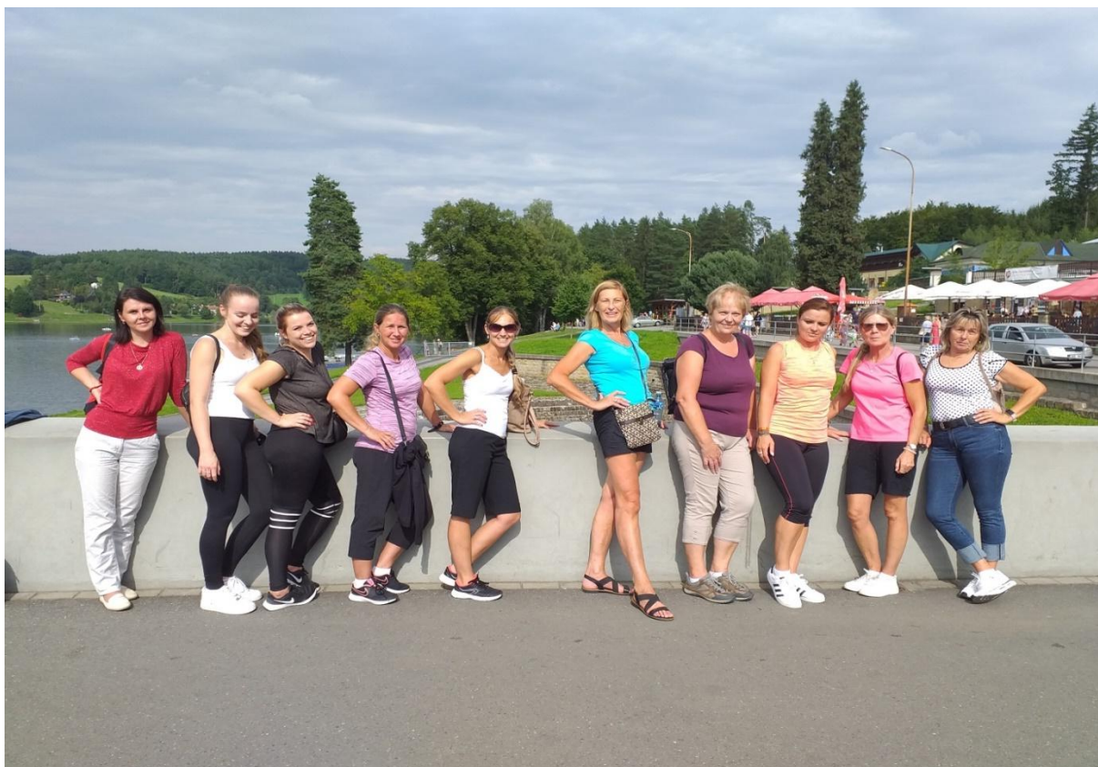
Využití volného času mezi jednotlivými bloky školení v Luhačovicích