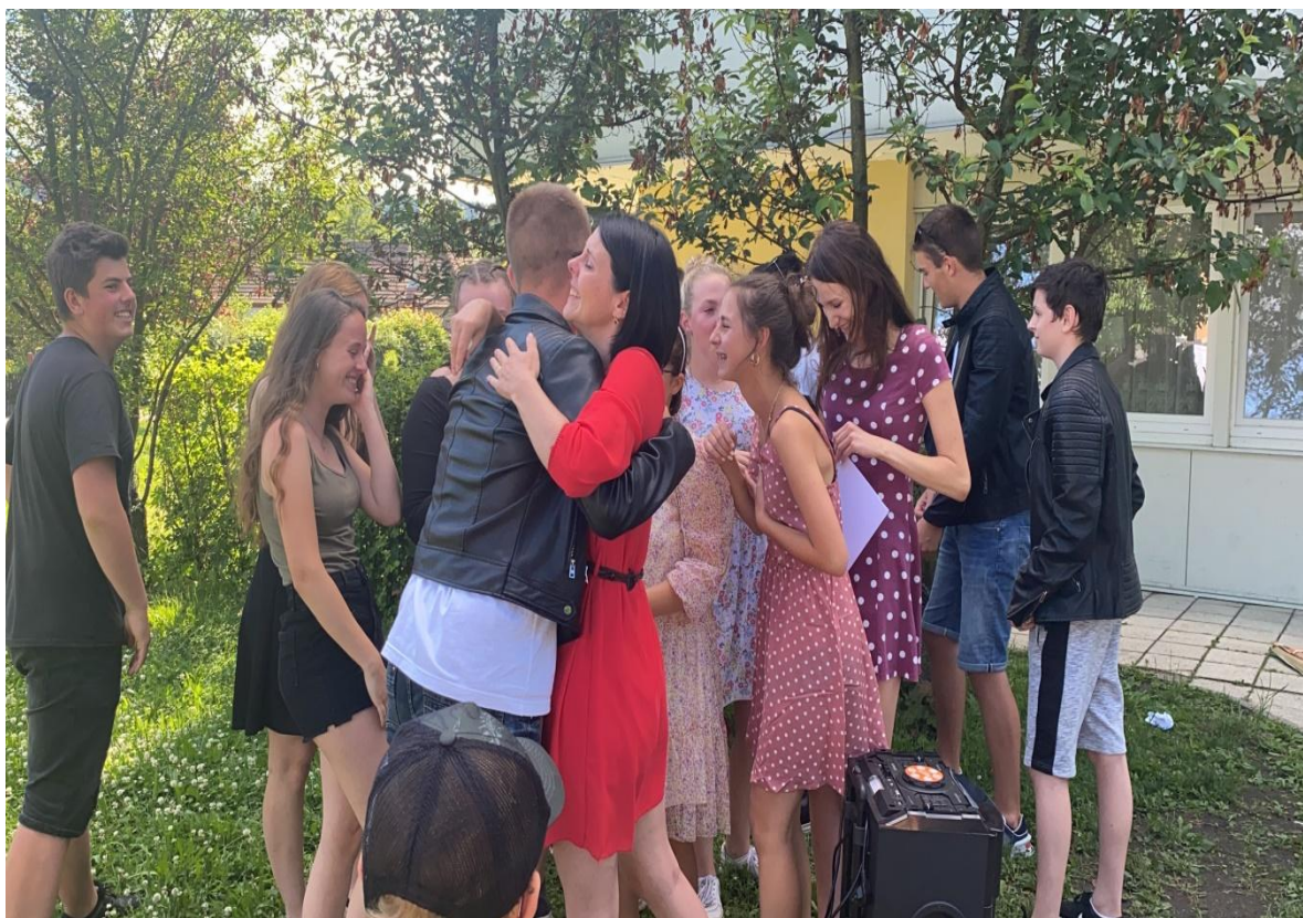
Rozloučení s třídní učitelkou