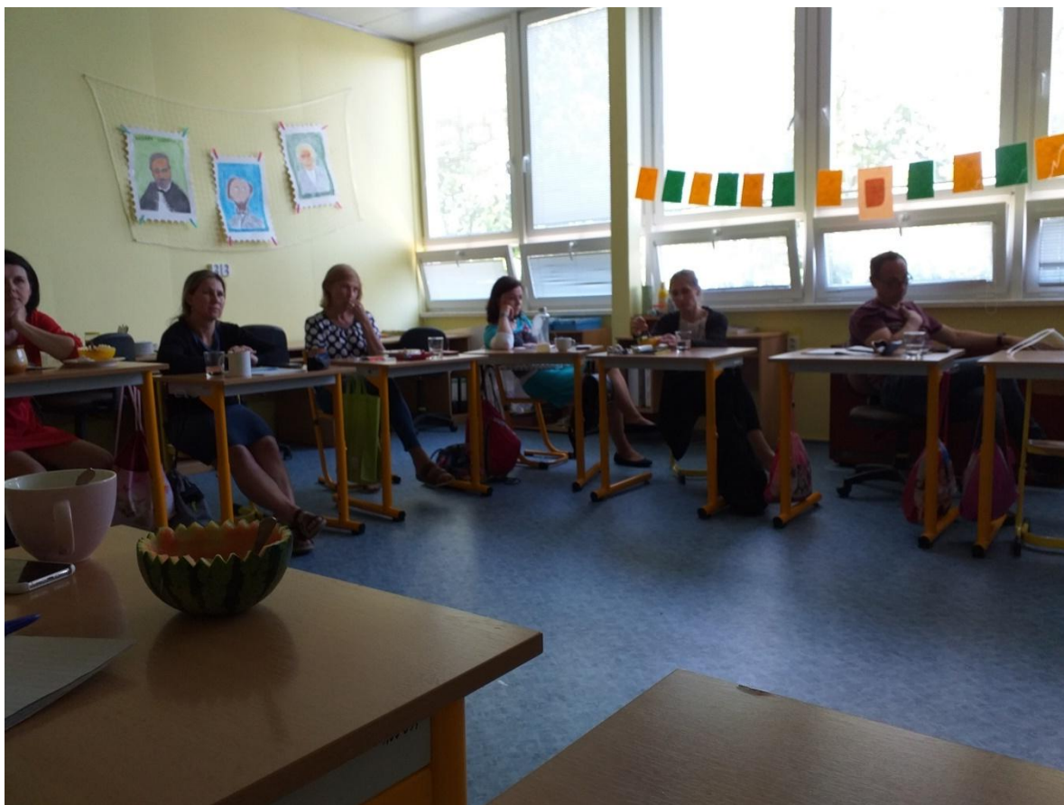
Práce s časem a psychohygienu učitele