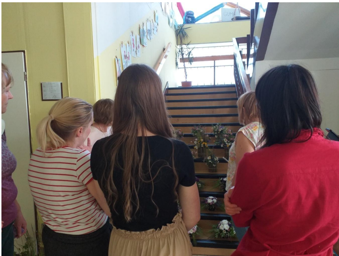
„Odpočinkové semináře“ – tvorba z přírodnin