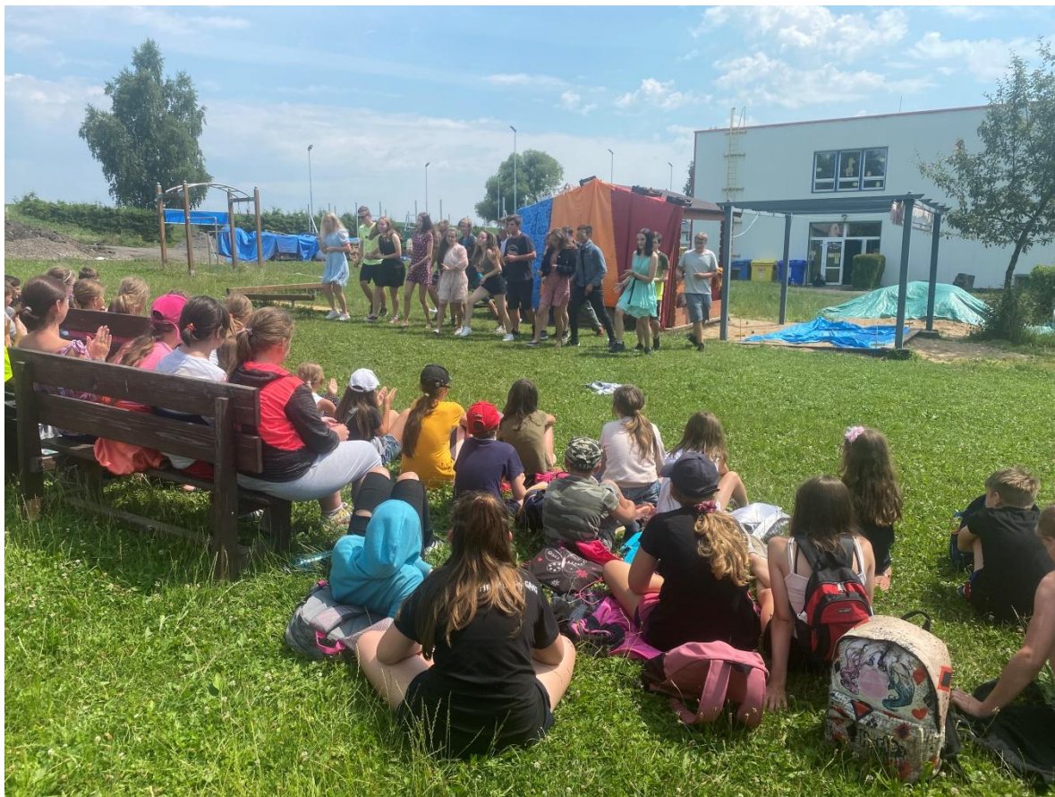
Rozloučení žáků 9. ročníku s ostatními spolužáky