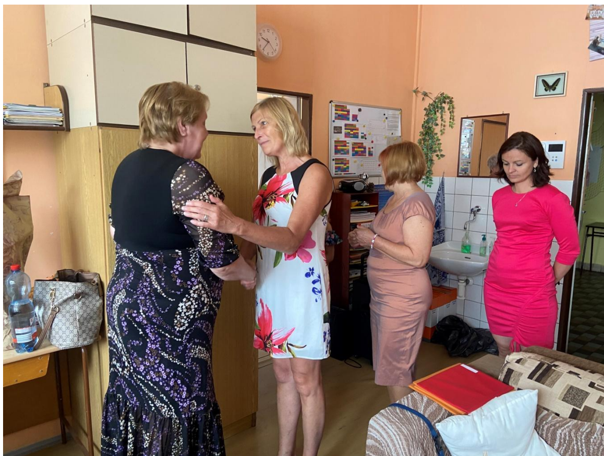
Rozloučení s kolegyní – odchod do důchodu